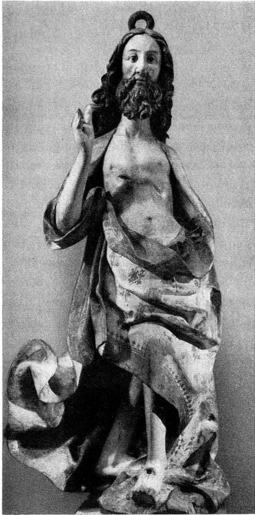
Fig. 1. Martin Gramp, Christ de l'Ascension, 1503; polychromie de Hans Fries (après restauration). Musée d'art et d'histoire de Fribourg

un ton qui n'est pas à l'unisson de la grande voix pathétique du peintre. On n'y trouve point la vivacité et la fantaisie qui inspirent les meilleures œuvres des deux artistes. Il y a en eux, dans le saint Pierre plus particulièrement, une gentillesse qui nous incline au réflexe normal de prudence, consistant à suggérer l'intervention de l'atelier.