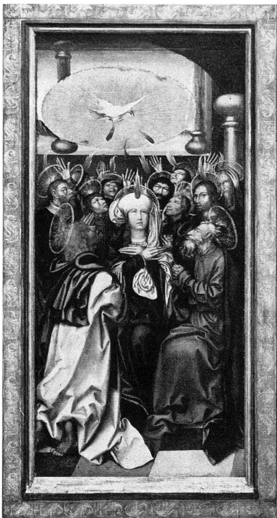
Fig. 2. Hans Fries, Le retable du Bugnon, 1506–1507 environ: Descente du Saint Esprit. Dépôt de la Fondation Gottfried Keller au Musée d'art et d'histoire de Fribourg