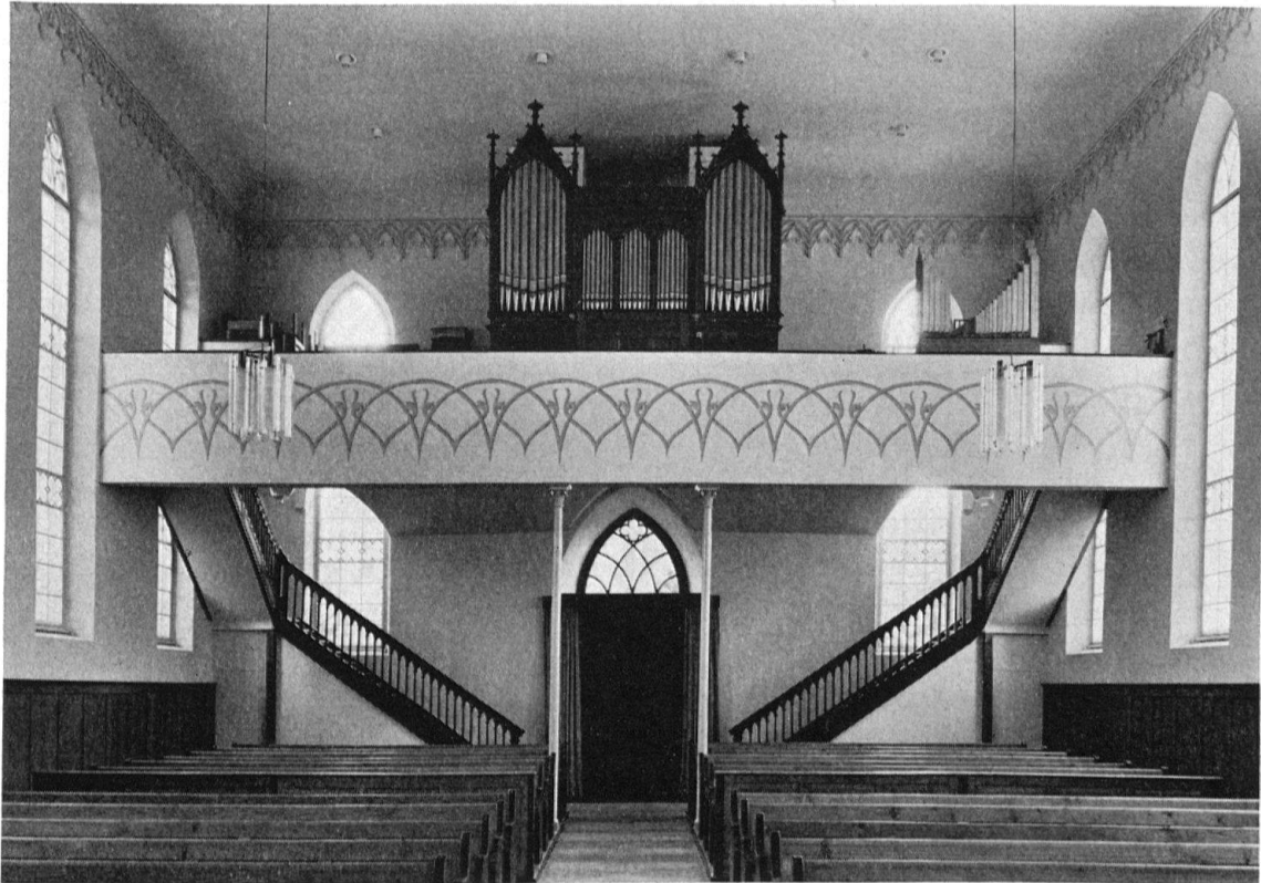
Ref. Pfarrkirche Berlingen. Westempore und neugotischer Orgelprospekt

sondern glaubte an einen neu zu schaffenden Stil, der unter der Führung des einen die Vorzüge und Schönheiten der andern miteinzubeziehen versuchen müsse. Ein typisches Beispiel bietet der neugotische Umbau von St. Laurenzen in St. Gallen (1849–1855). Als der geniale Ersteller der Umbaupläne, Johann Georg Müller, starb, wählte der Zürcher Architekt Stadler, den Turmhelm im Sinne reiner Gotik abändern zu müssen, weil Müllers «Gotik» sich noch anderer, außergotischer Motive habe bedienen wollen.