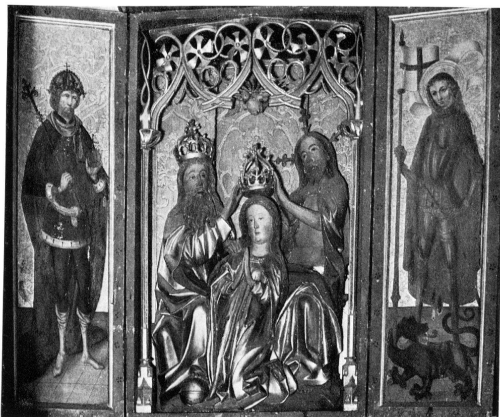
Fürgangen (Gemeinde Bellwald). Marienkrönungs-Altären

einerseits den Hochaltar, welcher 1904 aus Fragmenten zusammengestellt wurde, die sich bis dahin an den Kirchenwänden und auf dem Estrich verstreut befanden. Nur noch die Malereien der Flügel sind unverfälscht. Der Schrein samt dem reichen Gesprenge ist neu und die Skulpturen haben nicht nur ihre Originalfassung verloren, sondern der unglückliche Altarbauer von 1904 veränderte durch bedeutende Nachschnitzungen sogar ihre plastische Erscheinung. Diesem ziemlich traurigen Beispiel steht in der St. Annakapelle der prunkvolle Schnitzaltar des Stifters Georg Supersaxo gegenüber. Er blieb von den Eingriffen späterer Altarbauer und Kirchenmaler verschont. Mit seiner reichen Fassung zeigt er, von unwesentlichen natürlichen Alters- und Abnutzungsspuren abgesehen, den originalen Zustand. Wenn wir uns vergegenwärtigen, wie bestimmend die Polychromie für die Gesamterscheinung dieser Kunstwerke ist – man darf hier geradezu von dreidimensionalen Gemälden sprechen – dann wird klar, wie wichtig die unverfälschte Erhaltung ihrer Originalfassung ist.