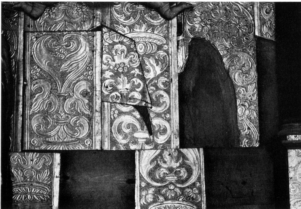
Eggen (Gemeinde Bellwald). Detail des obigen Altars: Rückwand, aus Teilen des gotischen Damastgrundes zusammengezimmert

An den drei kleinen Altärchen auf der Alp Findelen (Zermatt), in Pralong und im Valeria-Museum Sitten fehlen wesentliche Teile, wie auch an den abgeänderten und in Renaissance- oder Barock-Altararchitektur eingebauten Schreinen in Eggen (Bellwald), Bitzinen und in der Grabkapelle des Bischofs Walter Supersaxo in der Kathedrale Sitten.