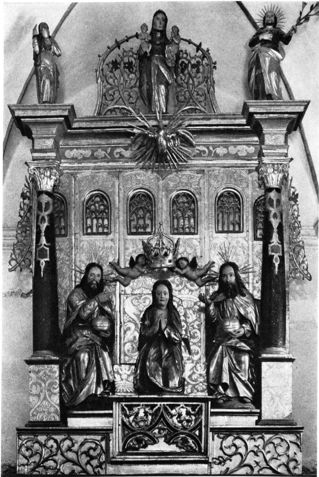
Eggen (Gemeinde Bellwald). Fragmente eines gotischen Schnitzaltars, zusammengestückt zu einer Renaissance-Altararchitektur