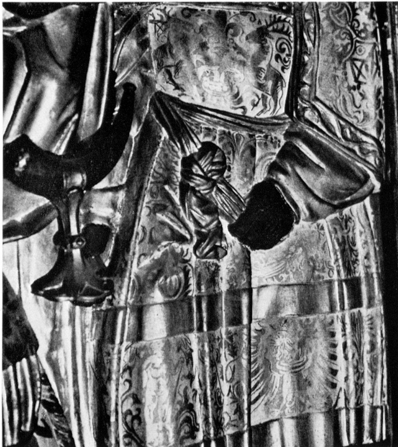
Glis. Altar des Stifters Georg Supersaxo. Detail, reich ornamentierte Vergoldung, in Sgraffitotechnik aus Lasuren herausgearbeitet

In diesem Zusammenhang dürften die beiden gotischen Flügelaltäre der Pfarrkirche Glis aufschlußreich sein. Sie seien als Beispiele für den sehr unterschiedlichen Zustand herausgegriffen. Es handelt sich sozusagen um zwei Extreme unter einem Dach, nämlich