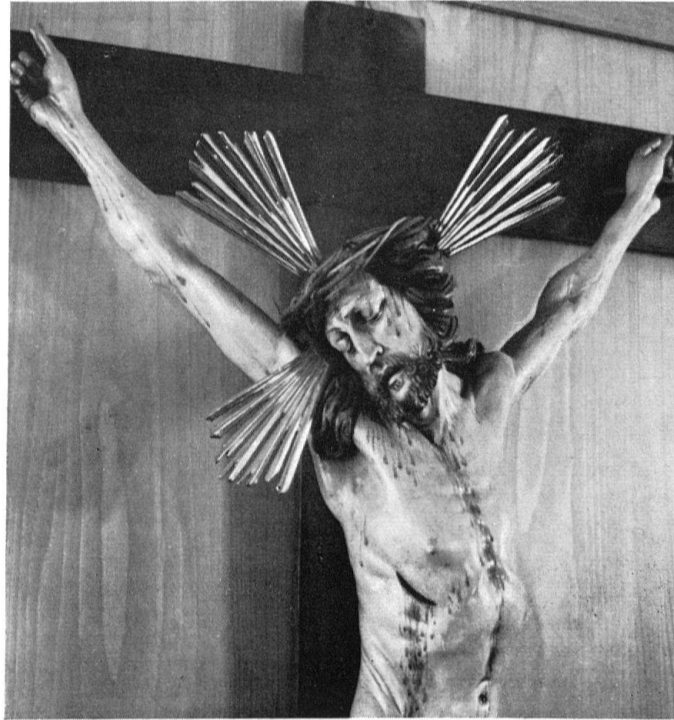
Kapuzinerkloster Wil. Christoph Daniel Schenck, Kruzifix im Refektorium, um 1657. Detail

genannt, der das Refektorium auf seine Kosten erstellen ließ. Es ist anzunehmen, daß zu dieser großzügigen Stiftung nicht nur Boden und Decke, Täfer und Innenläden, Tische und Bänke, Lavabo und Ofen zählten, sondern auch das Kruzifix, da hierfür keine besondere Vergabung erwähnt wird. Im Jahre 1657 konnten die Kapuziner ihr neu-erbautes Kloster beziehen, das Refektorium muß also zu dieser Zeit fertiggestellt gewesen sein. Somit ergibt sich als wahrscheinlichste Entstehungszeit des Schenckschen Kruzifixus das Jahr 1657.