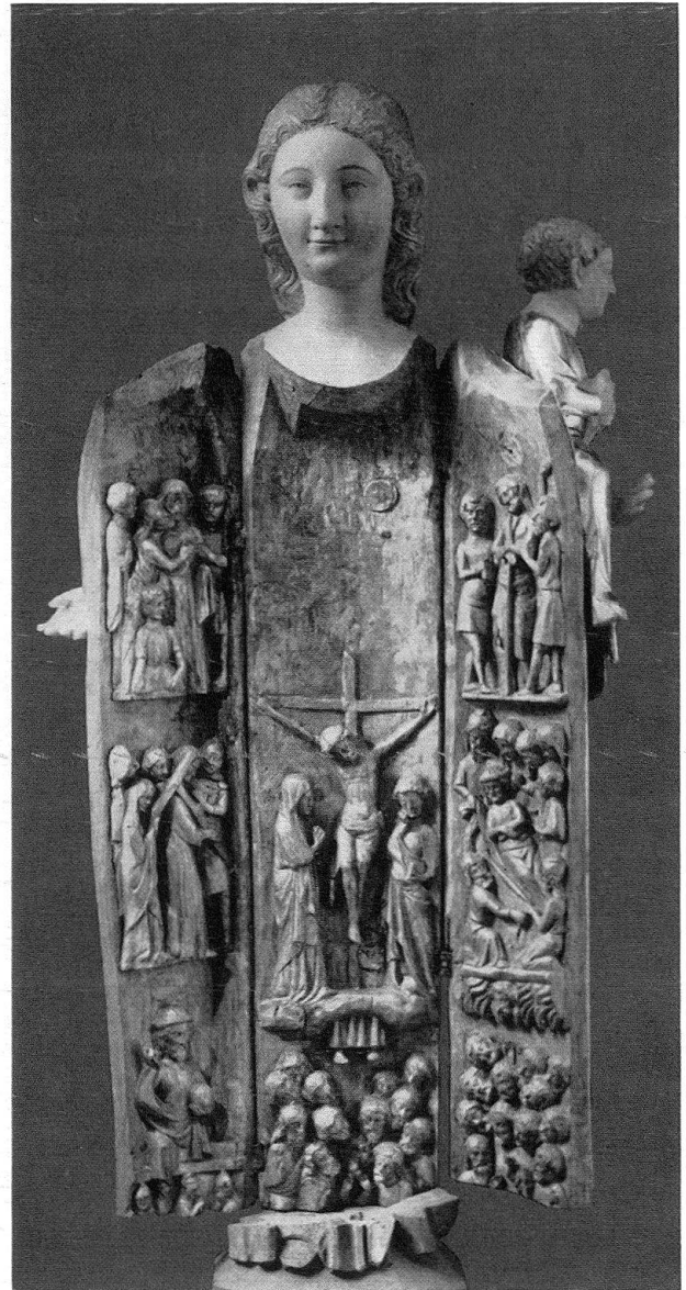
Cheyres. Vierge à l'enfant, ouvrante, second quart du XIV e siècle