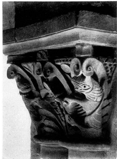
Payerne, Abbatale. Chapiteaux de l'abside: saint Pierre et le Christ accompagnés d'archanges; animaux

capitulaire reconstruite après l'incendie de 1237. Le château , siège des autorités communales, a été construit en 1640 pour le bailli, sur l'emplacement des bâtiments conventuels, la cour étant l'ancien cloître avec le puits. A la porte du tribunal précieux heurtoirs de bronze romans à tête de lion. Dans la salle de justice de paix des fresques du peintre Mareschet 1576.