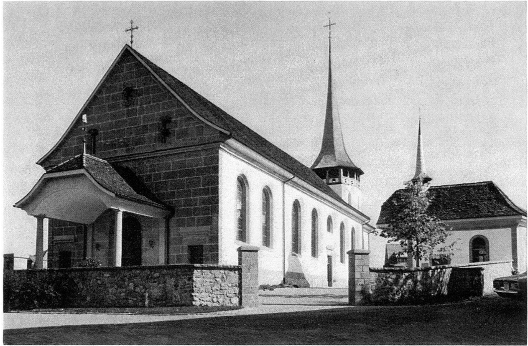
Tavel. Eglise et chapelle St-Jacques