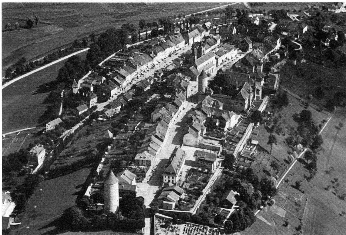
Romont. Vue aérienne du sud

Ville connue dès le XIII e siècle, située sur une colline, avec une enceinte en partie conservée (tour à Boyer XIII e siècle). Château appartenant aux comtes de Savoie vers 1240, avec un donjon terminé vers 1261/62, à Fribourg à partir de 1536, reconstruit en partie vers 1581. Fontaine 1772. L'église Notre-Dame de l'Assomption fondée en 1244, incendiée en partie en 1434, reconsacrée en 1451, est entièrement voûtée sur ogives; certaines voûtes sont cependant postérieures à 1478. Le chœur rectangulaire et la nef accompagnée de bas-côtés précédés de la chapelle du portail formant comme un narthex (XIII e siècle). Portail à tympan sculpté (Christ en Majesté XIII e siècle), chaire en pierre