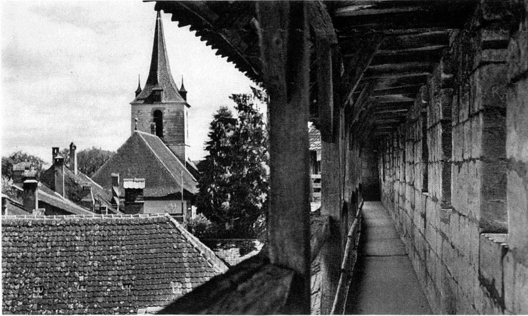
Morat. Les remparts