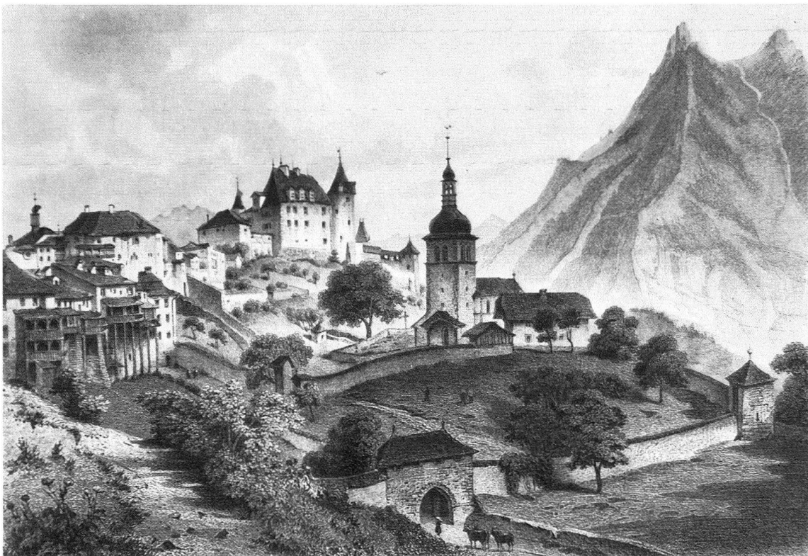
Gruyères. Vue de la ville, du château et de l'église par Ernst Georg Gladbach

L' église des Capucins de 1673-1688 est ornée d'un maître-autel de Pierre Ardieu de 1688 et de deux autels latéraux sculptés de 1690 et 1691.