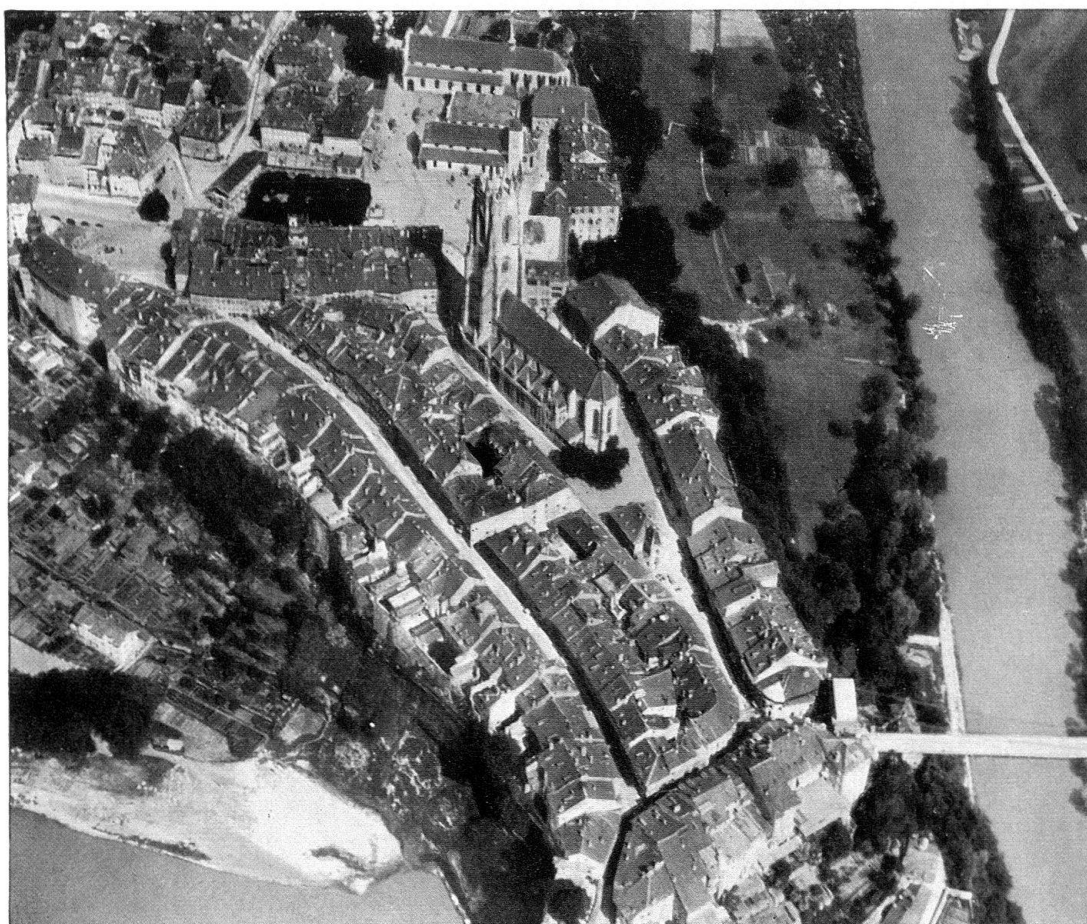
Fribourg. Vue aérienne du sud

Nombreuses sont les institutions religieuses qui s'installèrent à Fribourg. Dès le XIII e siècle ont y trouve: les Cisterciennes à la Maigrauge (église 1265/84, Christ au tombeau vers 1330), les Augustins en l'Auge (église de St-Maurice 1255, maître-autel des frères