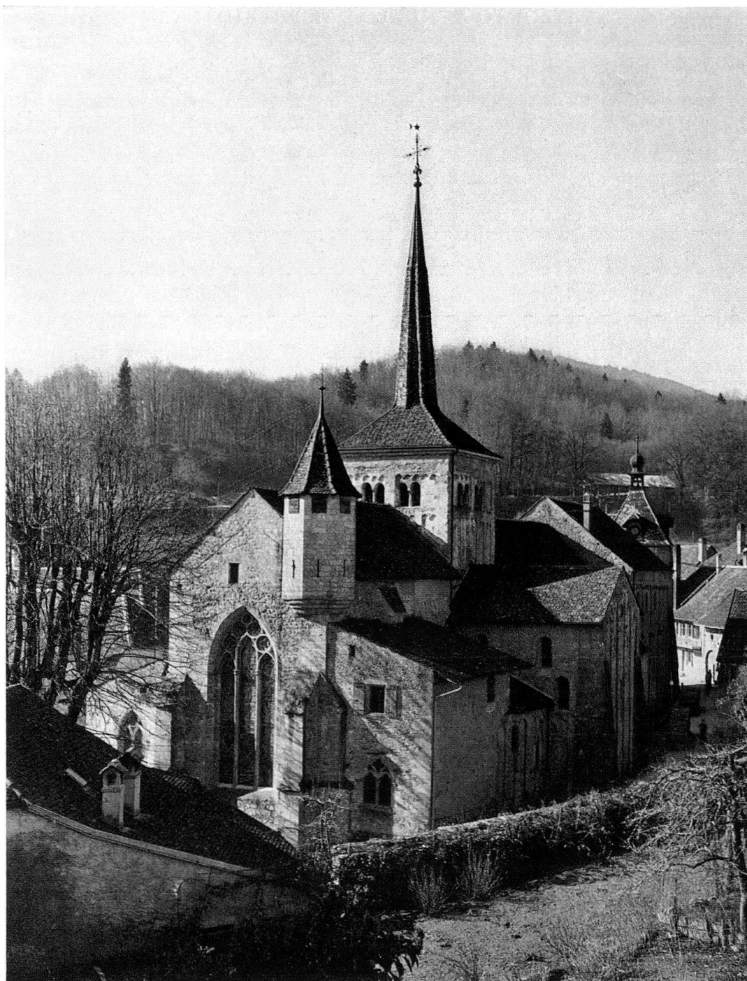
Romainmôtier, vue de l'extérieur

Château , ancien logis du prieur, important monument d'architecture profane des XIII e , XIV e et XV e siècles, qui, restauré avec soin, a retrouvé sa dignité primitive. Résidence baillivale bernoise de 1536 à 1798. A l'intérieur du corps principal, belle construction en bois et peintures murales des XIII e et XIV e siècles. Au rez, beau Salon décoré au début du XVII e siècle. A l'annexe construite sur le Nozon, vestiges de peintures murales du XV e siècle. (Pour l'église, voir Guide de Monuments suisses, série II, n o 13.)