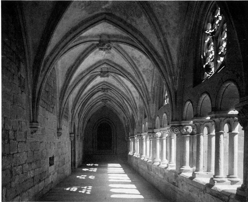
Hauterive. Cloître de l'abbaye, 1344-1370