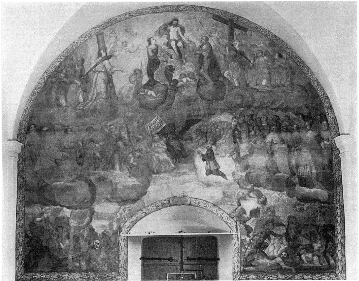
Lumbrein. Pfarrkirche St. Martin. Jüngstes Gericht

von großartiger Ausdruckskraft. Die Farbgebung beschränkt sich mit wenig Ausnahmen auf die bereits von Johann Rudolph Sturn gewählte Palette, der Bildrahmen in Form eines in grisaille gemalten Kranzgewindes bildet einen vorzüglichen Übergang. Über dem Scheitel der Türöffnung trägt eine hübsch gemalte Kartusche die berechtigt stolze Signatur des Misoxer Meisters: – EGO NIC. DE JULIANIS PICTOR MISAUCINAE ROVOREDO PINXI ANO 1694.