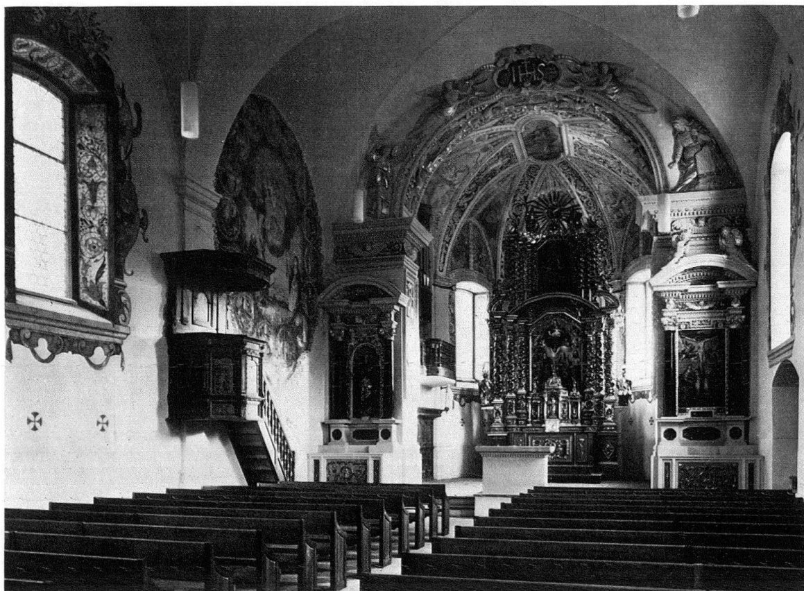
Lumbrein. Pfarrkirche St. Martin. Innenansicht gegen Chor

gens. In den Gewölbekappen konzertieren die Solisten eines himmlischen Orchesters, und in den Schildwänden thronen Kirchenlehrer und Evangelisten.