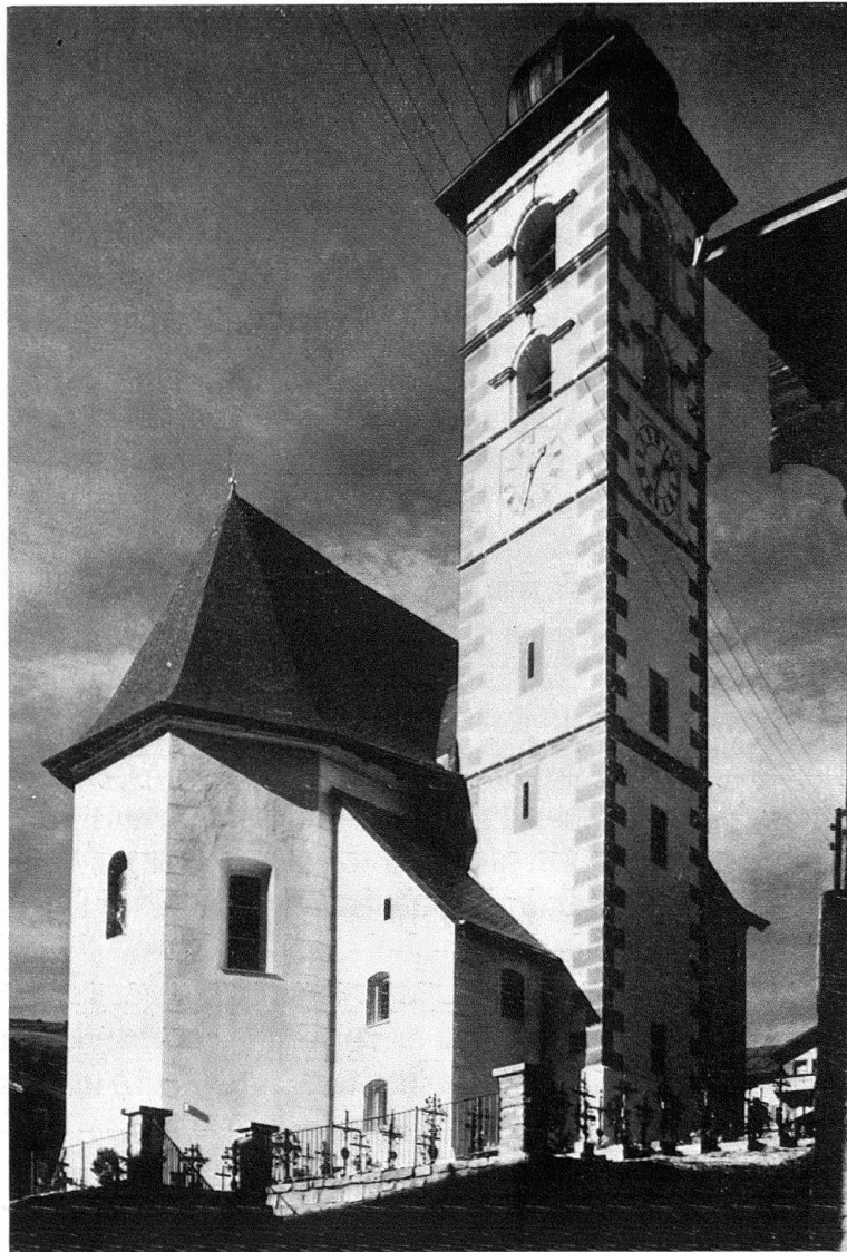
Lumbrin. Pfarrkirche St. Martin, Südost-Ecke

Diese einfache Überlegung wagte man anfänglich nicht laut zu äußern, denn die Preisgabe der Empore war mit einem erheblichen Platzverlust verbunden. Wo sollte die Orgel, wo die Sänger Platz finden und wo jene Kirchgänger, um derentwillen ja die Empore besser ausgebaut werden sollte? Ein ganz ungewohnter, schockierender Projekt-Vorschlag gab Antwort auf diese Fragen. Er sah den Ausbau einer Loggia im Chor über der Sakristei für die Orgel vor, die Plazierung der Sänger im Chor und schließlich den Verzicht auf Kniebänke, um mehr Sitzplätze im Schiff zu gewinnen. Der Vorschlag erforderte nur einen kleinen Eingriff in die bauliche Substanz, den Teilausbruch der ersten Chorjochwand und die Anlehnung des Sakristeidaches an den Chor statt an den Turm. Aber er verlangte von den Sängern eine ungewohnte Präsentation ihrer aktiven Anteilnahme, von der Jungmannschaft den Verlust eines traditionellen Vorrechtes und von der Gemeinde die Aufgabe einer althergebrachten Form des Gottesdienstes. Schritt um Schritt