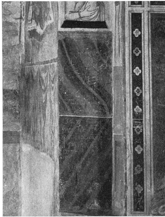
Chiesa Rossa di Castel San Pietro: Scritte sgraffiate nel campo inferiore del piedritto settentrionale dell'arco trionfale

primogeniti 14 . Tra i figli di Franchino II, c'erano, oltre a Lottario che gli succedette fino al 1419, un Giovanni e quattro figlie, una delle quali è chiamata Johannina nel testamento di Lottario (1419). A questo momento non è ancora sposata, ma riappare, sposata, nel 1440, con le tre sorelle, mentre sta facendo dono di una terra presso Como destinata alla fondazione di un convento 15 . Per delle ragioni di sesso, Giovanni non entra in linea di conto per il personaggio dell'affresco, così come è esclusa sua sorella, per ragioni di data. Resta comunque un leggero dubbio a proposito di quest'ultima, poichè non abbiamo nessuna prova dell'esistenza storica della donna che sarebbe la più vicina alla donatrice dipinta: la prima moglie di Franchino Rusca, una Giovanna di Zanardo Pusterla evocata da alcuni storiografi, ma non attestata in nessun documento 16 . Pur essendo un'ipotesi particolarmente seducente, essa deve essere avanzata con tutte le riserve del caso, visto che non poggia su nessuna certezza.