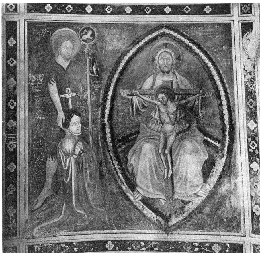
Affresco votivo della chiesa di San Pietro (Chiesa Rossa) a Castel San Pietro TI: Donatrice con il Battista e Dio Padre presentando il Cristo in croce (prima del restauro del 1946)

Ai giorni nostri, è oramai generalmente ammesso che il castello di San Pietro nella Pieve di Balerna, dopo essere stato per secoli possedimento episcopale, passò ai Rusca durante la seconda metà del XIV secolo 1 . Possiamo anzi pensare che la « rocha sci Petri » divenne la sede della famiglia, politicamente detronizzata a Como nel 1335; di qui la denominazione di Castel Ruscone con cui è designata negli atti di inizio '400 2 . La leggenda, forse in parte attendibile storicamente, il cui episodio centrale è il massacro di un centinaio di persone, la notte di Natale del 1390, massacro avvenuto nella chiesa di San Pietro, allora attigua al castello poi scomparso, nomina anch'essa quest'ultimo come residenza dei Rusca 3 . Infine, e questo ci interessa più da vicino, gli antichi storiografi di Como sostengono che Franchino II Rusca si rifugiò a Castel San Pietro (1403), dopo il fallimento, alla morte di Gian-Galeazzo Visconti, duca di Milano e sovrano di Como, di un tentativo di riconquistare la città 4 . È dunque probabile che il capo ghibellino abbia guidato un certo numero di spedizioni devastatrici nella regione, danneggiando i membri della fazione guelfa, cioè i Vitani 5 . Al contrario, non sembra che prima del 1402 Franchino, al servizio di Gian-Galeazzo, abbia soggiornato a Castel San Pietro, per quanto poco ci si possa fidare di storiografi così poco critici come Don Roberto Rusca, il cronista