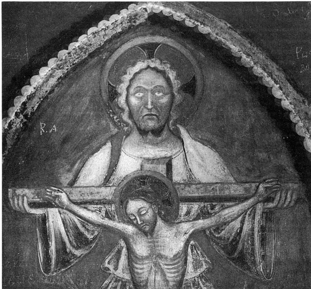
Particolare della pittura votiva di Castel San Pietro: Dio Padre presentando il Cristo in croce

Anche se è indiscutibile la particolare delicatezza dei tratti e dei colori, questo viso presenta pur sempre le caratteristiche comuni a numerose figure femminili della pittura e della miniatura lombarda della fine del XIV secolo e inizio del XV. Ma soprattutto il