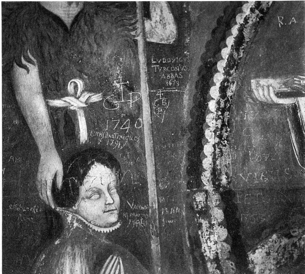
Particolare della pittura votiva di Castel San Pietro: Testa della donatrice con il Battista

vestito, con il suo collo alto, e la pettinatura impongono diversi confronti che si estendono dal 1390 al 1410 circa 11 . Secondo noi, i paragoni interessanti finiscono per essere due: una santa Dorotea di un Libro delle Ore 12 – non senza rapporti con la maniera di Franco e Filippolo de Veris , che operarono nel 1400 a Sta Maria dei Ghirli a Campione –, e una santa martire dipinta su una crociera della volta di Sta Maria in Selva a Locarno – pure del 1400, che ricorda le illustrazioni del Taccuinum sanitatis , vicine a Giovannino dei Grassi 13 . Insomma, se l'affresco votivo di Castel San Pietro non può essere anteriore al 1390, è difficilmente immaginabile posteriore al 1410, malgrado il ritardo, che non bisogna mai dimenticare, di un affermato provincialismo, e presenta le maggiori affinità con opere abbastanza precisamente datate attorno al 1400.