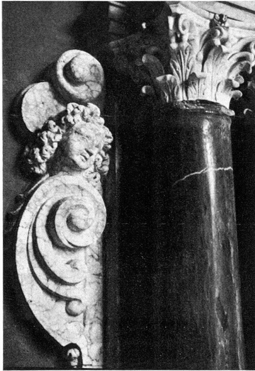
Abb. 2. Schinznach. Detail des Obergeschosses des Grabmals Johann Ludwig von Erlach aus dem braunstreifigen Alabaster wie bei Abb. 4