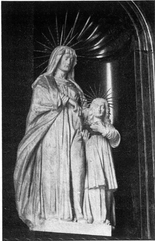
Abb. 4. Schinznach. Bildwerk (Anna und Maria) eines Seitenaltars der Pfarrkirche Stans aus braunstreifigem Alabaster vom Stanserhorn

Grabmals von Schinznach, das heißt vom Stanserhorn. Offensichtlich bezog sich die Bestellung (wohl von 1650) nur auf den für das Grabmal des Generals notwendigen Stein, der dann noch für einige Teile desjenigen der Frau Margareta ausreichte. Möglicherweise brachen die Beziehungen mit der Inner- schweiz auch wegen der politischen Ereignisse der 1650er Jahre ab. Man wurde auf den noch fast schöneren (weißeren) Alabaster der nur 6 km entfernten Staffelegg aufmerksam und brachte damit die Arbeiten zum Abschluß. Die nur untergeordnet verwendete graue Alabastervarietät läßt sich aus der Entfernung zu wenig studieren, um etwas über die Herkunft auszusagen.