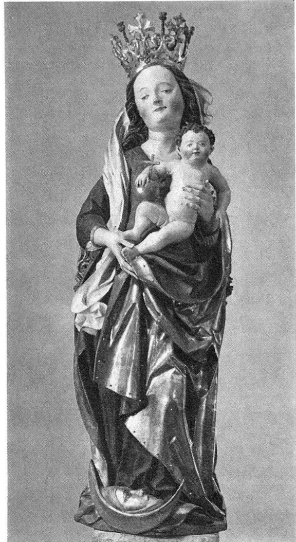
Abb. 4. Die bereits fertig restaurierte Marienfigur

übertreffen. In solchen Fällen wird die Entscheidung, welche Schicht zu opfern und welche freizulegen ist, zum Dilemma, vor allem, wenn das Original nur sehr reduziert erhalten ist. Im Falle der Fassung Ivo Strigels aber bestand keine Alternative zur ursprünglichen Bemalung: der Altersabstand der Nachfassungen beträgt gegenüber dem Original mehrere hundert Jahre, und die Qualität der gotischen Polychromie erhebt sich weit über die spätzeitliche Übermalung. Der Aufwand, den es zu ihrer Freilegung bedarf, ist freilich außerordentlich. Nur ein Lehratelier mit einem Team von geschulten Fachkräften und sorgfältig geführten und minutiös arbeitenden Restaurierschülern vermag eine derartige Arbeit zurzeit zu bewältigen, ohne daß die Kosten allzu hoch würden.