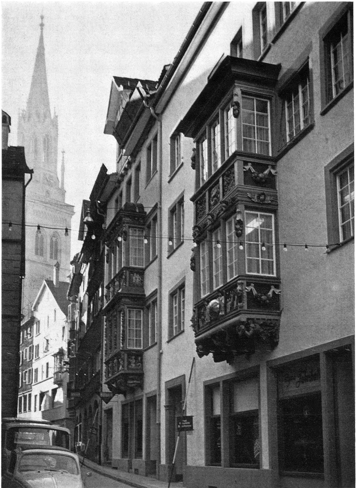
Abb. 1. St. Gallen, Kugelgasse mit den Häusern «Zur Kugel» (rechts) und «Zum Schwanen» (Mitte), im Hintergrund der neugotische Turm der Kirche St. Laurenzen