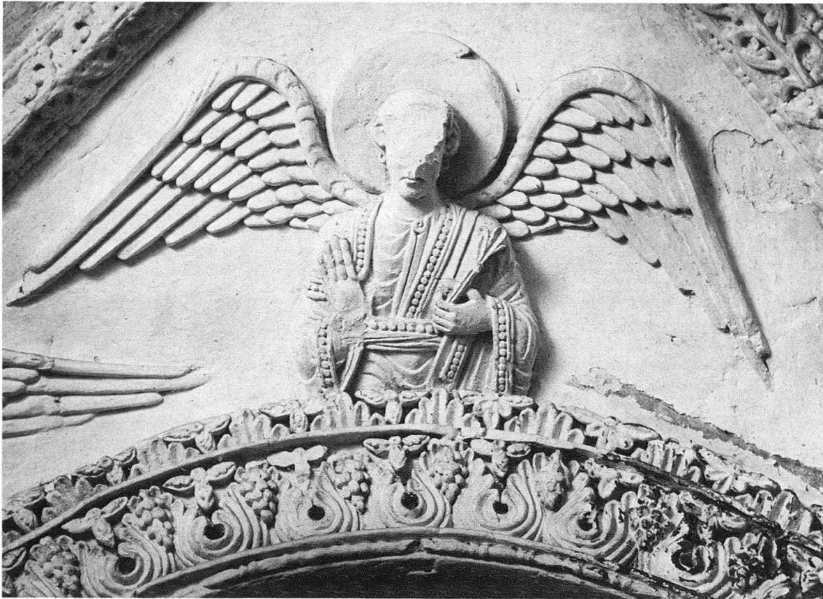
Abb. 2. Müstair. Stuckrelief am Gewölbe der Ulrichskapelle. Romanisch

men gesehen werden, namentlich mit Hocheppan und Mariaberg, die zur gleichen Gruppe gehören. Sie dürften um 1165/1180 entstanden sein (Otto Demus).