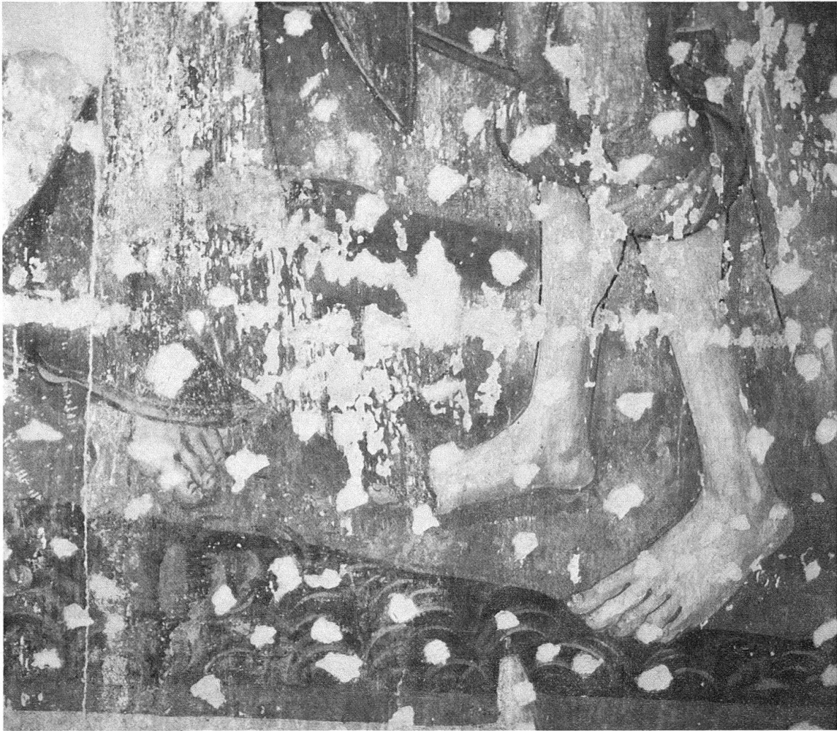
Abb. 2. Detailaufnahme (Füsse des Christophorus) vor der Retuschierung. Pickelhiebe zugekittet

Freiraum, sondern nur für die genau erfassbare Tiefe, die eine menschliche Figur für ihre Existenz braucht. Der Hintergrund ist auch beim Churer Bild – soweit der Erhaltungszustand es erkennen lässt – von der nach vorne abfallenden Standfläche der Figuren streng geschieden. Zu vergleichen wären in diesem Zusammenhang auch die Holbeinischen Wandbilder in der St.-Peters-Kirche in Lindau.