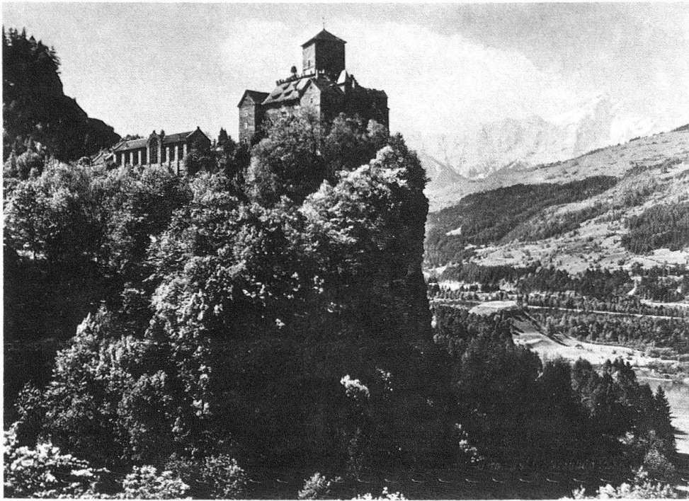
Abb. 1. Schloss Ortenstein im Domleschg, Kanton Graubünden. Ansicht von Norden