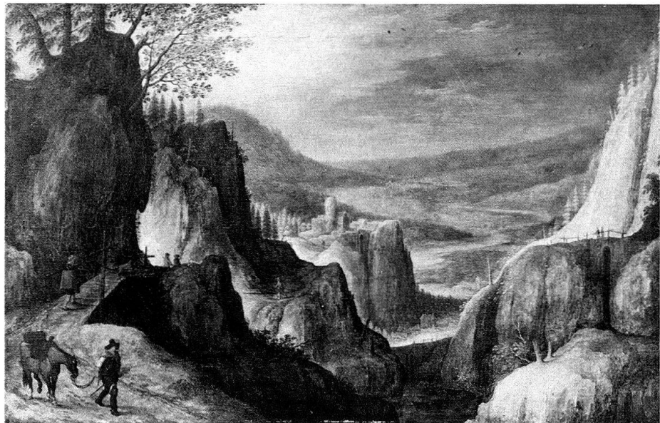
Abb. 4. Tobias Verhaecht (Antwerpen 1561–1631): Phantastische Gebirgslandschaft. Öl auf Eichenholz, 41,5 × 65,5 cm. Inv. Nr. G 1971.2. Öffentliche Kunstsammlung Basel, Ankauf mit einem Beitrag von Peter de Boer, Hergiswil