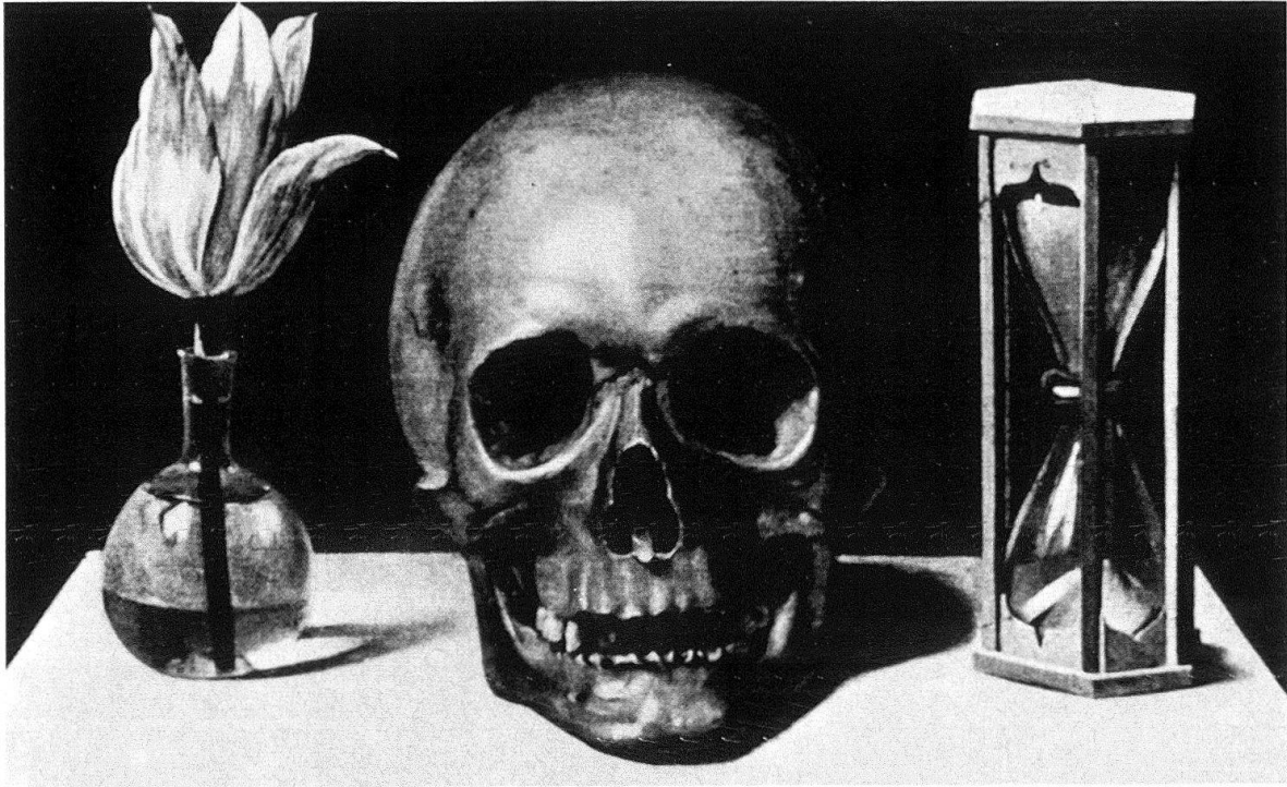
Abb. 3. Umkreis des Philippe de Champaigne, Vanitasdarstellung, Öl auf Holz, 28,5 × 37,5 cm. Le Mans, Musée des Beaux-Arts

frühen Stilleben Kauws einen Hinweis auf seine künstlerische Herkunft suchen, die ja völlig im dunkeln liegt. Das Bild weist am ehesten auf Frankreich hin. Nicht unbegreiflich, da ja Strassburg, wo Kauw bis 1640 lebte, obwohl zu Deutschland gehörig, künstlerisch ebenso sehr auf Frankreich als auf Deutschland ausgerichtet war 16 . In einem Kupferstich von Nicolas de Platte-Montagne nach Philippe de Champaigne (Abb. 2) und in einem Bild, das man Champaignes Umkreis zuschreibt (Le Mans, Musée des Beaux-Arts) (Abb. 3), beide undatiert, sieht man die Austauschbarkeit der Symbole Rose und Tulpe. Die Komposition ist beide Male sehr einfach: zentral ein Totenkopf, links davon eine Blume (eine knospende, blühende und welkende Rose bzw. eine Tulpe), rechts davon eine Uhr (Taschenuhr bzw. Sanduhr). Ein anderes, ebenfalls undatiertes Bild, das man dem Umkreis von Georges de la Tour zuschreiben muss (Paris, Louvre), zeigt in einem Vanitasstilleben, durch Bücher etwas verstellt, ein Gefäß mit mehreren Tulpen (Abb. 4). Wir werden auf dieses Bild bei dem Spiegelmotiv zurückkommen.