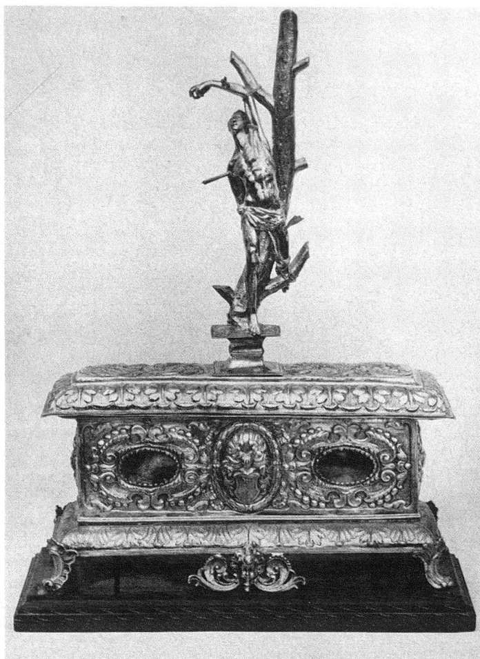
Fig. 3. Johann Nüwenmeister, Reliquaire de saint Sébastien, Collégiale de Saint-Nicolas de Fribourg, 1648

en forme de rosette (par exemple à la fixation de la gloire derrière la Vierge) ou le prolongement du pied du crucifix à croix tréflée ainsi fixé au couronnement.