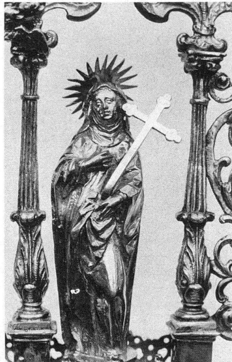
Fig. 2. Johann Nüwenmeister, Ostensor de l'église de Notre-Dame, Fribourg (détail: personnage de droite)