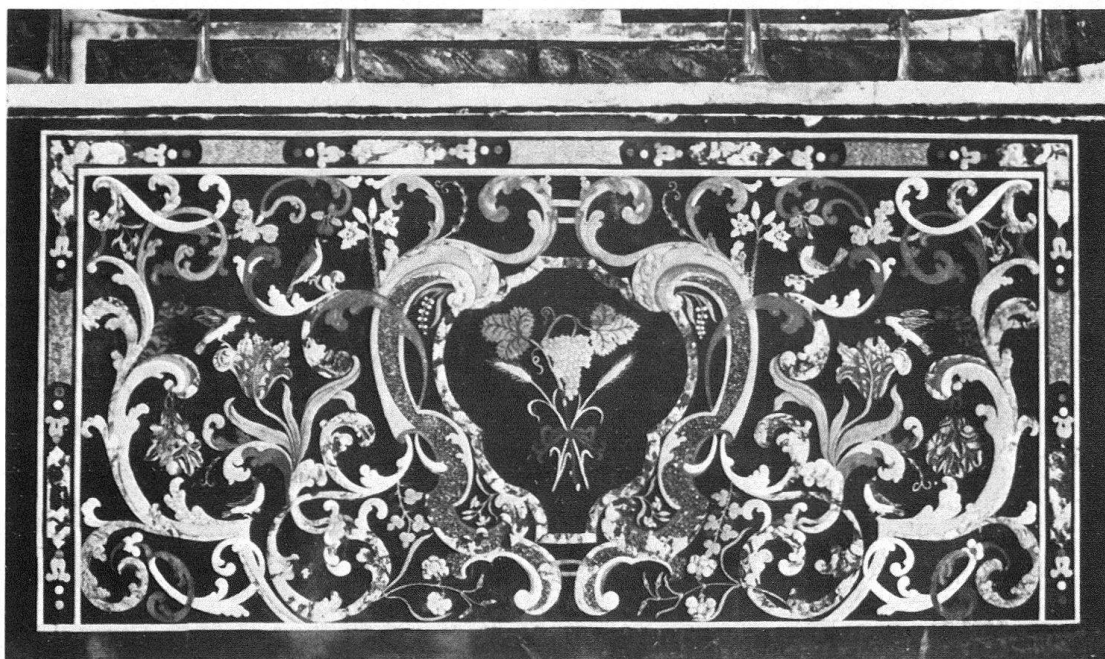
Ill. 2. Montecarasso, Chiesa della Trinità. Paliotto a lastra unica, firmato da Giuseppe Maria Pancaldi

La struttura decorativa è piuttosto semplice e comprende una cornice generale più o meno larga a motivi geometrici (tranne per uno dei tipi di paliotti a tre specchi citato sopra), un motivo centrale e un motivo decorativo che si sviluppa specialmente ai due lati.