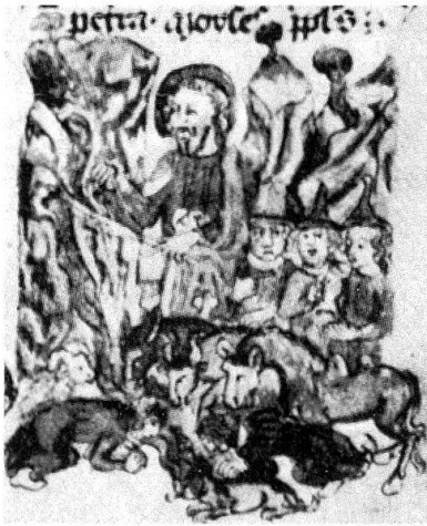
6. Quellwunder von der Armenbibel in Kremsmünster