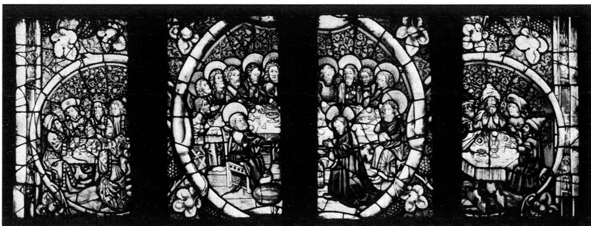
5. Gastmahl des Ahasver mit Esther, Fusswaschung und Passahmahl vom Berner Bibelfenster

Die Programme der beiden Scheiben sind somit zur gleichen Zeit, vom gleichen geistlichen Berater aufgestellt und an verschiedene Künstler vergeben worden; ja, wir können selbst die Herkunft dieses zweiten Malers nachweisen. In der Armenbibel fehlt zumeist die Figur Gottvaters über der Mannawolke. Unser Glasmaler musste sie also anderswo suchen und hat sie nun in einem nur wenige Jahre älteren Werk gefunden, im Basler Antoniusaltar von 1445 (Abb. 4). Dort sind die nämlichen Engel zu sehen, und hängt der Mantelzipfel Gottvaters in genau der gleichen Weise hinter der Wolke herunter. War jener Meister an burgundischer Hofkunst geschult – er umgibt den himmlischen Herrscher mit einem «Gefolge» von sechs Engeln und setzt ihm die perlbesetzte Tiara auf – so hat unser Glasmaler diese Szene in den bürgerlichen Berner Stil zurück