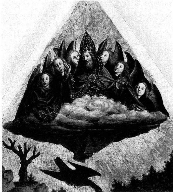
4. Gottvater über der Wolke vom Basler Antoniusaltar von 1445

sie schon die von CORNELL erwähnte Mettener Bibel von 1414 zeigt; Kirchenväter teilen das himmlische Brot dem Volke aus. « Verbum caro factum est » – Gottes Wort ist Fleisch geworden, so wird das dreifache Symbol der Evangelienmühle, des Christuskinde und der englischen Botschaft mit der Taube des Heiligen Geistes gedeutet. Nur hier, an der theologisch wichtigsten Stelle des gesamten Münsterzyklus, erläutern mehrere Bibelverse den Gehalt des Werks. Der Künstler hat diese Texte gelegentlich verwechselt, folgt also fremden, nicht ganz verstandenen Weisungen.