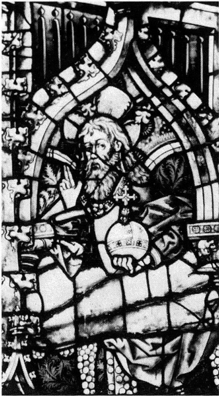
3. Gottvater über der Mannawolke vom Hostienmühlfenster