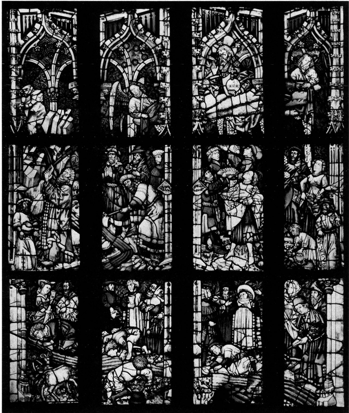
2. Quellwunder und Mannaregen vom Berner Hostienmühlfenster