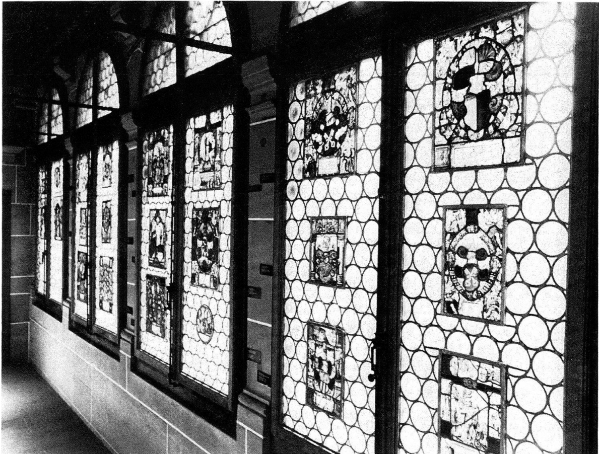
Abb. 1. Freiburg, Museum für Kunst und Geschichte: Freiburger Wappenscheiben in der unteren Galerie.

Nach dem Eintritt Freiburgs in den Bund der Eidgenossen 1481 näherte sich die Stadt an der Saane ihrer grössern Schwester an der Aare politisch an. 1536 wurde der alte Traum einer Gebietserweiterung nach Westen auf Kosten Savoyens trotz religiösen Spannungen gemeinsam mit Bern in die Tat umgesetzt. Die Eroberung der Waadt bescherte Freiburg grosse Gebietsgewinne im Raum von Saane und Broye, die sich noch heute als bizarre Ausläufer oder Exklaven im Kanton Waadt ablesen lassen. Das