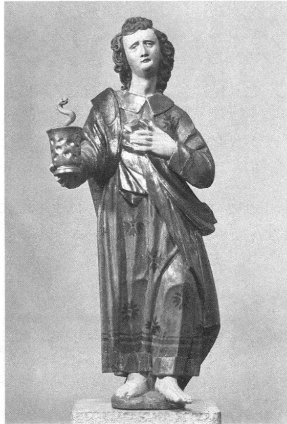
Mülinen bei Tuggen. Abb. 6: Hl. Michael (links); Abb. 7 (rechts): Johannes Evangelista

auf einen rosa/hellroten Grund gemalt 9 . Das Kleid ist versilbert, dünne grüne Linien vermitteln zu den breiten Goldbordüren.