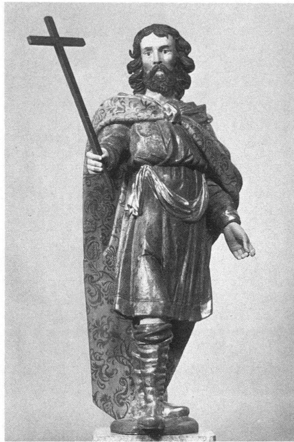
Mülinen bei Tuggen. Frühbarockes Holzretabel, letztes Viertel 17. Jh. Abb. 1 (links): Johannes Evangelista; Abb. 2 (rechts): Philippus (?)

Sie weisen ausgesprochene Ähnlichkeit auf mit dem Altar für die Liebfrauenkapelle Rapperswil von Johann Bapt. Breny 7 . Demnach darf wohl auch für die uns hier interessierenden Skulpturen eine Rapperswiler Werkstatt im letzten Viertel des 17. Jahrhunderts angenommen werden.