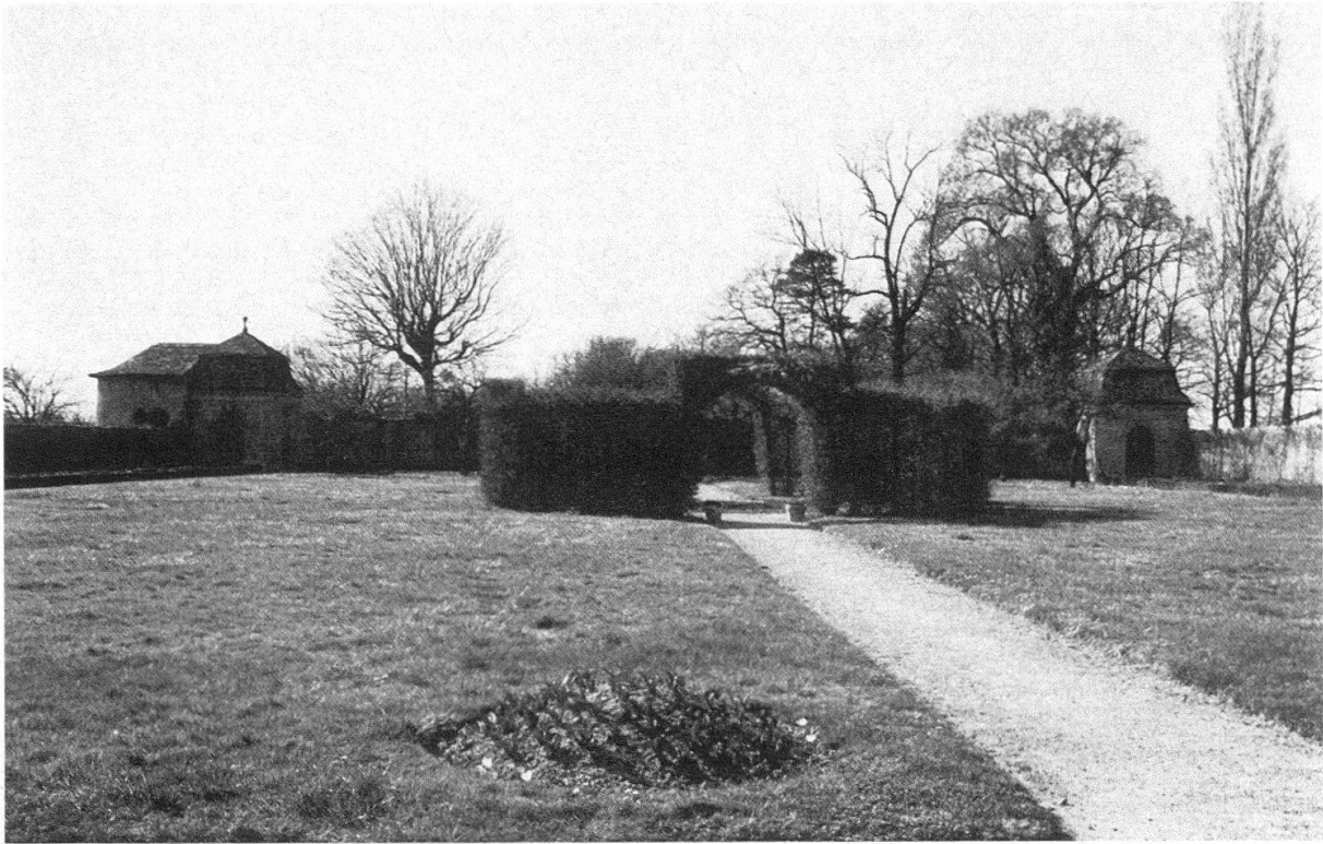
Pavillons et jardin de Merlinge

relief des statues concentrées autour de la maison et la ferronnerie car il est évident qu'en noir et blanc, la fermeté du dessin reste toute relative.