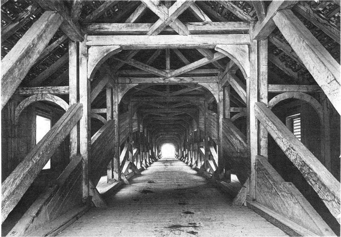
Abb. 2. In der Dokumentation des Holzbrückeninventars finden sich auch Photographien nicht mehr bestehender Brücken. Dem Glücksfall, dass der gesamte Glasnegativ-Bestand der Gebrüder Wehrli Zürich (Photoglob) vor kurzem in den Besitz des Archivs der Eidgenössischen Kommission für Denkmalpflege übergegangen ist, verdanken wir dieses aussergewöhnliche Lichtbild der Eglisauer Rheinbrücke. Die 1811 vom Zürcher Staatsbaumeister Conrad Stadler und dessen Sohn, Hans Caspar Stadler, erstellte Bogenbrücke überspannte den Rhein in zwei Öffnungen. Die Erhöhung des Rheinwasserspiegels durch den Bau eines Kraftwerkes im Jahre 1917 machte den Abbruch erforderlich

ventar-Band Kanton Appenzell Ausserrhoden von Eugen Steinmann, dessen Bezirk Hinterland in den direkten Wirkungsbereich der Grubenmann greift 2 .