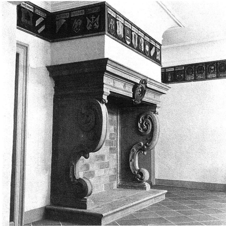
Wangen a. d. A. Bergfried des Amtshauses. Der Sandsteinkamin von 1668 und der Wappenfries der 80 Landvögte und vier Amtmänner von 1406–1831; 1664 von Albert Kauw neu gemalt und später fortgesetzt durch verschiedenste Künstler