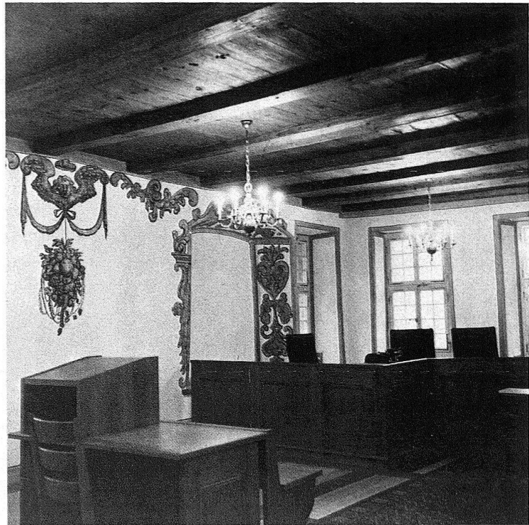
Wangen a. d. A. Amtshaus. Der Amtsgerichtssaal im 1. Stock des Nordtraktes; barocke Grisaillemalerei von 1660/1670

tungen instand gestellt worden. Das erfreuliche Resultat verdanken wir der bei solchen anspruchsvollen Restaurierungen unerlässlichen geistigen Beweglichkeit und dem Willen, die Pläne immer wieder den neuen Situationen anzupassen.