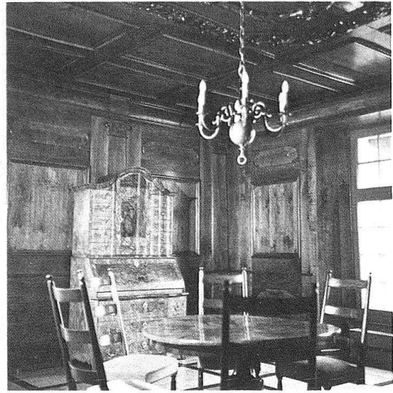
Wangen a. d. A. Osttrakt des Amtshauses. Täferzimmer, 1684 im Auftrag von Beat Fischer eingebaut von Ludwig Fisch

Im Nordtrakt hat es sich gezeigt, dass dort ursprünglich im 1. Stock ein grosser Saal bestand. Reste eines auf die Wand gemalten Wappenfrieses der Landvögte dürften in Zusammenhang gebracht werden mit dem Auftrag, den Hans Ganttin (wohl Hans Ganting d.J., geb. 1586) 1617 erhielt. Um 1660/1670 bekam der Raum eine neue Barockausmalung in Grisaille mit Gehängen und Rollwerkornamenten. Die Fenster hatten noch die nachgotischen Formen, wie zwei freigelegte Fensternischen belegen. Die originale Holzbalkendecke war tadellos erhalten. So konnte der Raum in alter Form zum Amtsgerichts-Saal werden. Unter Beat Fischer, Landvogt von 1750 bis 1756, dem gleichnamigen Enkel des oben Genannten, war der Saal unterteilt worden und erhielt neue Fenster in Hochrechteckform. Der ganze Nordtrakt und das übrige Schloss wurden 1751/52 neu verputzt und rot bemalt. Die originelle Scheinmalerei ist unter Leitung von Restaurator Hans A. Fischer wiederhergestellt worden. Wo es das Innere nicht erlaubte, Fenster auszubrechen, wurden solche, teils mit geschlossenen oder schräggestellten Fensterladen kurzerhand auf die Fassade gemalt. Diese im Bernbiet seltene Fassadenbemalung muss zusammen mit der illusionistischen Fassadenmalerei am Hofgut in Gümligen bei Bern gesehen werden, die derselbe Beat Fischer dort 1744 ausführen liess. In den Amtsrechnungen sind Zahlungen an die Maler Glutz und Byss aus Solothurn erwähnt, ohne dass genau gesagt wird, welche Arbeiten sie ausführten.