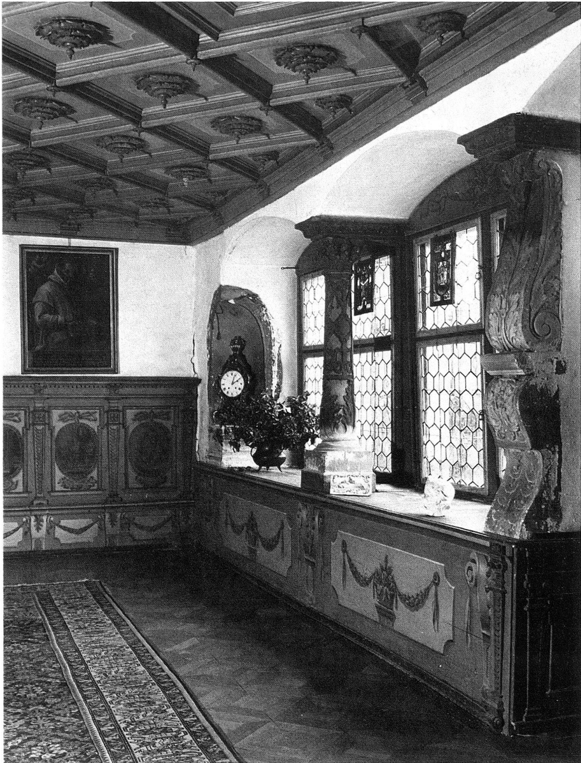
Kartause Ittingen TG. Blick ins reich ausgestattete Refektorium

der kunstgeschichtlichen Wahrheit, in den handwerklich-technologischen Möglichkeiten ist die Denkmalpflege gerade in den letzten Jahren ein beträchtliches Stück vorangekommen. Kunst- und Baudenkmäler ungeschmälert zu erhalten, zu unterhalten und mit neuem Leben zu erfüllen, stösst zudem allüberall auf wachsendes Verständnis.