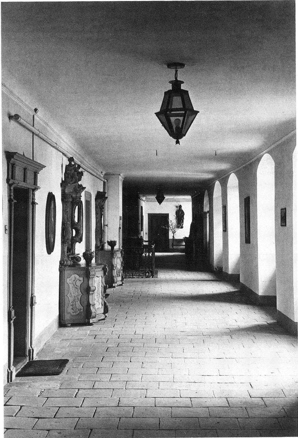
Kartause Ittingen TG. Blick in den Südflügel der Klosteranlage