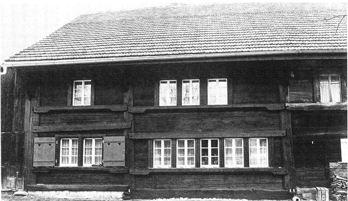
Ein Beispiel für die zahlreichen restaurierten Bauernhäuser: der Wurmsbacherhof in Wagen, Gemeinde Jona. Ein Ständer-Bohlenbau aus der ersten Hälfte des 17. Jh. vor und nach der Wiederherstellung

schlossen! Es bedurfte eines zähen Ringens, bis auch dieses Problem gelöst war. Erfreulicherweise ist heute die statische Sicherung durchgeführt und damit der Weiterbestand des Objekts gewährleistet.