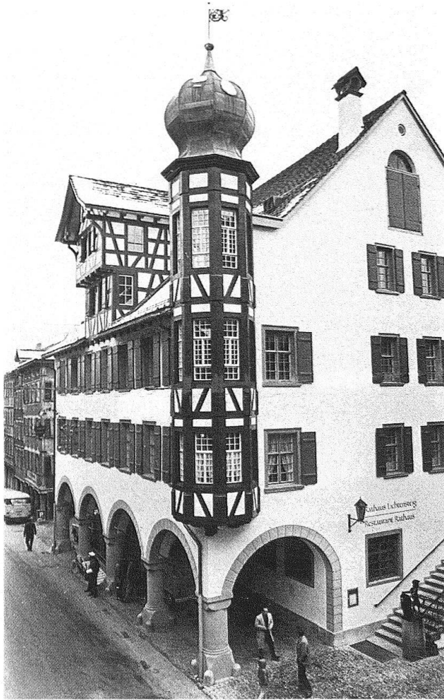
Das Rathaus in Lichtensteig, 1977 in alter Pracht wiedererstanden

schaffung. An Sakralgebäuden wurden fertiggestellt oder standen in Arbeit: die Pfarrkirchen in Oberriet, Thal, St. Gallenkappel und Flums. Die alte evangelische Kirche von Kappel sowie die Klosterkirche Glattburg in Oberbüren und die Kapellen Oberrindal, St. Margrethenberg bei Pfäfers, St. Wolfgang in St. Gallen und St. Georg ob Berschis.