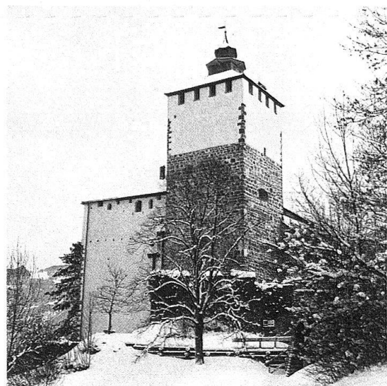
Die trutzige Nordwestseite des Schlosses Werdenberg vor und nach der Restauration im Sommer 1977