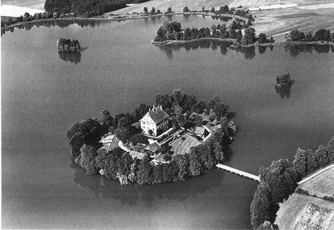
Mauensee. Comet-Flugaufnahme des Schlosses von NW

mus, wie das Casino der Herren zu Schützen (1807/08), das Waisenhaus (1808–1811) und der Herrensitz Grundhof (1818–1821). Ihnen folgen im sakralen Bereich die Senti-Kirche (1817–1819) und die Pfarrkirche von Knutwil (1821–1826). Ihre Fortsetzung findet die klassizistische Richtung in der strenger formulierten Biedermeierarchitektur des Grossratsgebäudes von Melchior Berri (1841–1843), der ehemaligen Kantonsbibliothek (1846–1849) und im Hotel Schweizerhof (1845), das den Auftakt zu der das Stadtbild stark mitbestimmenden Hotelarchitektur bildet. Besonders die Seefront Richtung Meggen mit der vorgelagerten Quaianlage veranschaulicht diesen Aufbruch in das Zeitalter des Tourismus deutlich. Ab 1868 entstehen in mehreren Etappen bis 1899 das Hotel National und 1904–1906 das Hotel Palace. Sozusagen kontrapunktisch dazwischengesetzt, ergänzen Kursaal (1882) und Verwaltungsgebäude der Gotthardbahn (1887/88) dieses heute bedrohte Gesamtkunstwerk. Mit der Hauptpost (1886/87) und dem 1971 durch ein Grossfeuer weitgehend zerstörten Bahnhof (1894–1896) manifestiert sich der junge Bundesstaat architektonisch. Ganze neue Quartiere in historisierenden bis Jugendstilformen werden infolge des starken Bevölkerungswachstums der zweiten Jahrhunderthälfte angelegt. Über die nächste Umgebung breitet sich die Villenarchitektur mit ihren ebenso romantischen wie phantasievollen Schöpfungen aus.