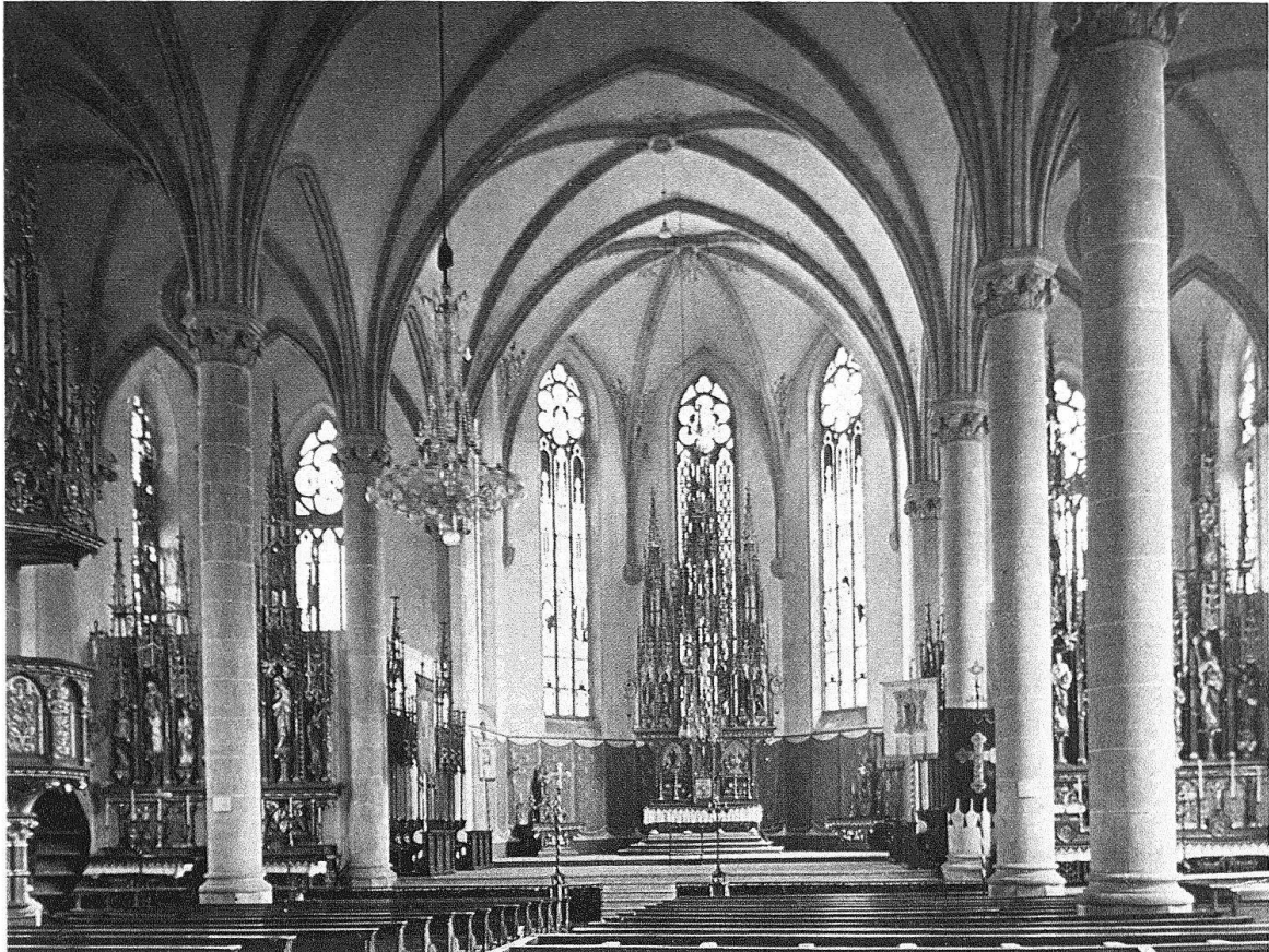
Escholzmatt. Pfarrkirche St. Jakob. Neubau 1892–1894 von August Hardegger

In der damals noch unverbauten Umgebung entsteht um 1750 eine stattliche Reihe von Sommerresidenzen, so die Landsitze Dorenbach, Oberlochhof und Geissenstein. Wie Schloss Tannenfels bei Nottwil (1688) und das Landvogteischloss in Willisau (1690–1695) bewahren die walmdachbekrönten, rechteckigen Baukörper äusserliche Schlichtheit, die die Pracht ihrer bemalten Täfersalons im Innern kaum erahnen lässt. Reicher gegliedert dagegen sind die Anlagen von Schloss Steinhof mit seinen vier Ecktürmen (1759) und des «Himmelrich» an der Obergrundstrasse mit Observatoriumstürmchen und vorgelagerten Pavillonbauten. Als barocke Palais entstehen die Pfarrhäuser von Zell (1683) und Pfaffnau (1764/65) sowie Propstei und Kustorei in Beromünster (1783/84). Weltliche Gesinnung spricht auch aus den Festsälen im Pfarrhaus von Ruswil (1654), im Kloster St. Urban (1721–1728), in der 1744 von Giovanni Gaspare Bagnato neuerbauten Kommende Hitzkirch und im Murihof in Sursee (1780–1795).