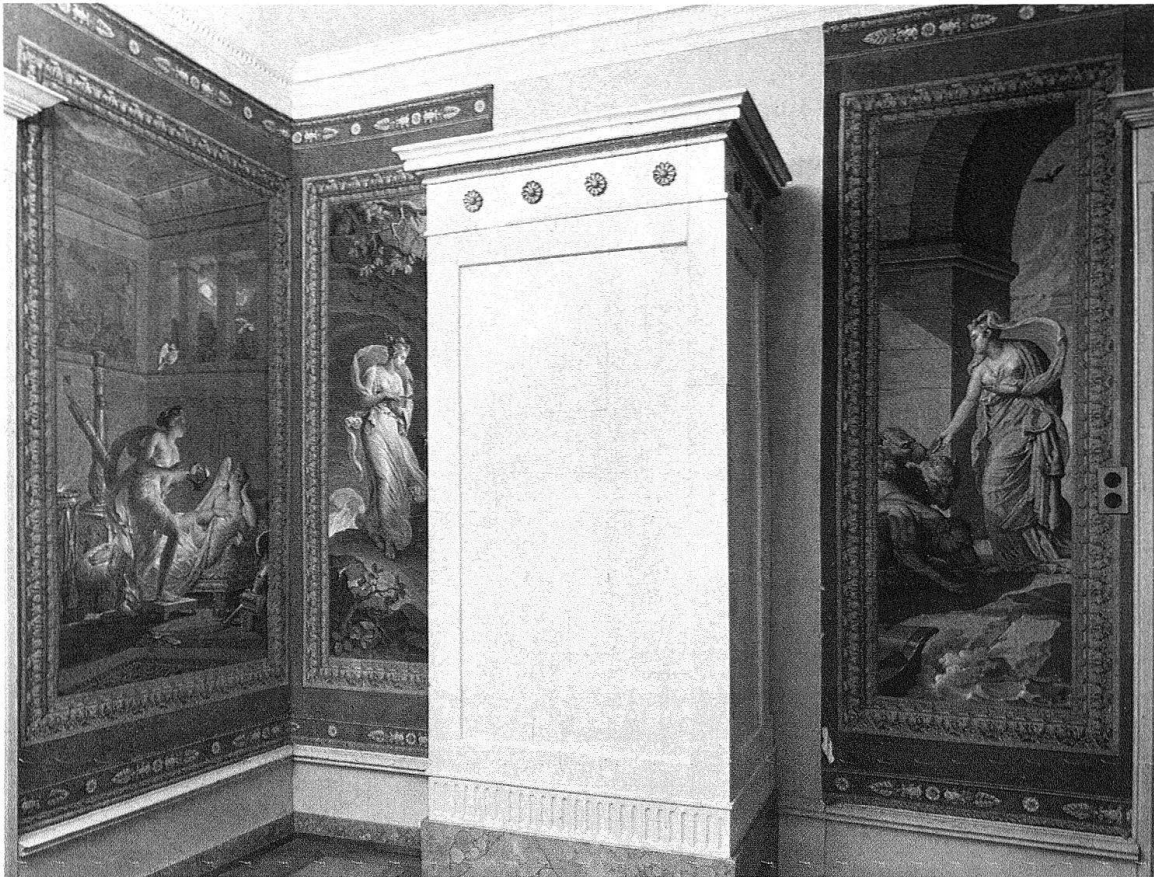
Luzern. Herrensitz Grundhof. Klassizistische Bildtapete in Grisaille «Amor und Psyche»

Aus dem Tirol und aus Vorarlberg stammen die Baumeisterfamilien Singer und Purtschert, die im Kanton Luzern zahlreiche Pfarrkirchen erbaut und dafür ein auch von anderen Architekten übernommenes Bauschema entwickelt haben. Charakteristisch für dieses sogenannte Singer-Purtschert-Schema sind grosse einschiffige Hallenkirchen mit doppelgeschossiger Empore und Nordturm. Die Verbindung zum schmälere Chor erfolgt durch elegante, schräge oder nischenförmige Überleitungen, die die beiden Raumteile optisch miteinander verschmelzen, so in den Pfarrkirchen von Luthern (1751/52), Ettiswil (1769–1774), Ruswil (1782–1789), Eich (1807/08) und zum letztenmal in Rain (1853/54).