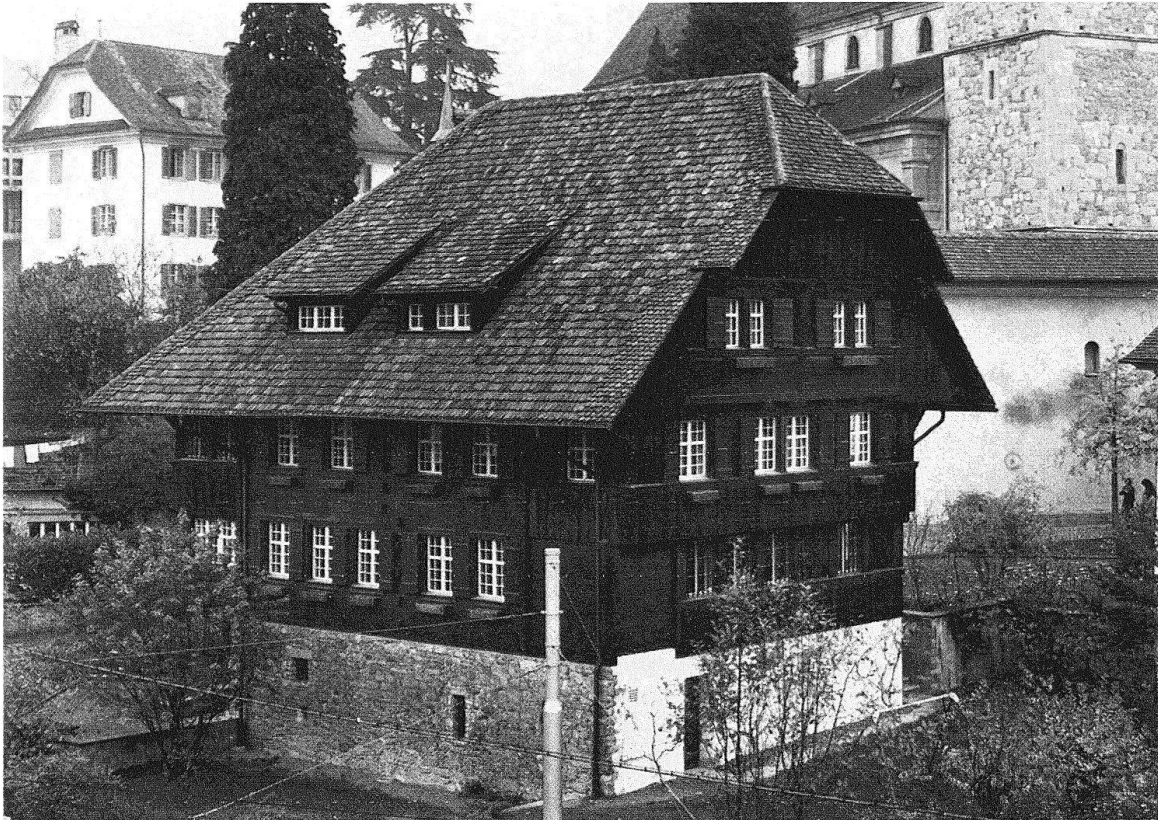
Luzern. Stiftsbezirk, Pfund- oder sogenanntes Rothenburgerhaus, das älteste als Ganzes erhaltene bürgerliche Holzhaus der Schweiz, um 1500

Kirche des ehemaligen Klosters der Franziskaner, die sich die Betreuung des städtischen Proletariats zur Aufgabe gemacht hatten.