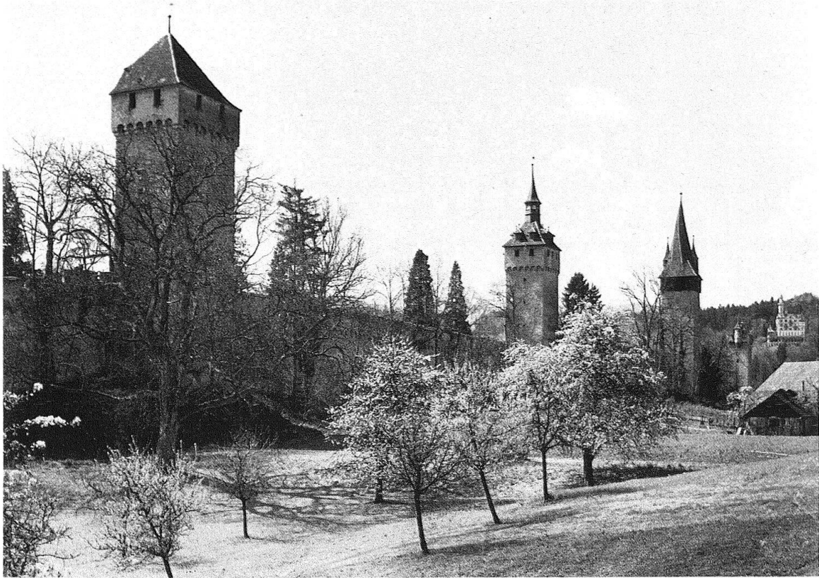
Luzern. Blick auf den äusseren nördlichen Befestigungsgürtel, die Museggmauer mit dem Zeitturm, dem Wachturm und Luogisland (Aussenansicht)

des 19. Jahrhunderts zu meist lockeren Strassendörfern heranwachsen. Die vorherrschende Blockbauweise ist als Holzkonstruktion witterungsanfällig und brandgefährdet, weshalb ländliche Bauten selten weiter zurückreichen als ins 18. Jahrhundert. Auch die sakrale Bausubstanz wurde im bau- und repräsentationsfreudigen Barockzeitalter grösstenteils ausgewechselt, so dass der Kanton Luzern heute recht eigentlich von dieser Stilepoche, die noch weit in das 19. Jahrhundert wirksam bleibt, geprägt erscheint.