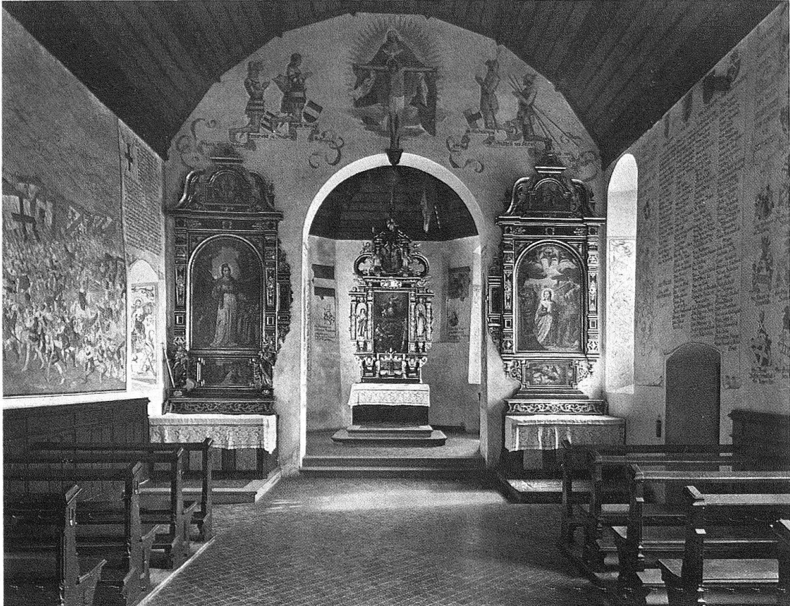
Sempach. Schlachtkapelle St. Jakob, 1387 geweiht. Reiche Ausstattung: Hochaltar dat. 1641, Seitenaltäre Ende 16. Jh., Malereien und Namen der Krieger der Schlacht von Sempach 1386