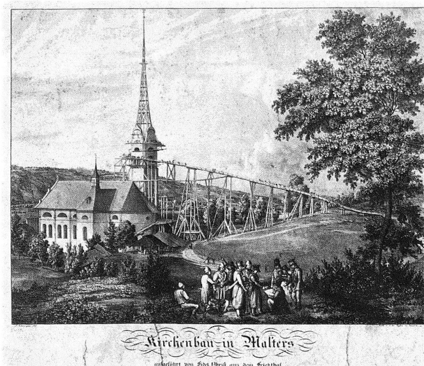
Malters. Kirchenbau von 1833–1835 mit eindrucklicher Gerüstbrücke für den Turmbau (seltene Darstellung). Zeichnung von J. Schwegler, Lithographie von den Gebr. Eglin in Luzern.

«Veraltet» wirken zu dieser Zeit auch die Anlage des Treppenhauses in einem separaten, aus der Fassade vorspringenden Turm und die Zweiteilung der Fenster im obersten Geschoss durch Steinsäulen. In der reizvollen Gesamtwirkung dieser gekonnten Synthese von an sich konträren Grundgedanken zeigt sich das hohe Mass künstlerischen Vermögens des Baumeisters.