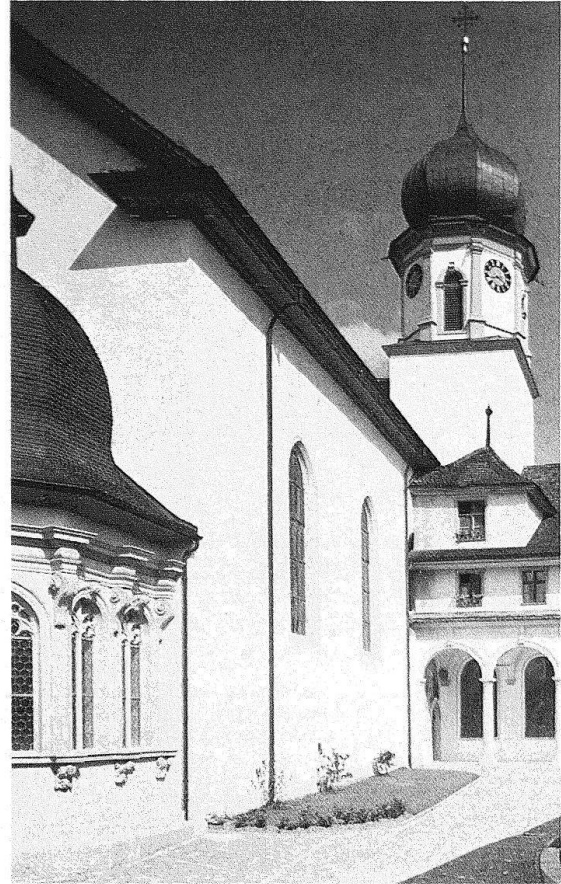
Werthenstein. Wallfahrtskirche und ehem. Franziskanerkloster. Blick auf die Eingangspartie

tur. Besonders schön ist hier das Nebeneinander von italianisierendem Stuck (1703–1708 in Vorhalle und Nebenkapellen) und solchem süddeutscher Prägung (1751/52 in Schiff und Chor) zu beobachten. Als reiner Zentralbau wurde 1669 die Wallfahrtskapelle St. Ottilien bei Buttisholz konzipiert. Das eigenwilligste unter den Luzerner Wallfahrtsheiligtümern ist die 1651–1662 entstandene Kirche Maria Loreto in Hergiswald, mit ihrer ins Kircheninnere gestellten Kleinarchitektur. Qualitätvolle Wandmalereien aus der Zeit kurz vor 1600 bereichern den 1753 einheitlich neugestalteten Innenraum der in aussichtsreicher Lage am rechten Talhang stehenden Wallfahrtskirche Heiligkreuz im Entlebuch.