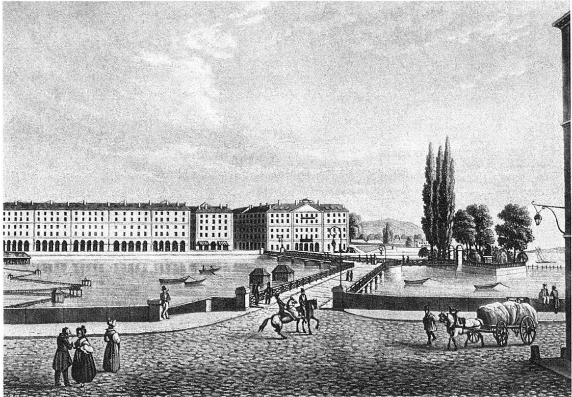
Fig. 1. Genève. Les maisons du quai des Bergues et l'hôtel d'après une gravure faite peu après leur achèvement (1834). Au premier plan, le Grand Quai et le pont des Bergues; à droite, l'île Rousseau