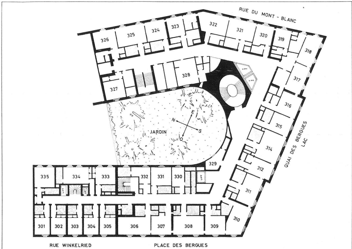
Fig. 3. Genève. Plan schématique actuel de l'Hôtel des Bergues (3 e étage)