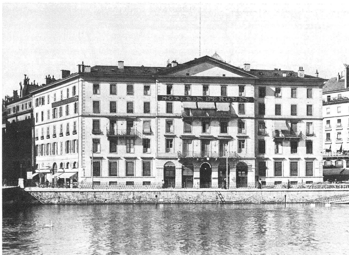
Fig. 5. Genève. L'Hôtel des Bergues sous son ancien aspect d'après une photographie de la fin du XIX e siècle

Depuis les travaux de 1917 le bâtiment se présente sous un aspect tout autre (fig. 6). A la sobriété a fait place l'emphase. L'hôtel a été surélevé d'un étage entier en forme d'attique; la toiture refaite a pris des proportions beaucoup plus importantes. Des pilastres ioniques colossaux sur trois étages flanquent la partie centrale. On a ajouté systématiquement des balcons un peu partout. Les ouvertures du bâtiment ont pratiquement toutes été redessinées: au rez-de-chaussée, de grandes baies rectangulaires ont pris la place des anciennes fenêtres, au premier étage les baies ont été agrandies et cintrées, ailleurs des larmiers ont été rajoutés.