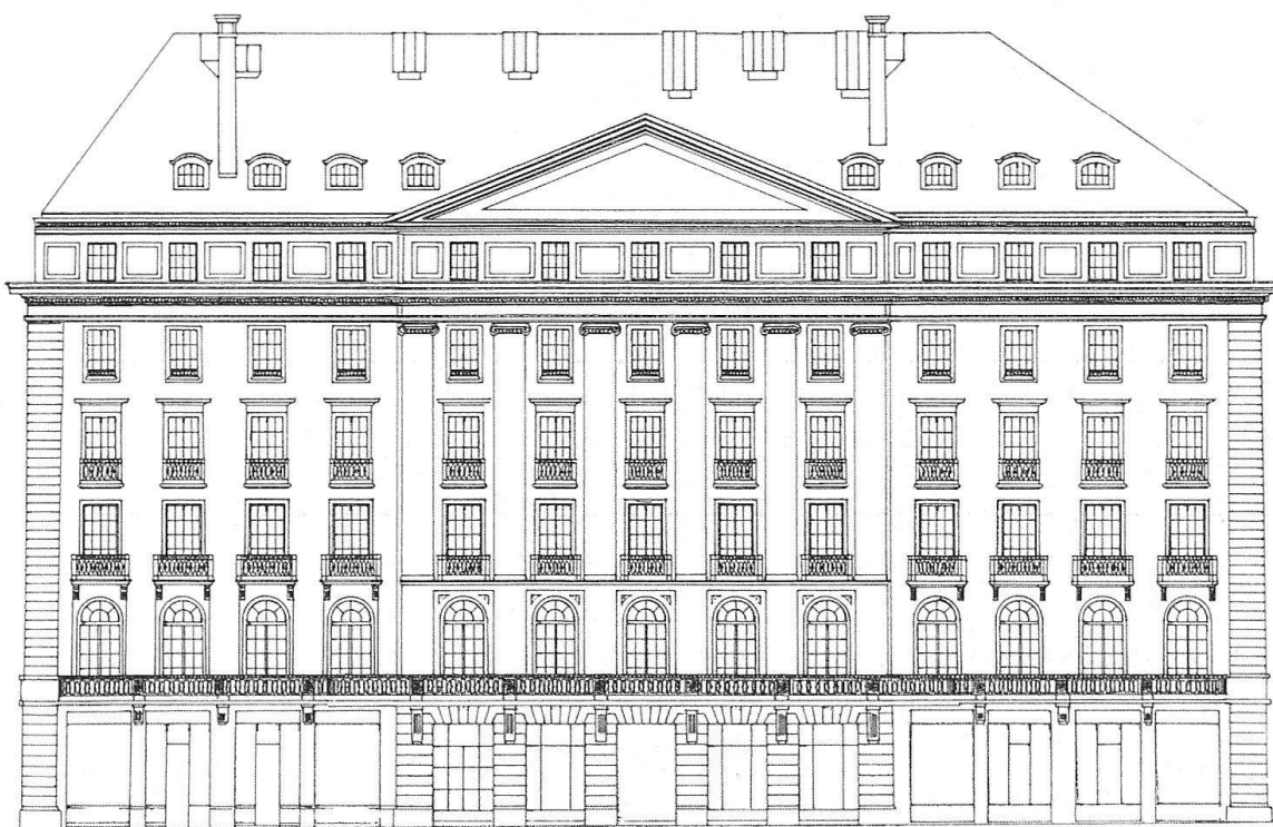
Fig. 6. Genève. Façade principale de l'Hôtel des Bergues relevée par le Bureau d'entraide technique en 1940

Conclusion : l'Hôtel des Bergues fut un des pionniers de l'hôtellerie suisse. Premier établissement de luxe genevois il souhaitait offrir à ses hôtes toutes les commodités alors à l'avant-garde. Un prospectus de publicité de l'hôtel de 1835 et un autre de 1844 12 nous donnent toutes sortes d'indications précieuses sur les avantages dont pouvait bénéficier la clientèle. Les voitures et équipages des voyageurs étaient soignés par des palfreniers. Ceux qui le désiraient pouvaient louer des «calèches à deux chevaux», des «chars à un cheval» ou simplement des «chevaux de selle» pour les promenades et excursions dans les environs. Les journaux et revues étaient à disposition des lecteurs dans les «salons de compagnie chauffés et éclairés» ou dans le «salon de lecture». Les repas se prenaient à la salle à manger à «table d'hôte» ou «en particulier» – ce qui revenait plus cher – et l'on y dégustait des «mets apprêtés à l'anglaise ou à la française». On pouvait aussi se faire servir en chambre. L'hôtel ne comportait, semble-t-il, pas de lieux équivalents à des salles d'eau, puisque les clients prenaient des bains de pied dans leurs chambres. On payait en plus les bougies et les feux de cheminées (chaque chambre était pourvue d'une cheminée) que l'on faisait brûler.