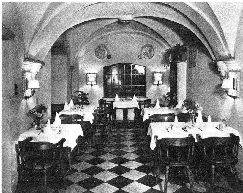
Abb. 6. Brig. Hotel «Couronnes et Poste». Kreuzgratgewölbter Raum (barocker Hausgang?), als Speisesaal benützt

1935 liess Josef Escher, Sohn, den Flügel links vom Treppenturm abreißen, wodurch sich der Durchgang für die Strasse auf etwa 9 Meter erweiterte (Abb. 2 und 7). Der Eingriff veränderte die architektonische Wirkung des Hotels. Der Turm, der vorher wie ein Dekor aufgesetzt erschien, wurde zum Eckturm. Der Umriss des Hotels