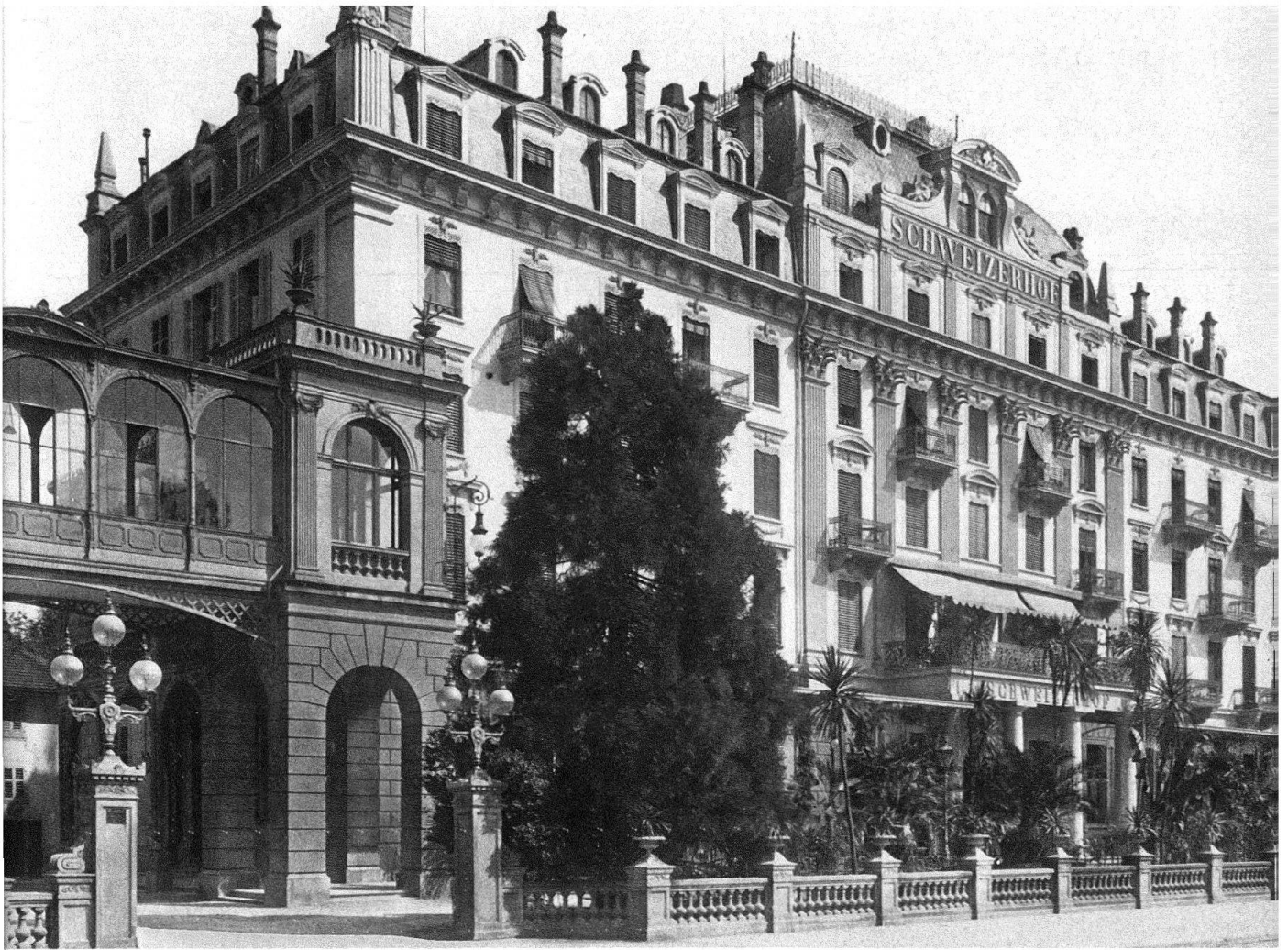
Abb. 2. Luzern. Hotel Schweizerhof. Die Seefassade mit dem Mansardgeschoss von 1885/56 und den Verzierungen der Zeit

Das Hauptgebäude (Abb. 1) wurde 1844/45 errichtet von den Gebrüdern Segesser, welche nebenbei noch das Gasthaus Rigi-Kaltbad betrieben. Die Dépendancen entstanden 1855/56; 1868 wurde die östliche, 1881 die westliche durch eine Passerelle im Obergeschoss mit dem Hauptbau verbunden. 1885/86 erhöhte Architekt Bringolf das Hauptgebäude um ein Mansardgeschoss. Der Mittelrisalit erhielt ein Klostergewölbe als Bedachung. Die Fassade wurde im historistischen Zeitgeschmack verziert (Abb. 2). Die Erhöhung der Dépendancen erfolgte 1898/99. Bei den Restaurationsarbeiten von 1954/55 kam es zur grossen Rasur: im Sinne des Nachkriegspurismus wurden die «Stil»-Dekorationen von 1886 wieder entfernt, um die Architektur dem ursprünglichen Bestand anzugleichen.