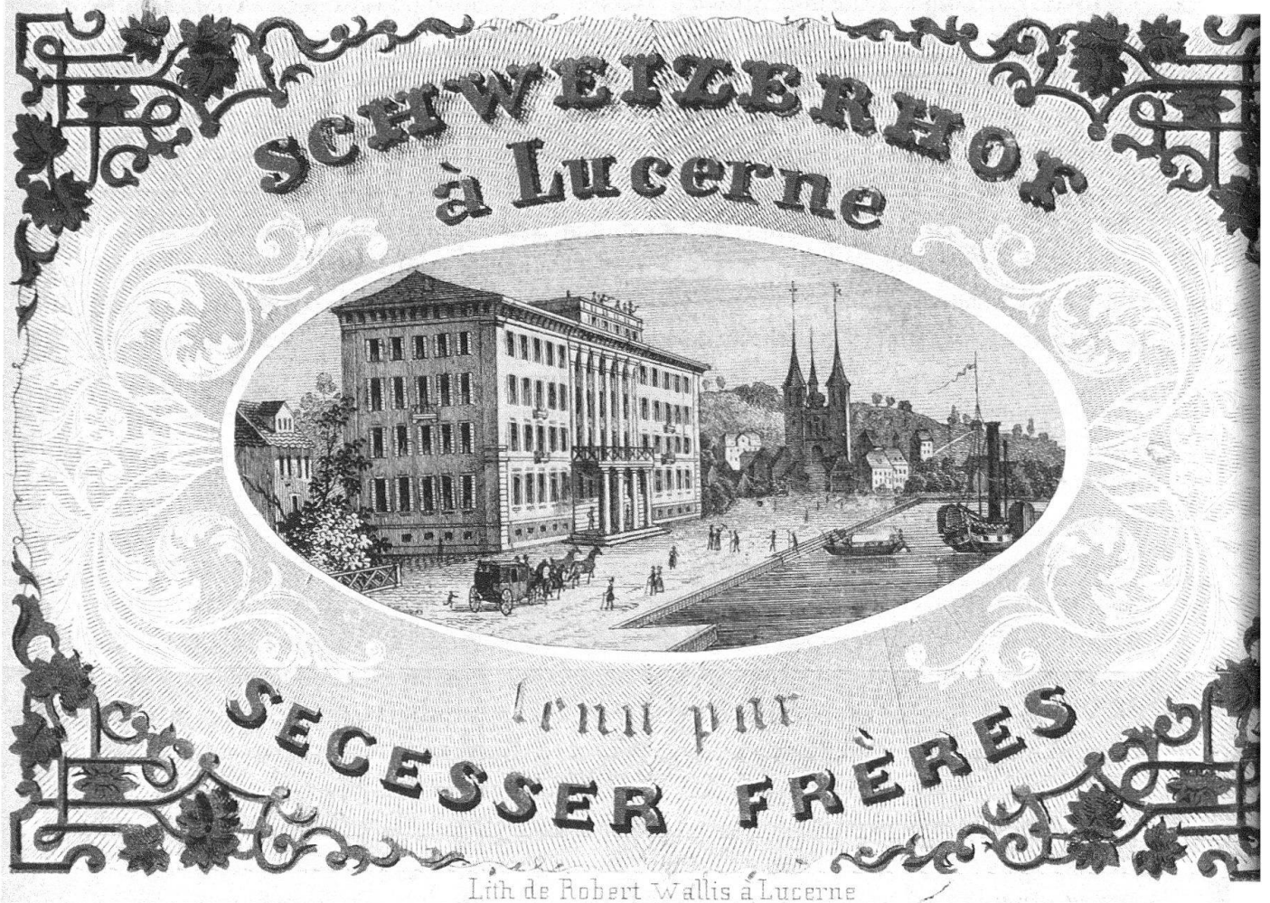
Abb. 1. Luzern. Hotel Schweizerhof. Das Hauptgebäude von 1844/45 (zeitgenössischer Prospekt)

1 Stadtarchiv Luzern: B3.29.363, Nationalquai (1853–1865)