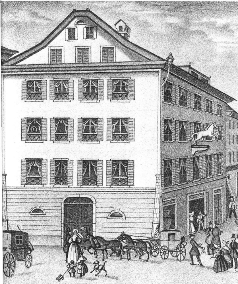
Abb. 7. Luzern. Hotel Rössli, vor dem Umbau von 1899/1900

Neben den Häusern auf neuerschlossenem Baugebiet entstanden im Verlauf des 19. Jahrhunderts auch in der Altstadt grössere Hotelbauten, etwa das Rütli am Untern Hirschengraben (1865) und das Hotel Balance an der Reuss (1810). Einige dieser Gasthöfe können auf eine jahrhundertalte Tradition zurückblicken: das Hotel Rössli am Mühlenplatz – 1467 erstmals erwähnt – gehörte seit jeher zu den renommiertesten Absteigen Luzerns. Die Umgestaltung des alten Gasthofes (Abb. 7) in ein modernes Hotel erfolgte in den Jahren 1899/1900 unter der Leitung von Architekt Meili-Wapf. Der gotisierende Treppengiebel und der dreigeschossige, polygonale Erker mit Zwiebelhelm an der Südwestflanke des Neubaus bildeten einen malerischen Abschluss des Weinmarktplatzes gegen Osten (Abb. 8). Nicht lange erfreute sich der Gasthof seiner neuen Gestalt. Die langwierige Krise des Tourismus in der Zeit der beiden Weltkriege machte dem Betrieb schwer zu schaffen. 1942 wurden im Rahmen des städtischen Notstandsprogramms aus den 70 Hotelzimmern 28 Wohnungen für Obdachlose gemacht. 1946 wich das Gebäude dem Bau des Warenhauses EPA.