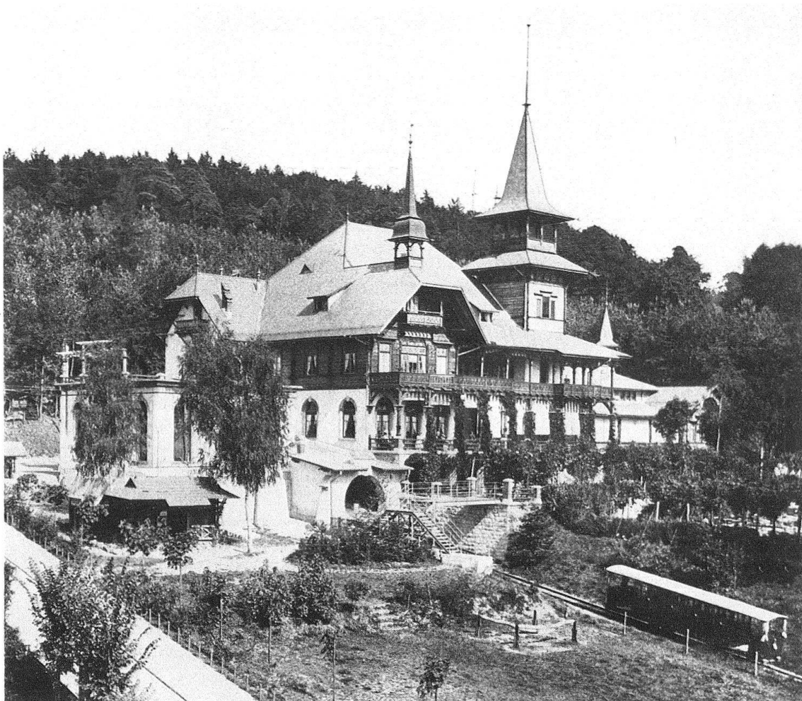
Zürich. Waldhaus Dolder, Stations- und Restaurationsgebäude, 1894 erbaut, 1972 abgetragen

Der «Prospect» schilderte zuerst Grösse und Schönheit der «wachstumsfreudigen» Stadt Zürich, um – nach einem kurzen Schreckensbild der «nervenerschütternden Massen-Eindrücke des Erwerbslebens» – das ganze Begriffsarsenal von Naturschönheit, Erholung und Erhebung durch die Natur zu evozieren.