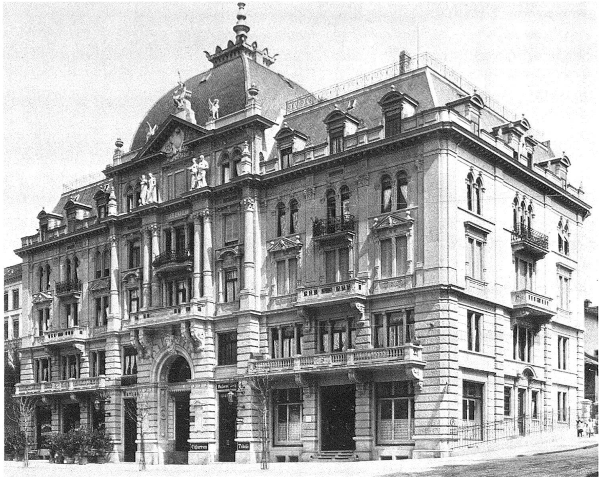
Zürich. «Römerhof», Talstation der Dolderbahn, 1898–1900 erbaut (Foto von 1901)