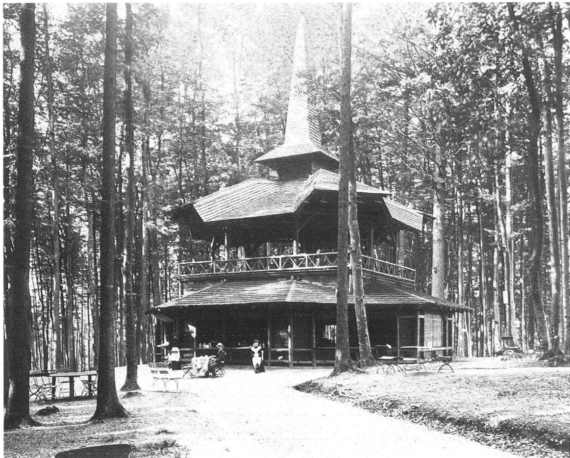
Zürich. Dolderpark. Restaurations-Pavillon, 1897 erbaut

Nun ging es Schlag auf Schlag. Schon im September 1894 erhielt Ing. Ulrich Bossard den Auftrag zum Bau der Dolderbahn . Am 23. Juni des gleichen Jahres wurde der Architekt Jacques Gros damit betraut, eine Restaurationsbaute mit Bergstation samt Umgelände zu erstellen. Der Prospekt von 1892 hatte mit Kosten von Fr. 70 000.– gerechnet, «der Verwaltungsrat kam aber alsbald zur Überzeugung, dass es ein Fehler wäre, das Unternehmen in kleineren Dimensionen zu halten, dass vielmehr nur mit einem grossen und wenn auch einfachen doch hübsch gehaltenen Etablissement den Interessen der Gesellschaft gut gedient würde» 6 . Die Kosten sollten sich also nun auf Fr. 160 000.– beziffern.