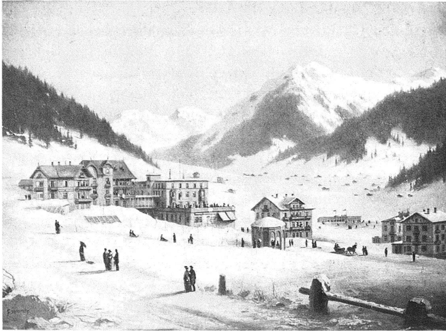
Abb. 3. Davos. Blick von der Oberen Strasse nach der Promenade und dem Eisfeld. Links das flachgedeckte Kurhaus und seine D pendancen.  lbild von F. Sommer (Heimatismuseum Davos)

schied zum Beispiel «Kurhaus», wo ein wichtiges Einzelobjekt breit dargestellt ist, wird hier die Einheitlichkeit der Bebauung und die Entwurfsarbeit eines f r Davos wichtigen Architekten mit der Wiedergabe von Pl nen veranschaulicht. Die Varianten Stein/Holz bei den Veranden wie Flachdach/Giebeldach zeigen in  rtlicher Verdichtung ein Kapitel aus der Davoser Baugeschichte auf. Das zitierte Inserat erinnert an die wichtige Rolle der Werbung im Hotelwesen, ihre Ber cksichtigung er ffnet gerade f r die Baugattung «Hotel» typische Aufschl sse. So erg nzt der Inventarteil den  berblicksteil und umgekehrt.