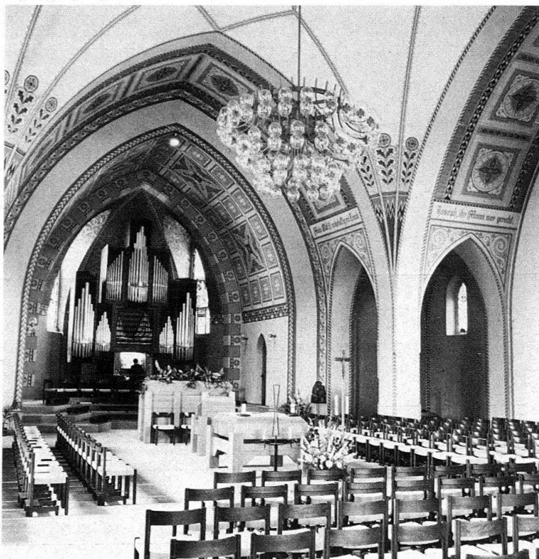
Töss. Katholische Kirche St. Joseph. 1913/14 erbaut von Adolf Gaudy, 1977 restauriert

Dank der sorgfältigen Restaurierung des gesamten Wandmalerei-Programms ist ein ausserordentlich ausdrucksvoller, festlicher Raum von hoher Originalität entstanden.