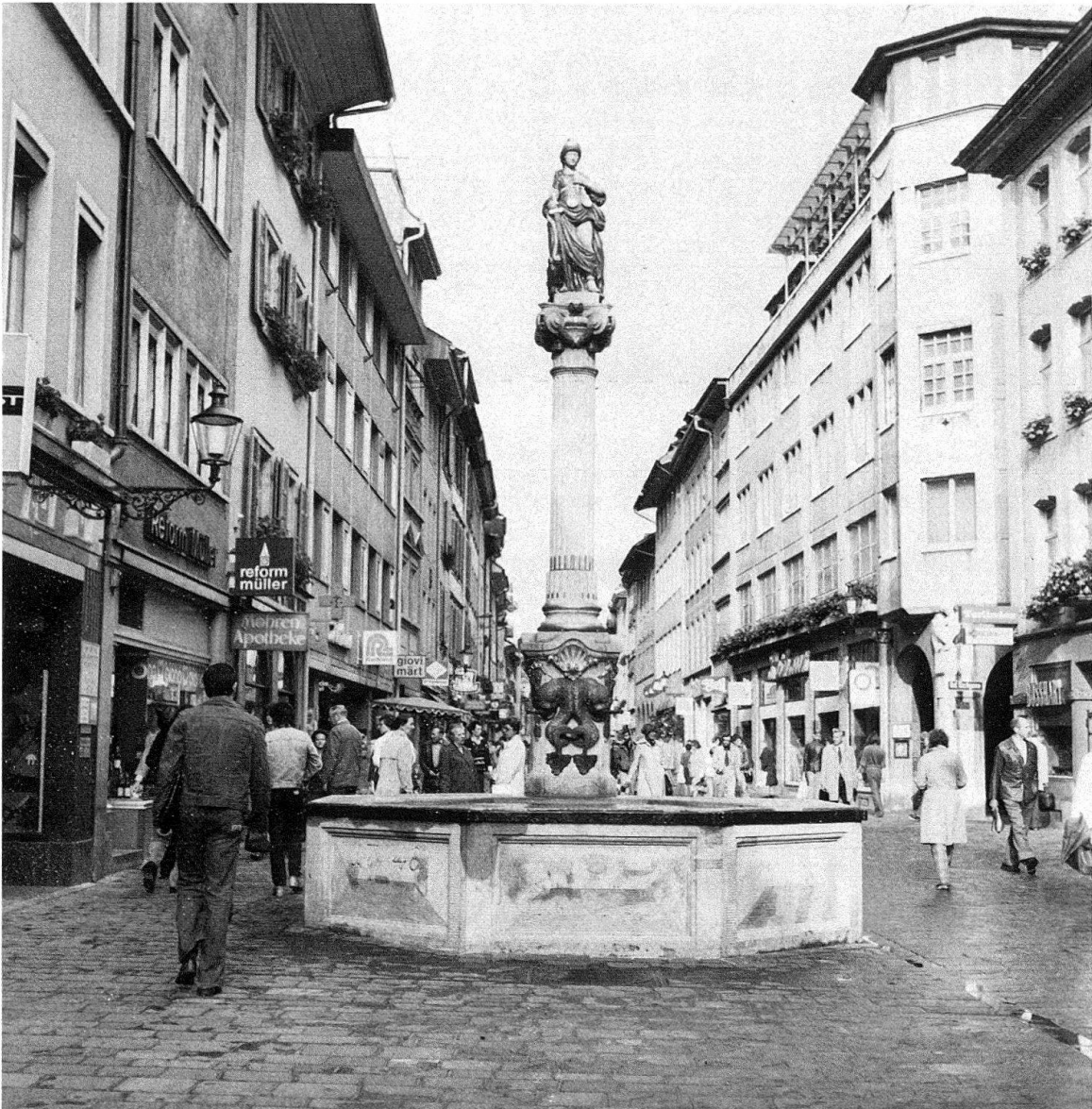
Winterthur. Marktgasse – eine Fussgängerzone mit Natursteinplatten (rötlichgrauer Porphyry) und dem in die Gasse zurückversetzten Justitia-Brunnen

Als sie um 1965 vom Autoverkehr und von der Parkierung befreit werden konnte, begannen Diskussionen um die Beseitigung der störenden und einengenden Trottoire und den Ersatz des Asphaltbelages durch einen massstäblicheren Steinbelag. Geprüft wurden verschiedene Arten von Pflästerungen und Plattenbelägen aus Natur- und Kunststein. Darüber, dass ein Kunststeinbelag nicht in die Altstadt passe, in der sich der Sandstein als Material für Fenster- und Türgewände, Gurte und Eckklisenen und sogar für vereinzelt Fassaden behauptet hatte, wurde die Stadt mit den Anstössern bald einig. Zu langen Diskussionen und mehreren Besichtigungen gaben dagegen die Entscheide über Pflästerung oder Plattenbelag, Steingrössen und Steinsorten Anlass. Eine Bollenstein- oder Kieselplästerung, wie sie seit dem späten 15. Jahrhundert nachgewiesen ist, kommt für eine Geschäftsstrasse nicht in Frage. Eine Bogenplästerung aus kleinen Steinen wäre ebenso fremd gewesen wie ein grossformatiger Granitplattenbe-