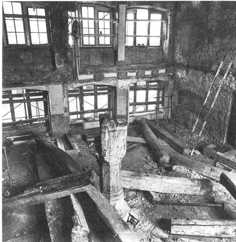
Zürich. Haus «Zur Treu», Marktgasse 21. Es wurde ausgeräumt...

Der statische Zustand des Gebäudes war bedenklich, die sanitären Einrichtungen mangelhaft – eine (!) Badewanne im ganzen siebengeschossigen Haus. Die Bauherr-