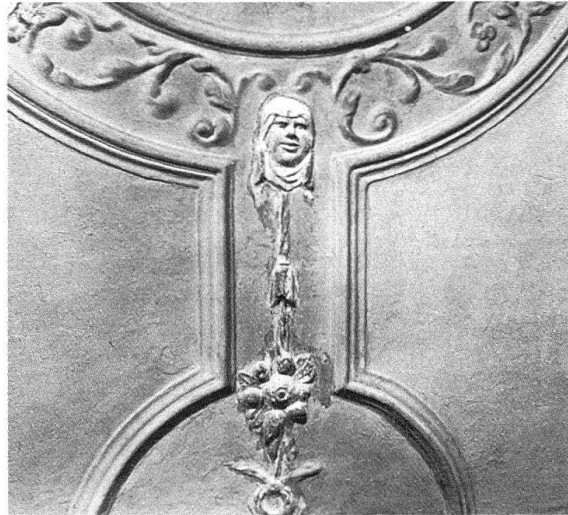
Zürich. Haus «Zur Treu», Marktgasse 21. Ranken-Balkendecke (Fragment, 17.Jh.); Detail aus der Stuckdecke, die verschoben und damit erhalten werden konnte (17.Jh.)

hen die Ranken die einzelnen Felder, immer wieder anders mit gegenläufigen Trieben ineinander verkettet, beherrscht im Gesamteindruck, lebendig im Detail.