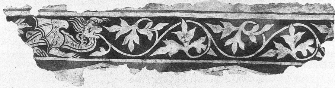
Zürich. Haus «Zur Treu», Marktgasse 21. Zwei abgelöste Fragmente einer Wanddekoration, 14. Jh.

schaft hatte sich daher zu einer vollständigen Auskernung entschlossen. Eine solche bot wohl dem Archäologen vielfältige Einblicke, bedeutete aber auch einen weitgehenden Substanzverlust, der durch keine Dokumentation wettzumachen ist. Um so erfreulicher ist es daneben, nicht nur von Neufunden, sondern auch von deren Erhaltung berichten zu können.