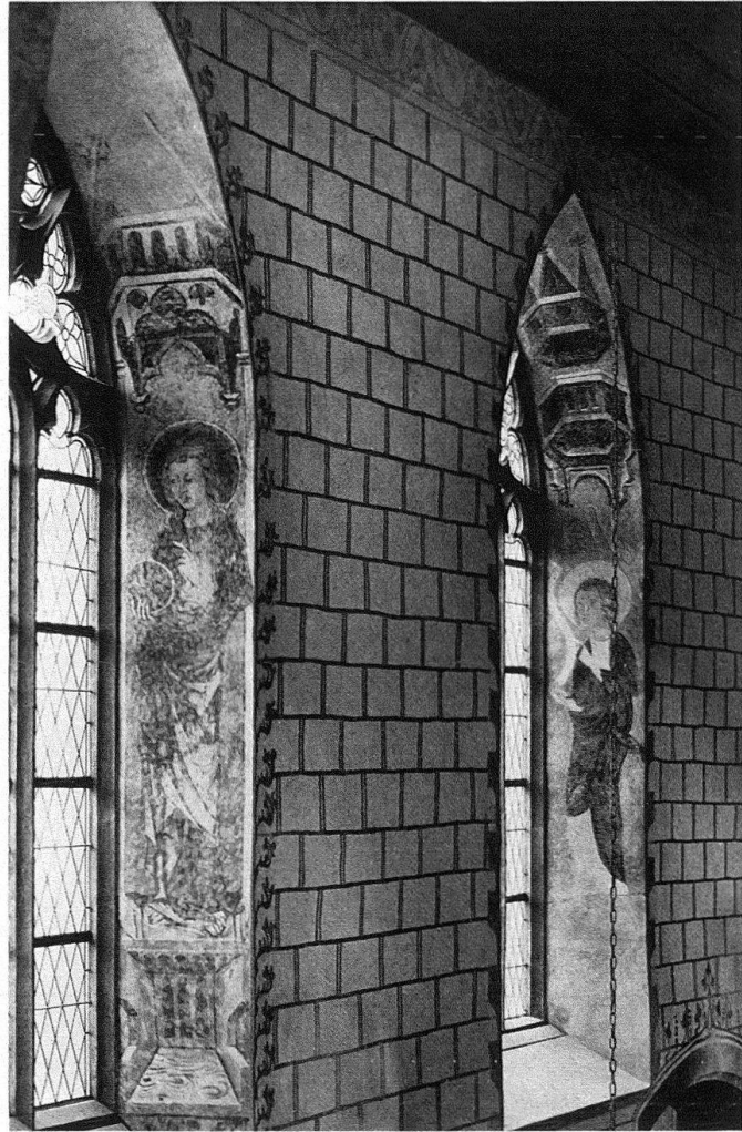
Basel. Predigerkirche. Nördliches Seitenschiff: Johannes der Täufer und Engel der Verkündigung, 2. Hälfte 14. Jh.

den gegen den Mittelraum öffnen; sie hatten einstens die Funktion von Seitenkapellen. Eine gewisse stärkere Trennung bildet nur der jetzt wieder in den ursprünglichen Zustand zurückversetzte Triumphbogen, welcher sich heute erneut weit und hoch auf tut, so dass mehr die durchgehende Verbindung zwischen Chor und Langhaus hervortritt als die Unterteilung. Auch zwischen Seitenkapellen und Nebenschiffen besteht in voller Breite eine offene kontinuierliche Arkadenverbindung. Das ergibt also auch hier ein Bauegefüge von grosser Einheitlichkeit, dessen Hauptimpulse nun bezeichnenderweise vom Schiff ausgehen; der Bereich der Priester ist damit gleichsam in die Raumkonzeption der Leutkirche einbezogen und wird als deren ausdehnungsmässig kurze Fortsetzung behandelt. Eine derartige Akzentuierung des Langhauses, des Predigtraumes, dürfte in der damaligen Zeit für Klostergotteshäuser etwas Neues dargestellt haben. Es scheint kein anderes Beispiel der frühen Bettelordensarchitektur bekannt zu sein, in welchem das priesterliche Altarhaus in solch konsequenter Weise der Leutkirche eingeordnet ist.