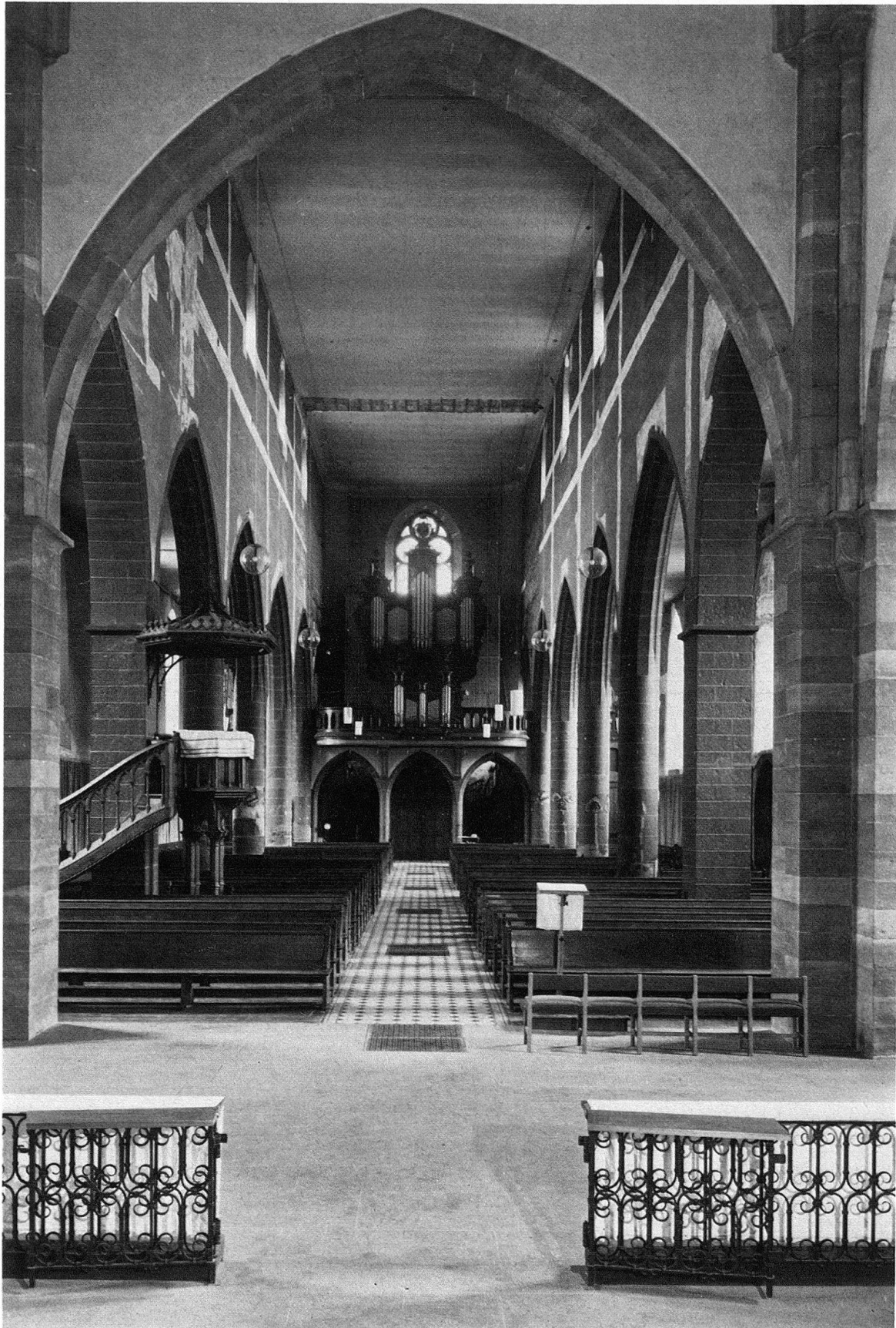
Basel. Predigerkirche. Das Langhaus nach W, vor der Restaurierung (nach der Restaurierung s. Titelseite)