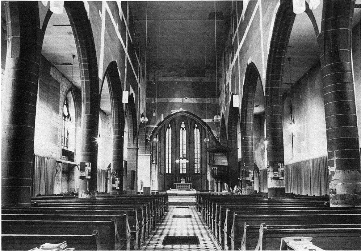
Basel. Predigerkirche. Langhaus, Triumphbogen und Chor vor der Restaurierung

schliessen. In den Fensterleibungen daselbst stehen auf Sockeln und unter Baldachinen in diskreten Farben gemalte überlebensgrosse Heiligengestalten. Sie stammen aus der zweiten Hälfte des 14. Jahrhunderts und weisen einen künstlerisch hervorragenden Rang auf. Zu dieser Gruppe gehören auch die beiden an den Wandarkaden des Westgiebels aufgefundenen Dominikanerfiguren.