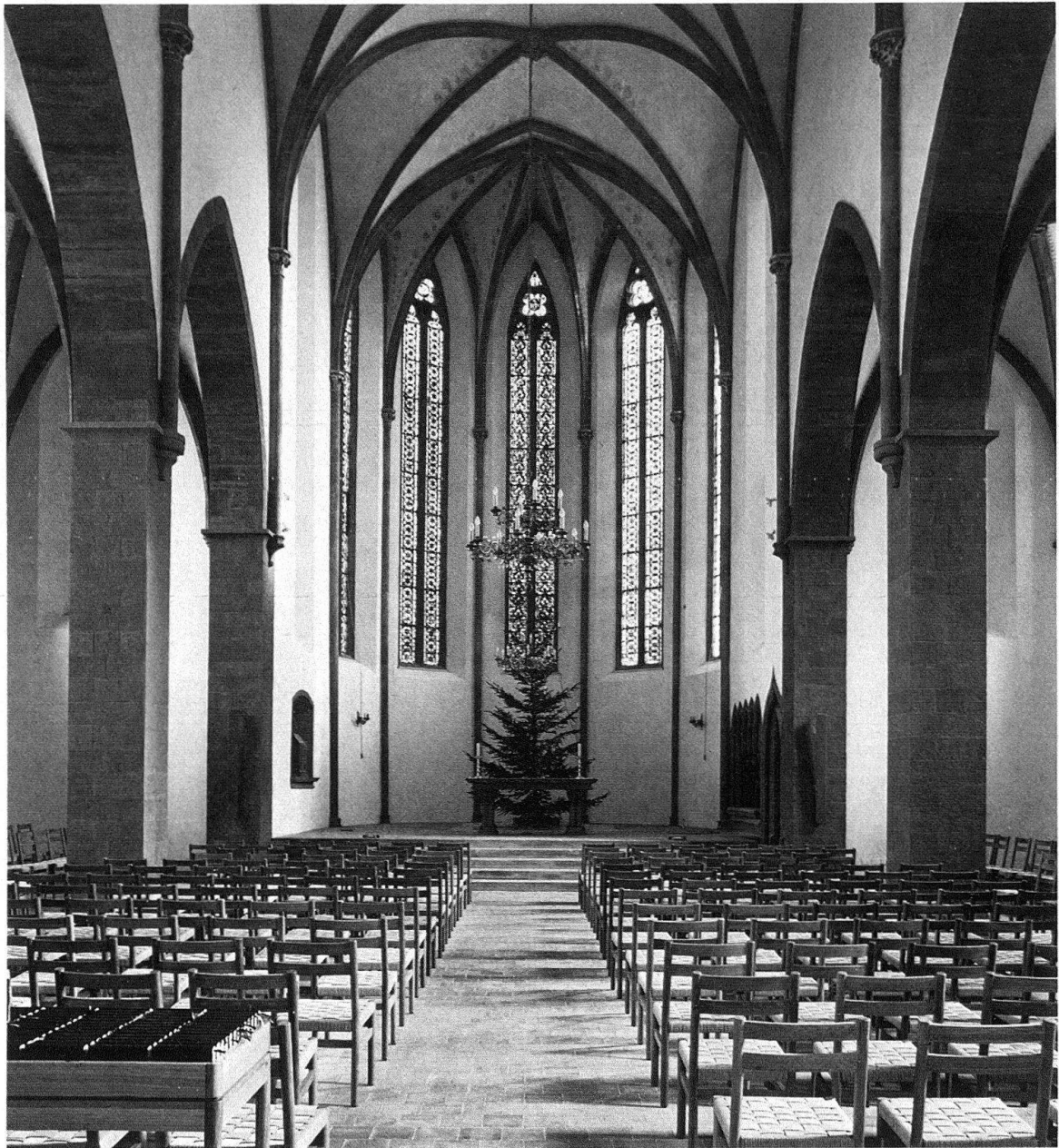
Basel. Predigerkirche. Das Altarhaus mit den abgedeckten Gewölbemalereien (zur Weihnachtszeit) nach der Restaurierung

tet an einer bevorzugten Stelle: man erblickt sie von Norden her im Grossbasler Rheinuferbild durch eine Häuserlücke. Ihr straff und einheitlich geformter Baukörper tritt auch dort in seiner ganzen Eigenart in Erscheinung, obwohl ihr gerade durchlaufender First die Häuserreihe am Stromufer nur wenig überragt. Doch schwebt der zierliche, sandsteinerne Glockenträger wie ein Echo auf die beiden Münstertürme (und diesen in der durchbrochenen Feinteiligkeit absolut ebenbürtig) über den Dächern. Damit erlangt neben den hoch auf den Hügeln stehenden und breitausladenden Pfarrkirchen mit ihren stämmigen Turmschäften auch dieser Sakralbautyp des mehr in der Taltiefe gelegenen Klostersgotteshauses im Basler Stadtbild die ihm gebührende Mitsprache. Nicht unerwähnt sei auch, dass die einstige Mönchskirche einen jener alten historischen