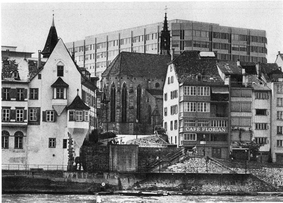
Basel. Das Chorhaupt der Predigerkirche in der städtebaulichen Situation von heute: links der Seidenhof, rechts die Häuser am Totentanz, im Hintergrund das neue Kantonsspital