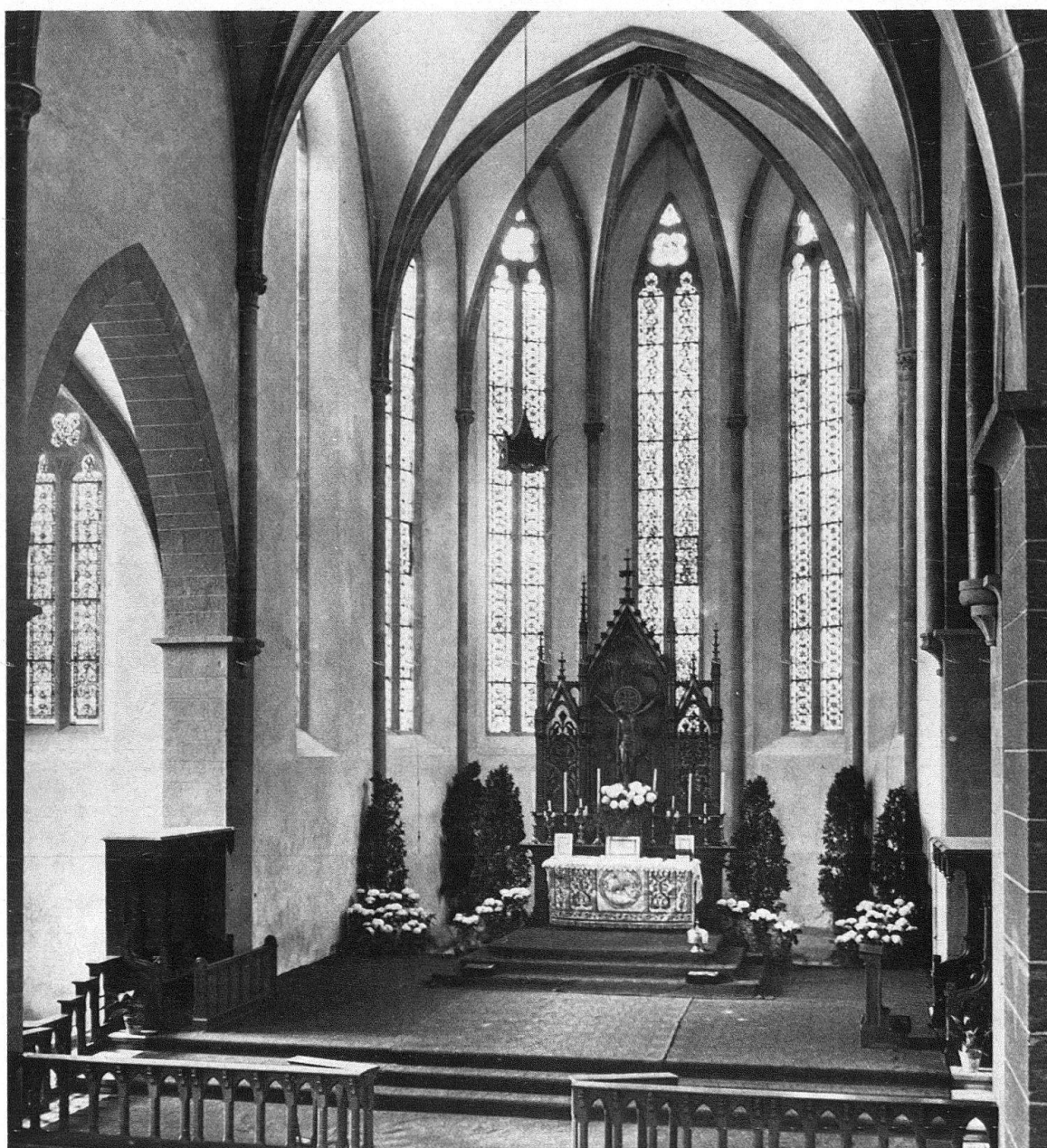
Basel. Predigerkirche. Das Altarhaus vor der Restaurierung (Aufnahme Mai 1950)

Trotzdem die restaurierte Predigerkirche in Basel nicht mehr in ihrer angestammten Umwelt steht, vermag sie als bedeutendes Kunstdenkmal sowohl innen wie aussen noch immer eine hervorragende Wirkung auszuüben. Sie erhebt sich städtebaulich betrach-