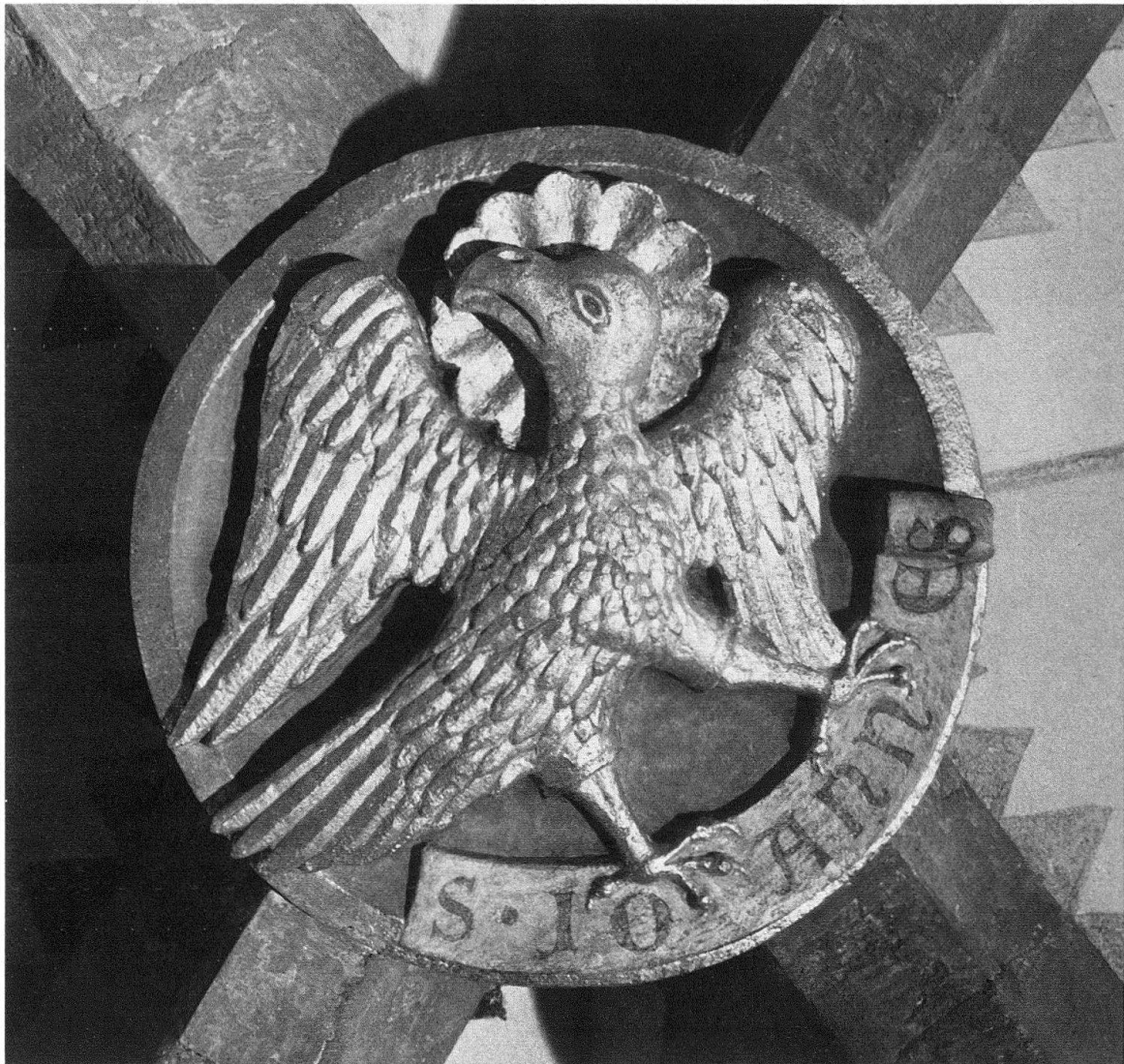
Basel. Predigerkirche, Chor, nördliche Seitenkapelle. Schlussstein: Evangelistensymbol des Johannes

Abschliessend sei noch allen bei der Herrichtung des Sakralbaues tätig gewesenenen Institutionen, Personen und Firmen für ihre Leistungen herzlich gedankt, in erster Linie der opferfreudigen Bauherrschaft, sodann der rührigen Restaurierungskommission, dem nimmermüden Pfarrherrn, den ratend beigezogenen Kollegen und Konsulenten, den trefflichen Architekten und ihrem ausgezeichneten Bauführer, den tüchtigen Spezialisten, Handwerkern und Lieferanten sowie deren Mitarbeiterstäben. Hohe Anerkennung und tiefer Dank gebührt aber nicht zuletzt den zuständigen Behörden von Kanton und Bund für ihre grosszügige finanzielle Unterstützung der, von vielen Mitbürgern mit freudigem Interesse verfolgten, heiklen Bewahrungs- und Verjüngungskur.