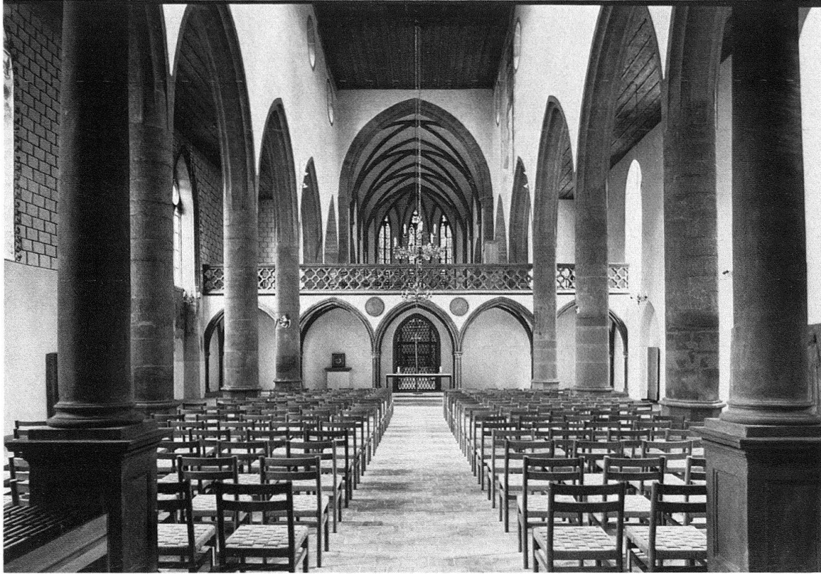
Basel. Predigerkirche. Langhaus, neu eingebauter Lettner, erhöhter Triumphbogen und Chor nach der Restaurierung

lung um die zwei am Westgiebel symmetrisch von beiden Seitenschiffestrichen emporsteigenden Dachtreppen ebenso leicht herstellen wie die Decken der Seitenschiffe, wo unter den Gipsplafonds leider keine Originalbestände mehr vorhanden gewesen sind.