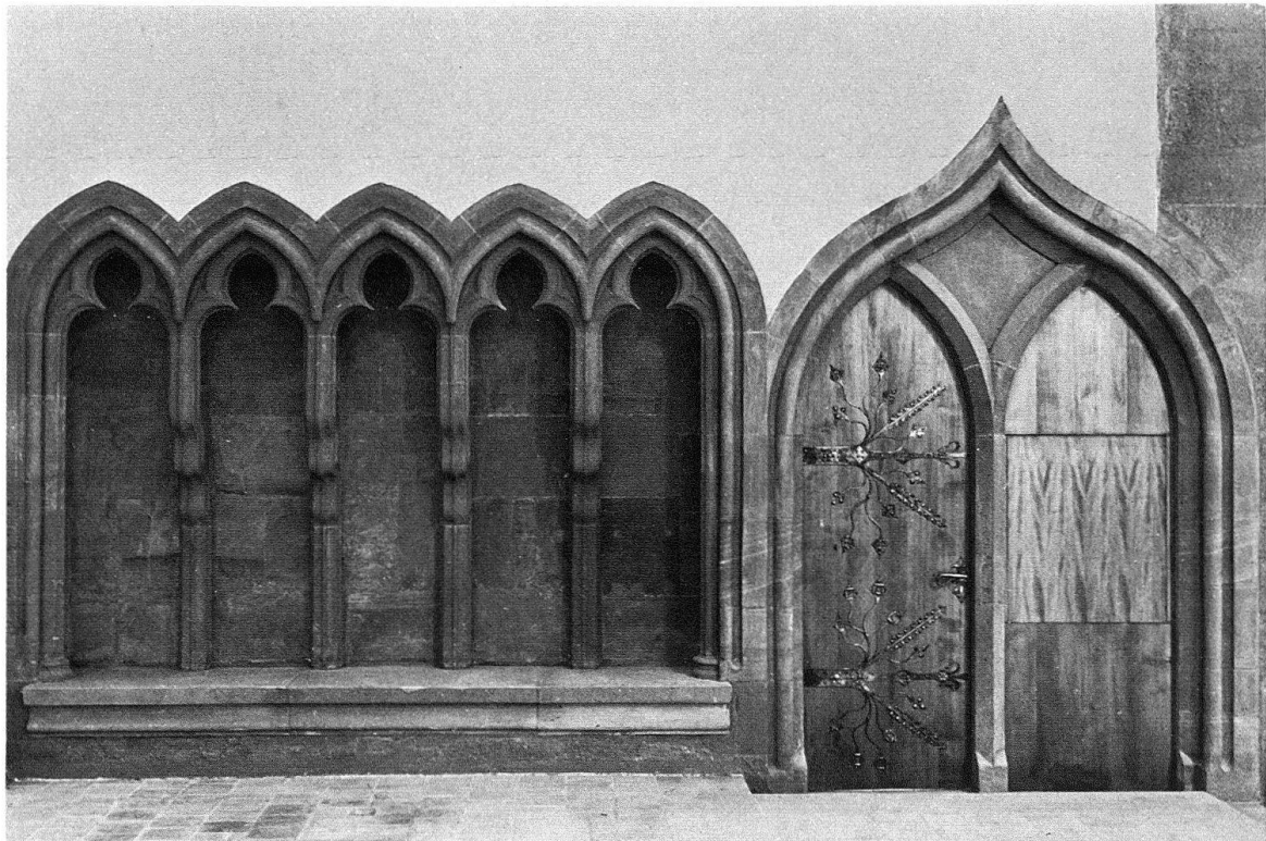
Basel. Predigerkirche, Chor. Priestersitze (früher Zelebrantenbank) und neu entdeckter Sakristeieingang

Von diesem Typus der frühen Bettelordens-Gotteshäuser haben sich im nördli-chen Europa nur wenige Vertreter erhalten; noch geringer indessen ist der überlieferte Bestand an derart frühen Sakralbauten im oberrheinischen Gebiet, welche vor allem deshalb von speziell hohem Interesse sind, weil in ihnen der Gedanke unbedingter Schlichtheit, die Verschmelzung von Langhaus und Chor zu einer geschlossenen kubi-schen Einheit besonders folgerichtig durchgeführt wurde. In ihrem Grundriss- und Aufbauschema zogen sie gewisse Anregungen der Hirsauer Bauschule (die auf dem