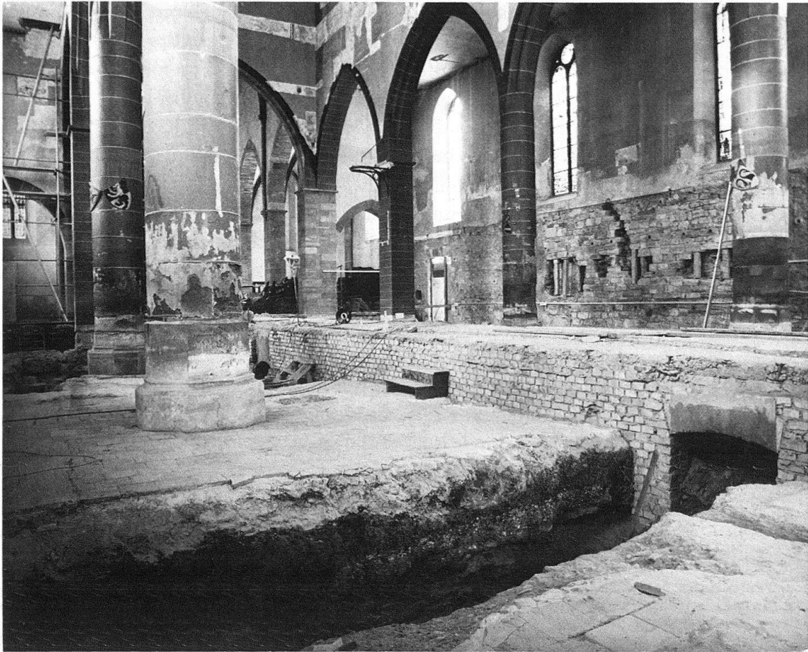
Basel. Predigerkirche. Um die Proportionen des ursprünglichen Baues aus dem 2. Drittel des 13. Jh. zurückzugewinnen, wurde die 1876/77 eingefügte Erhöhung des Bodenniveaus (60 bis 80 cm) wieder beseitigt und die Pfeilerbasen freigelegt

1948–1954 führte die Besitzerin mit Hilfe des Kantons am Äusseren eine Instandsetzungs- und Auffrischungsaktion durch und dehnte diese teilweise auch auf das Chorinnere aus. 1971 verlor das sakrale Bauwerk schliesslich seinen letzten mittelalterlichen Partner mit dem Abbruch des ehemaligen Wirtschaftstraktes an der Spitalstrasse 1. Dieser Bau ging vermutlich gleichfalls auf das 13. Jahrhundert zurück und wies einige bemerkenswerte Malereifragmente im Innern auf, die von der Denkmalpflege sichergestellt worden sind. Besagtes Objekt musste einem inzwischen errichteten Krankenhaus trakt weichen. Auch am Petersgraben schliessen seither grosse neue Spitalbauten sehr eng an das Gotteshaus an und bilden für die Kirche eine hinsichtlich Volumen und Masstab andere Nachbarschaft.