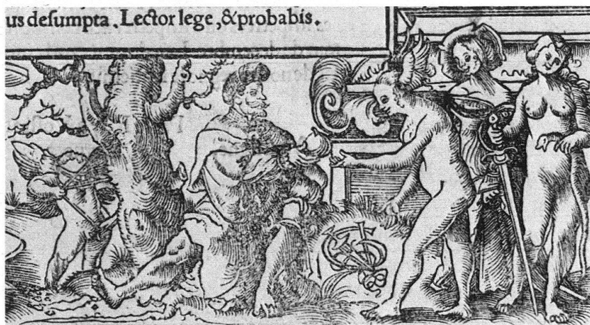
Urs Graf. Detail «Das Urteil des Paris» aus einem Titelblatt; Holzschnitt, 1519