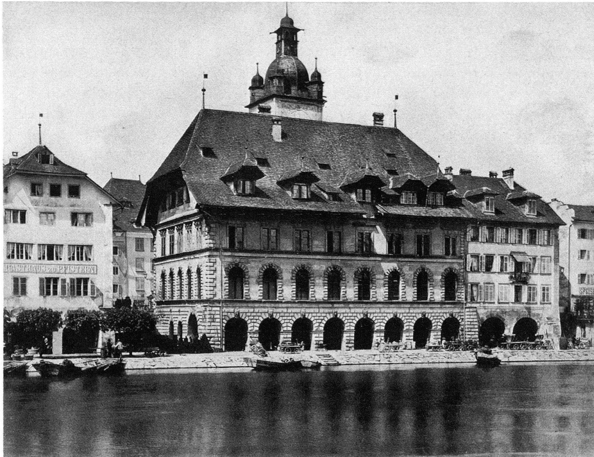
Luzern, Rathaus. Erbaut 1602 ff. Im Vordergrund die Reuss. (Aufnahme vor 1902)

die städtischen, modern-modischen Wohnungen verschleppten Bauernmöbel und Geräte, die sich hier mit andern Urtümlichkeitsträgern treffen, den echten, halb- und unechten Neger- und Südseeplastiken. Symptomatisch, was kürzlich in einem Zürcher Schaufenster – eines guten Geschäftes für moderne Möbel – neben einem schönen bauerlichen Stück zu lesen war: «Antikes Ochsenjoch, 130 cm, eignet sich als Wanddekor, Garderobe, umgekehrt für indirekte Beleuchtung».