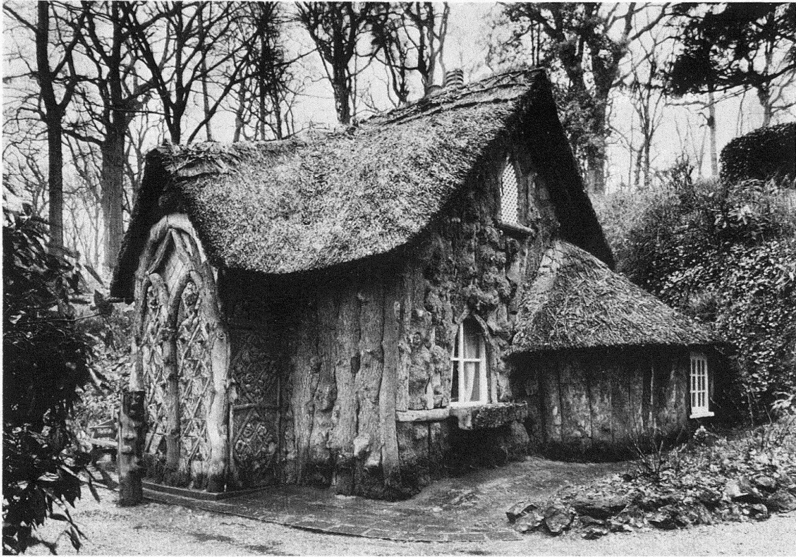
Borkenhaus in Henbury, Blaise Castle Estate. Entwurf von Humphrey Repton, 1791

hörigen Äusserungen zum Beispiel in der Literatur – Heimatromane –, «Volkslieder» in der Musik, die Trachtenbewegungen, die Volkstänze, die Wiederbelebung des Brauchtums und der alten Feste, all das gehört dazu.