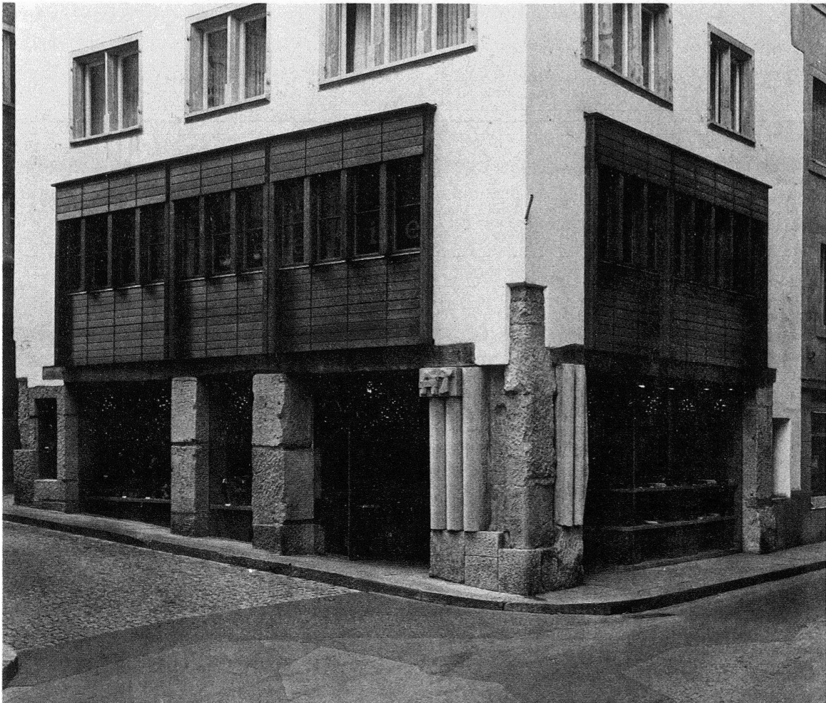
Zürich, Haus zur Gelben Gilde. Umbau von Manuel Pauli, 1969

Vitruv schildert in seiner, in den dreissiger Jahren des 1. Jahrhunderts vor Christus begonnenen Architekturlehre im 2. Buch die «Entstehung der Gebäude» als Laubhütten in der Urzeit der Menschheit. Und im 4. Buch gibt er nach der Beschreibung der