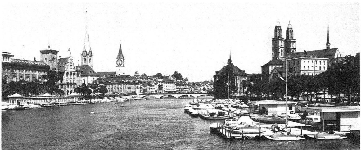
Abb. 1. Zürich. Blick von der Quaibrücke in den Limmattrichter, mit (von rechts): Grossmünster, Wasserkirche, St. Peter, Fraumünster und Stadthaus