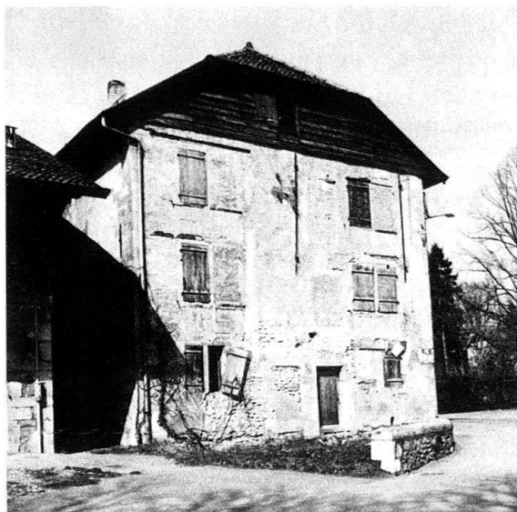
Château de Genthod, façade principale avant restauration