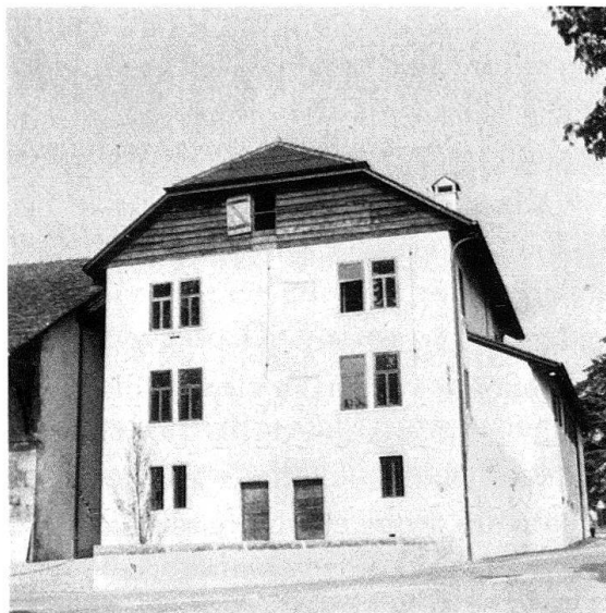
Château de Genthod, façade principale après restauration

Il va de soi que l'architecte auquel on fit allusion tout au long de ces débats devait être un spécialiste de la restauration, formé par des stages ou un enseignement de troisième cycle. Dans la réalité il n'est malheureusement pas rare que l'on confie le sort d'anciens bâtiments à des architectes «généralistes», ne manifestant pas d'intérêt particulier – si ce n'est financier – pour la restauration. C'est ainsi que des néophytes, faute d'obtenir d'autres commandes, prennent trop souvent encore en charge de tels travaux.