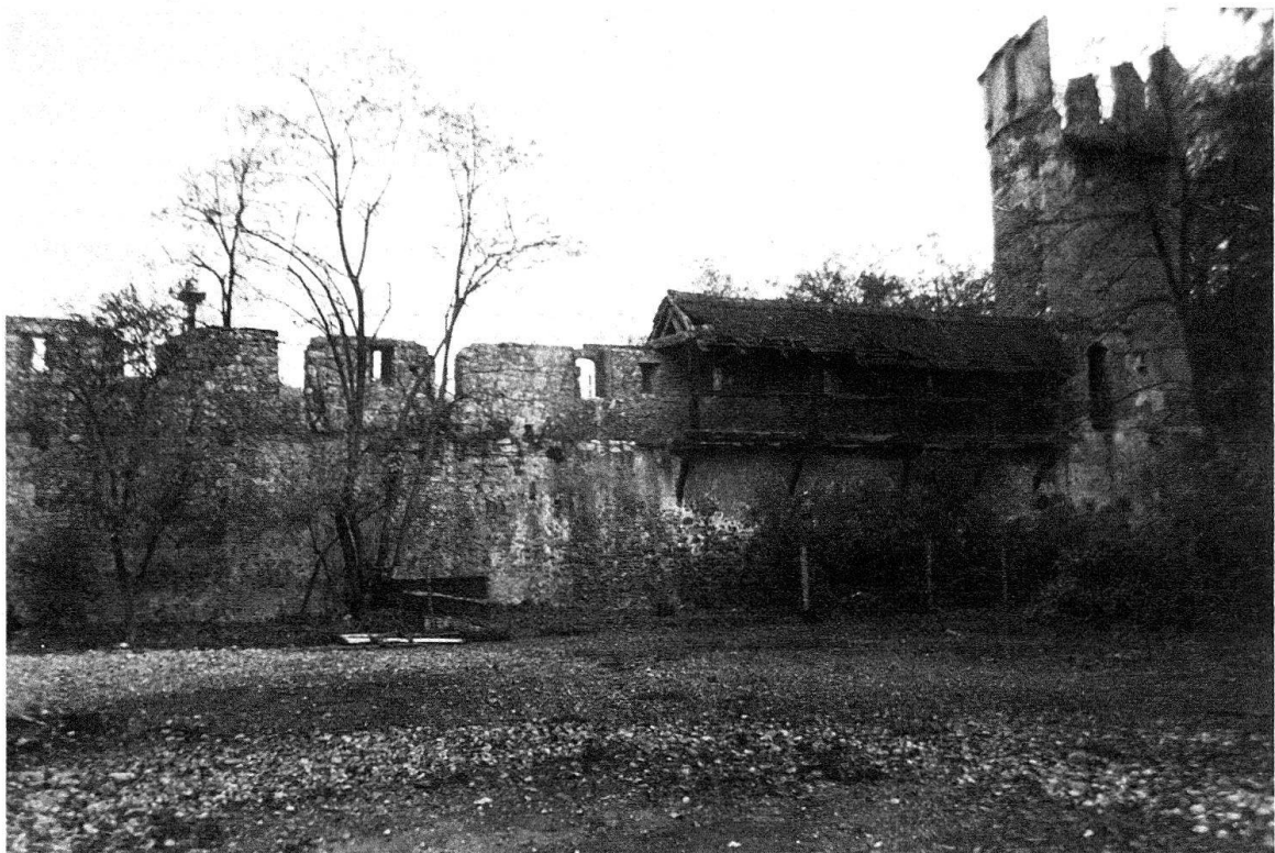
Abb. 1. Basel. Die Stadtmauer in ihrer Zerfallerscheinung

16. Entretien correct du monument par le propriétaire et contrôle régulier par les autorités responsables.