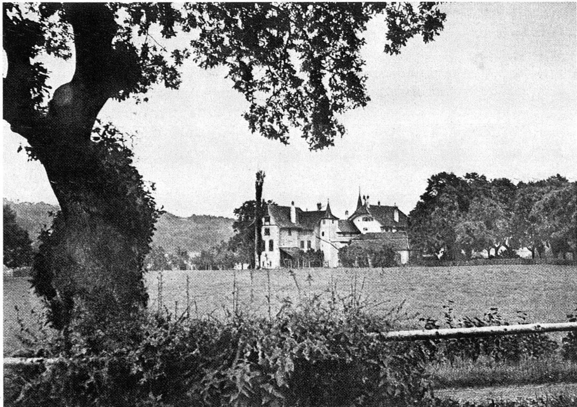
Bern. «Murifeld». Freihaltezone am Puffertgässchen mit Blick auf das Schloss Wittigkofen. – Gemäss Bauordnung galt das gesamte Gebiet als potentielles Bauland. Auf Grund der Planung ist der Landsitz nunmehr inmitten des ausgeschiedenen unüberbaubaren Landschaftsreservates gelegen. Der hier wiedergegebene Anblick von Schloss und Umgebung bleibt unberührt

Das Ziel war, die wirksame Lenkung der Verhältnisse im Verband eines Stadtteils in den Griff zu bekommen und derart den Ansatz einer städtebaulichen Integration zu bilden. Mit Bezugnahme auf die topographischen Gegebenheiten und die Lage der Landsitze, insbesondere auf das zentral gelegene Schloss Wittigkofen, sah nun die Planung vor, ein landschaftliches Reservat auszuscheiden und die verbleibende Fläche in