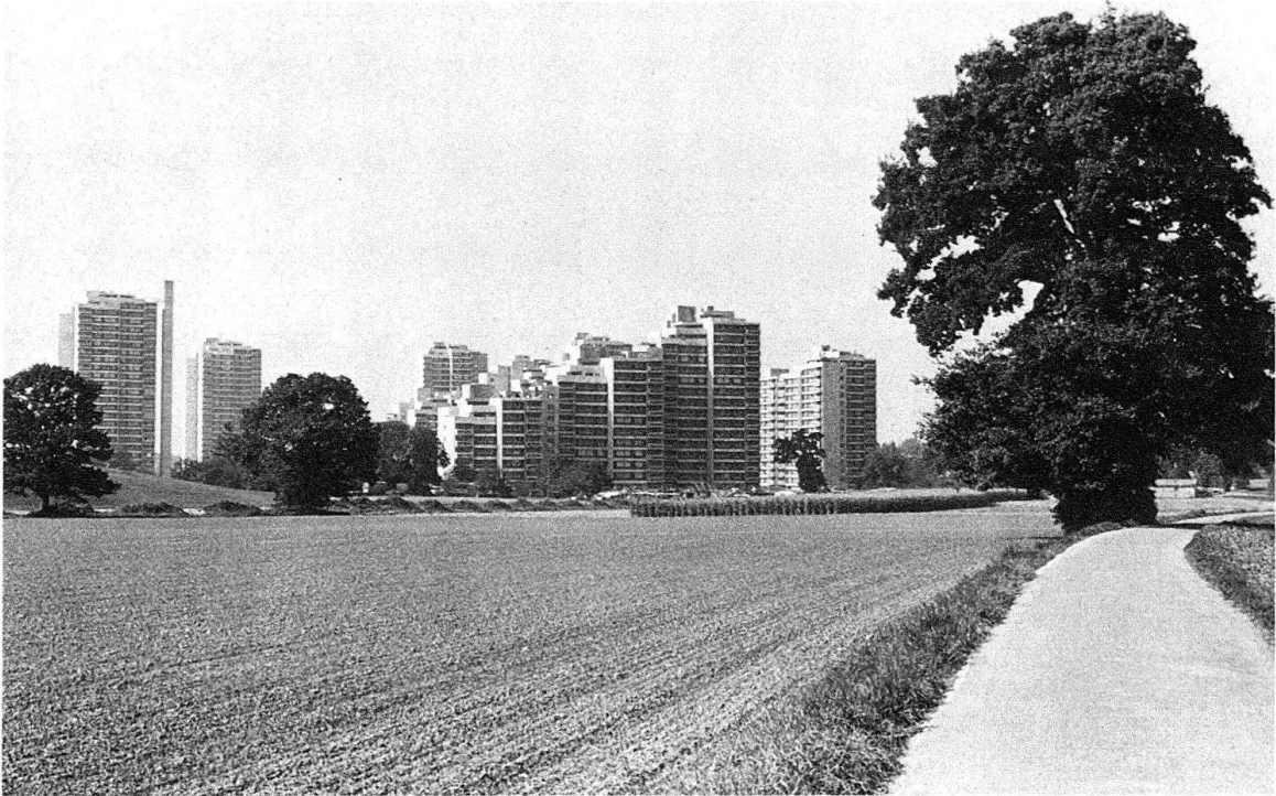
Bern. Melchenbühlweg im Landschaftsreservat mit Blick auf das Quartier Wittigkofen. – Das wertvolle Naherholungsgebiet wird auf Grund der Planung vom Verkehr abgeschirmt. Der Melchenbühlweg wahrt den Charakter des historischen Strassenzugs und bleibt dem Fussgänger vorbehalten

einzelne Baugebiete von begrenzter Ausdehnung aufzugliedern. Die erfolgte Einschränkung des verfügbaren Bodens sollte mittels konzentrierter Bauweise, sei es durch höheres Bauen, sei es durch verdichteten Flachbau, ausgeglichen werden. Die Verkehrserschliessung erfolgte tangential mit den peripheren Anschlüssen der Bauzonen. Die ausgesparte Grünzone wurde dabei wie das Baugebiet als gleichgewichtetes Element der Planung vom Verkehr freigehalten.