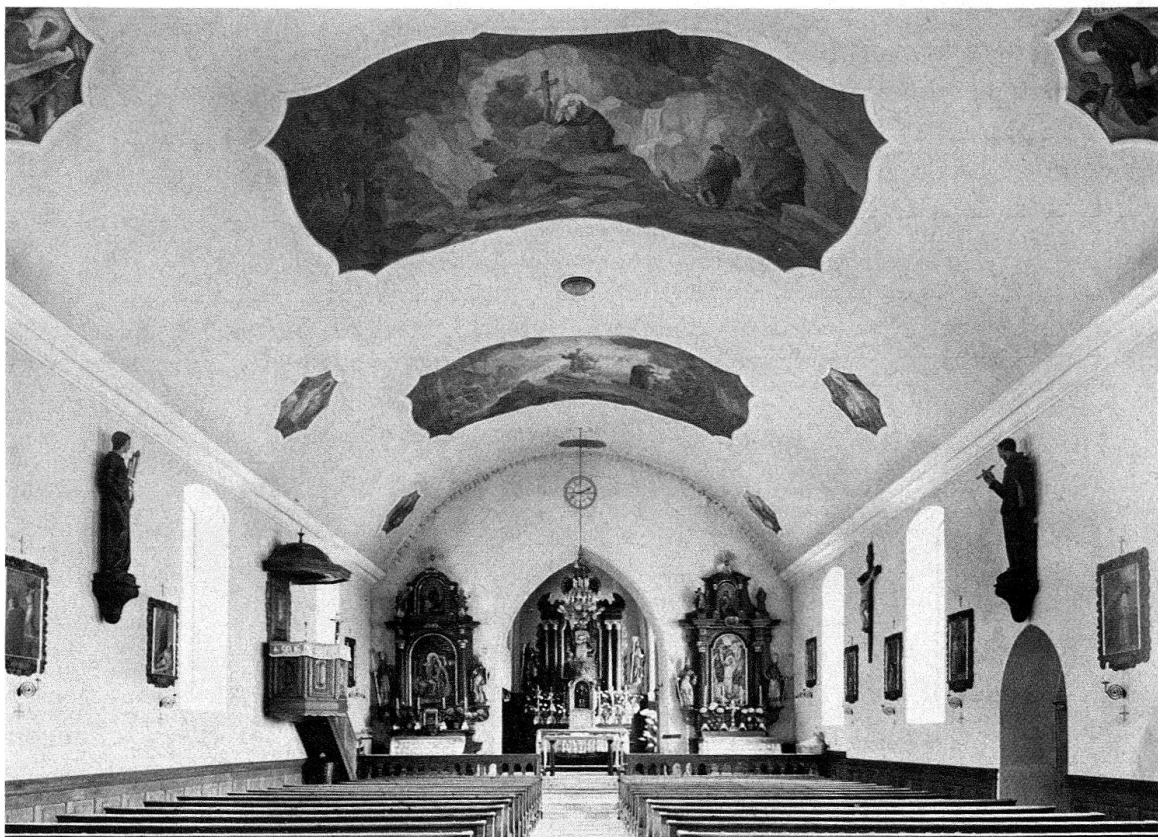
Amden, Pfarrkirche St. Gallus. Schiffstone von 1858, ausgemalt von August Meinrad Bächtiger 1923, Seitenaltäre barock

Noch ein Wort zu offenen Dachstühlen in der Kunstgeschichte. Es gibt sie im Hochmittelalter; zu erwähnen etwa der 1970 freigelegte, ursprünglich sichtbare Dachstuhl von 1235 im Marienmünster von Reichenau-Mittelzell. Dieser gewaltige «Schiffsrumpf» – ein Dachstuhl, der seinesgleichen nur in Frankreich sucht (z. B. im sog. «Fari- nier» von Cluny oder im Schloss Sully an der Loire) – begeistert uns heute vor allem deswegen, weil er nicht nur ein grandioses Werk der Zimmermannskunst ist, sondern