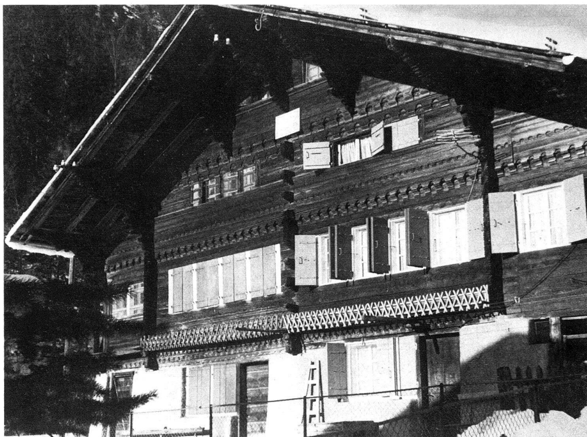
Fig. 3. Le Sépey, haut du village, 1735

Quant aux galeries, il s'agit d'abord de faire abstraction des balcons modernes qui déparent un certain nombre de façades. On dispose de trop peu d'éléments d'origine pour parler des galeries d'entrée; par contre, les maisons n'ayant pas été agrandies possèdent des galeries latérales hautes situées sous les avant-toits. Elles reposent sur des madriers de la façade laissés plus longs à cet effet, ce qui atteste leur authenticité. On y accède à partir de l'espace surmontant la cuisine, et elles devaient servir de bûcher.