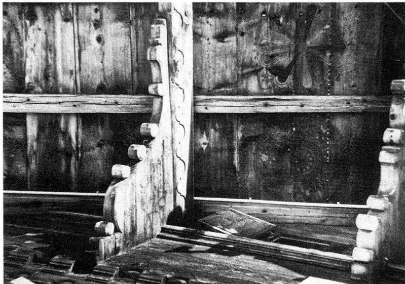
Fig. 4. Le Sépey, haut du village, 1735 (détail fig. 3)

Les inscriptions : Le contenu des inscriptions, dont l'étude se limitera au XVII e siècle, celles des maisons du Sépey ayant d'ailleurs été publiées 5 , révèle le souci non seulement d'informer, mais aussi d'édifier le passant. En effet, la plupart ne se réduisent pas à une simple formule appelant la bénédiction de Dieu sur la nouvelle construction, mais elles se composent de plusieurs versets bibliques, souvent extraits des Psaumes. On peut en dégager divers thèmes, le principal étant de remettre toute œuvre humaine à sa juste place face à la grandeur du Créateur, la «Maison céleste» démontrant la relativité de toute maison terrestre, ce qui amène naturellement l'exhortation à la vigilance vu la brièveté de la vie. Les encouragements à la générosité envers l'indigent reviennent plusieurs fois, ainsi que la nécessité de louer Dieu en tout temps ; enfin, deux inscriptions appellent à la protection divine contre les méchants.