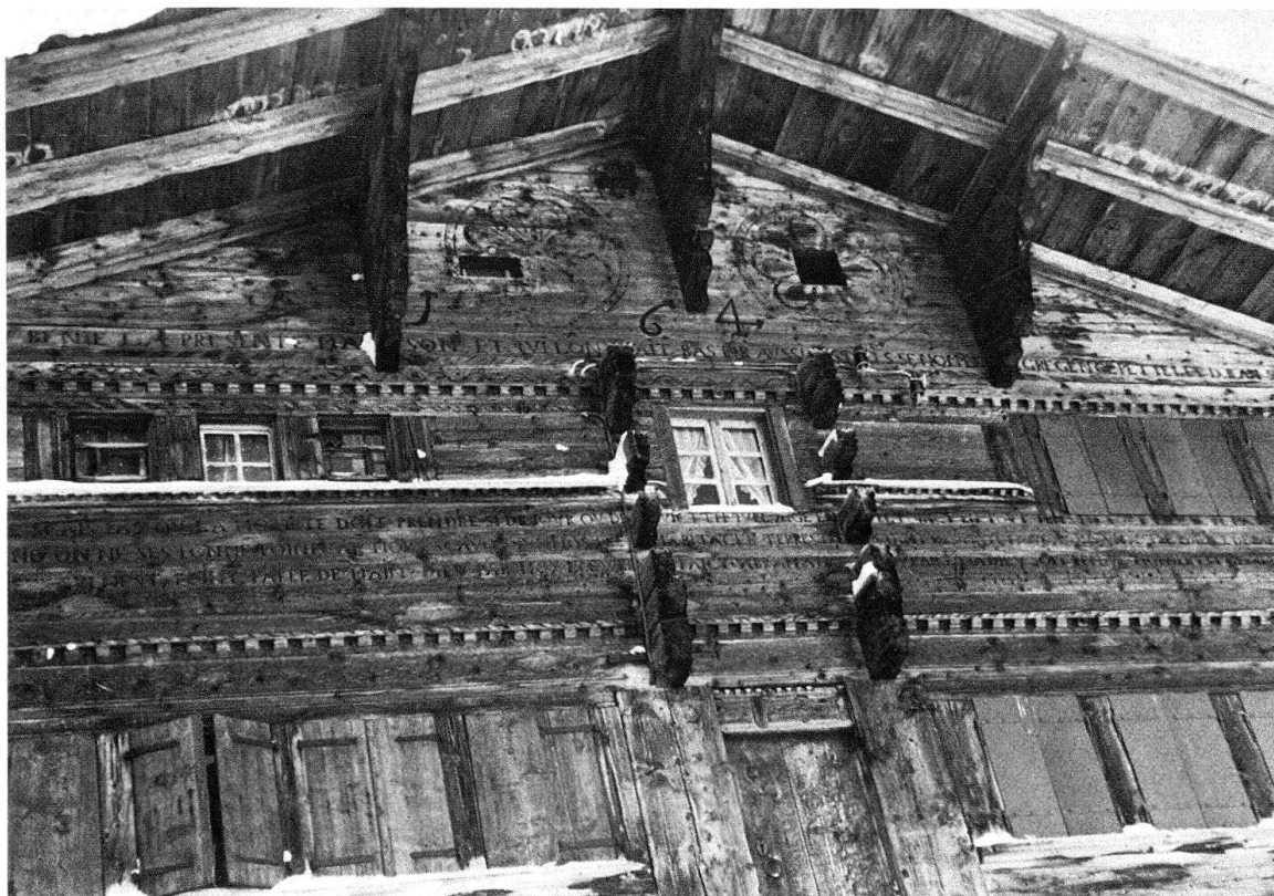
Fig. 1. La Forclaz, au Poyet, 1648

vingtaine d'habitations assez régulièrement espacées dans le temps jusque dans la deuxième moitié du XVIII e siècle, et accompagnées d'une dizaine de greniers conservés sur plus de 25 repérés sur les plans cadastraux anciens 3 . Les années 1800 à 1810 connaissent une vague de 5 reconstructions, alors que 5 autres se partagent tout le reste du siècle. Au début du XX e siècle sont édifiés le café et le magasin, puis en 1946 la chapelle, toujours en bois.