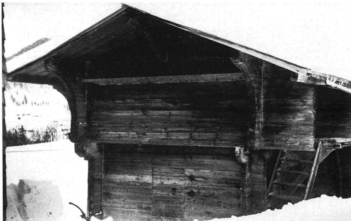
Fig. 5. La Forclaz, au Poyet, grenier de 1661

remarquer la qualité des portes : les plus anciennes sont faites de deux couches de planches posées l'une en largeur, l'autre en hauteur, et maintenues ensemble par de nombreuses chevilles de bois ou des clous à grosse tête (fig. 5). Ce procédé a également servi à fabriquer des portes de caves. Au XVIII e siècle apparaissent des portes à deux panneaux superposés entourés de traverses et montants massifs. Beaucoup gardent des serrures complexes et des boucles de fer forgées à la main.