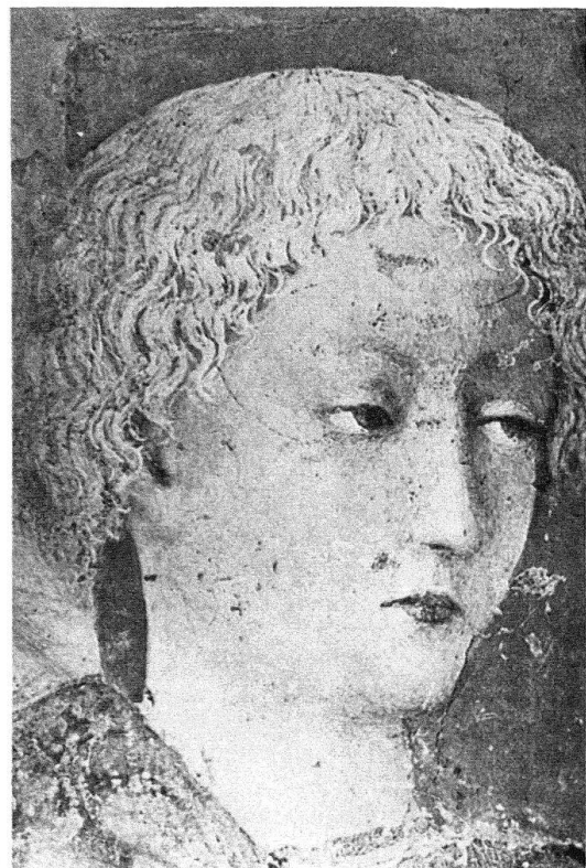
Castiglione d'Olona. Fresken von Masolino im Baptistarium. Jünglingskopf aus der Szene «Das Gastmahl des Herodes», 1435

GALLIANO (bei Cantù) Ottonischer Freskenzyklus in der Kirche S. Vincenzo , 11. Jh. Ikonographisch in der frühchristlichen Bildausstattung von Alt-St. Peter in Rom wurzelnd.