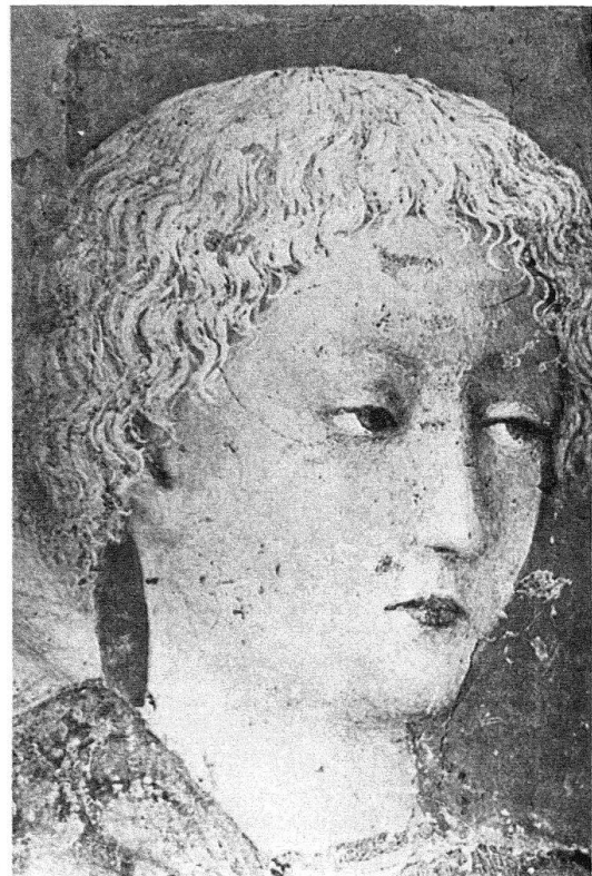
Castiglione d'Olona. Fresken von Masolino im Baptisterium. Jünglingskopf aus der Szene «Das Gastmahl des Herodes», 1435

GALLIANO (bei Cantù) Ottonischer Freskenzyklus in der Kirche S. Vincenzo , 11. Jh. Ikonographisch in der frühchristlichen Bildausstattung von Alt-St. Peter in Rom wurzelnd.