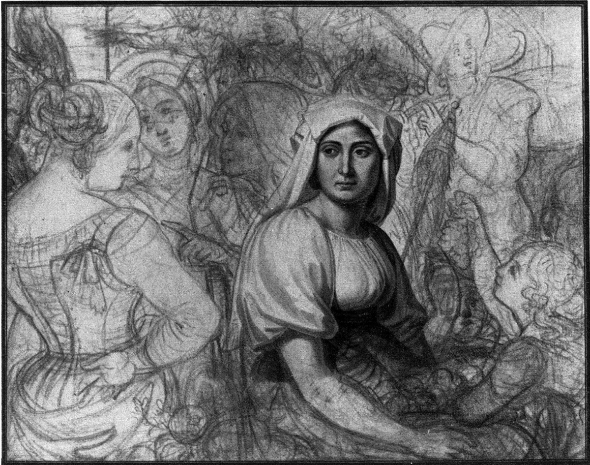
Weinlese in Italien (1812)

Kohle, Aquarell. 45,5 × 55 cm. Kunsthau Zürich, Graphische Sammlung.