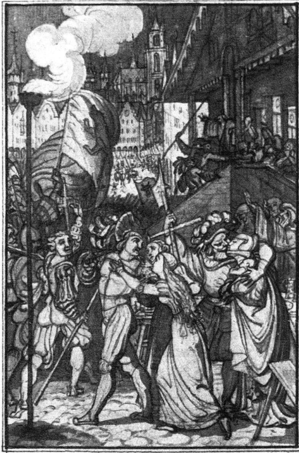
Auszug zur Schlacht von Murten

Bleistiftzeichnung, grau laviert. 14,5 × 9,5 cm. Kunsthau Zürich, Graphische Sammlung.