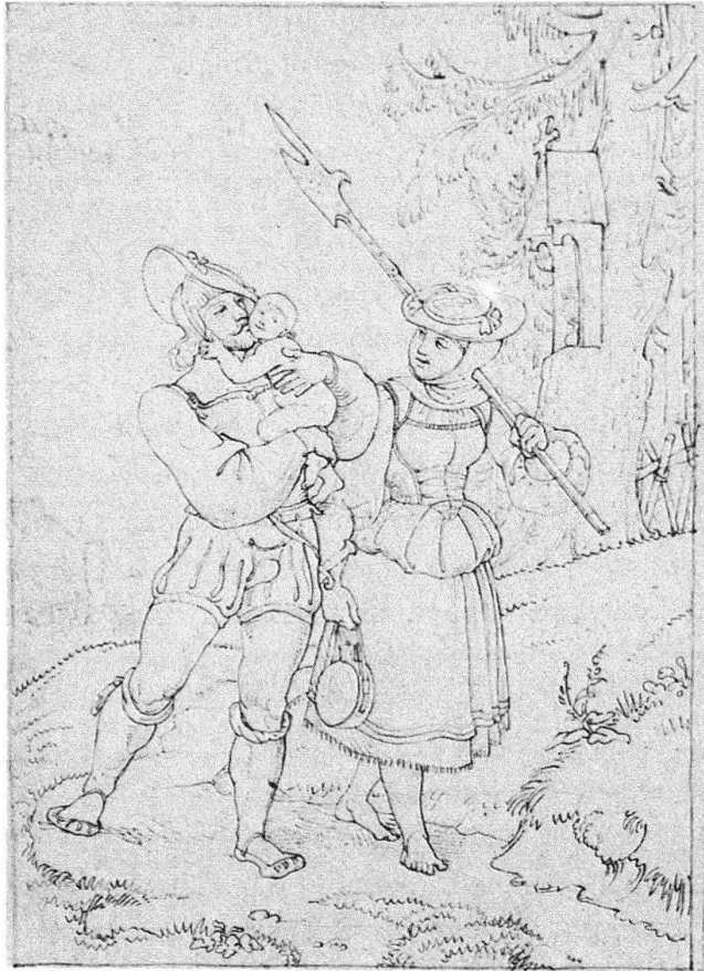
Heimkehr eines Eidgenossen

Feder über Bleistift. 13,3 × 9,2 cm. Kunstmuseum, Kupferstichkabinett Basel.