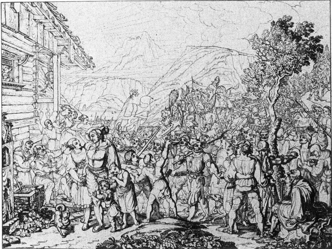
Heimkehr der Eidgenossen nach der Schlacht am Morgarten

Eigenhändige Umrisssradierung 1815. Darstellung: 18,4 × 24,6 cm. Erschienen in den «Weimarer Zeitschwingen». Das Ölgemälde befindet sich wahrscheinlich noch in Italien.