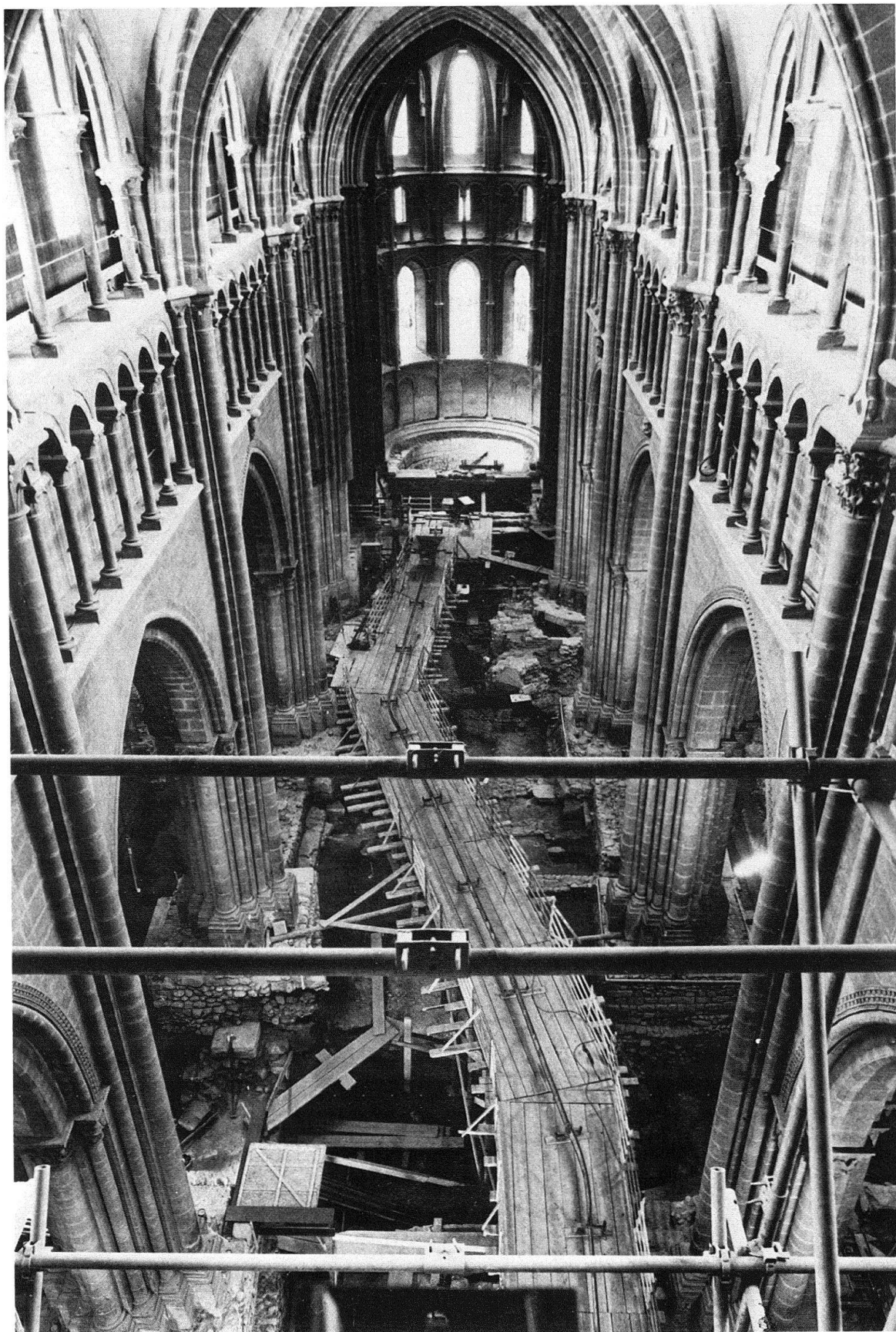
Fig. 1. Genève. Cathédrale St-Pierre. Les fouilles à l'intérieur