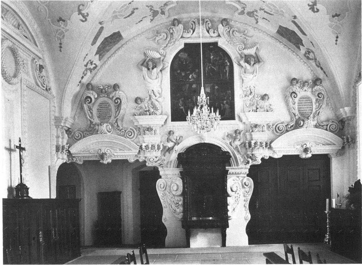
Abb. 12. Luzern, Sakristei der Jesuitenkirche. Ostwand mit Stukkaturen von Michael Schmutzer, am Gewölbe Régencestukkaturen von 1748