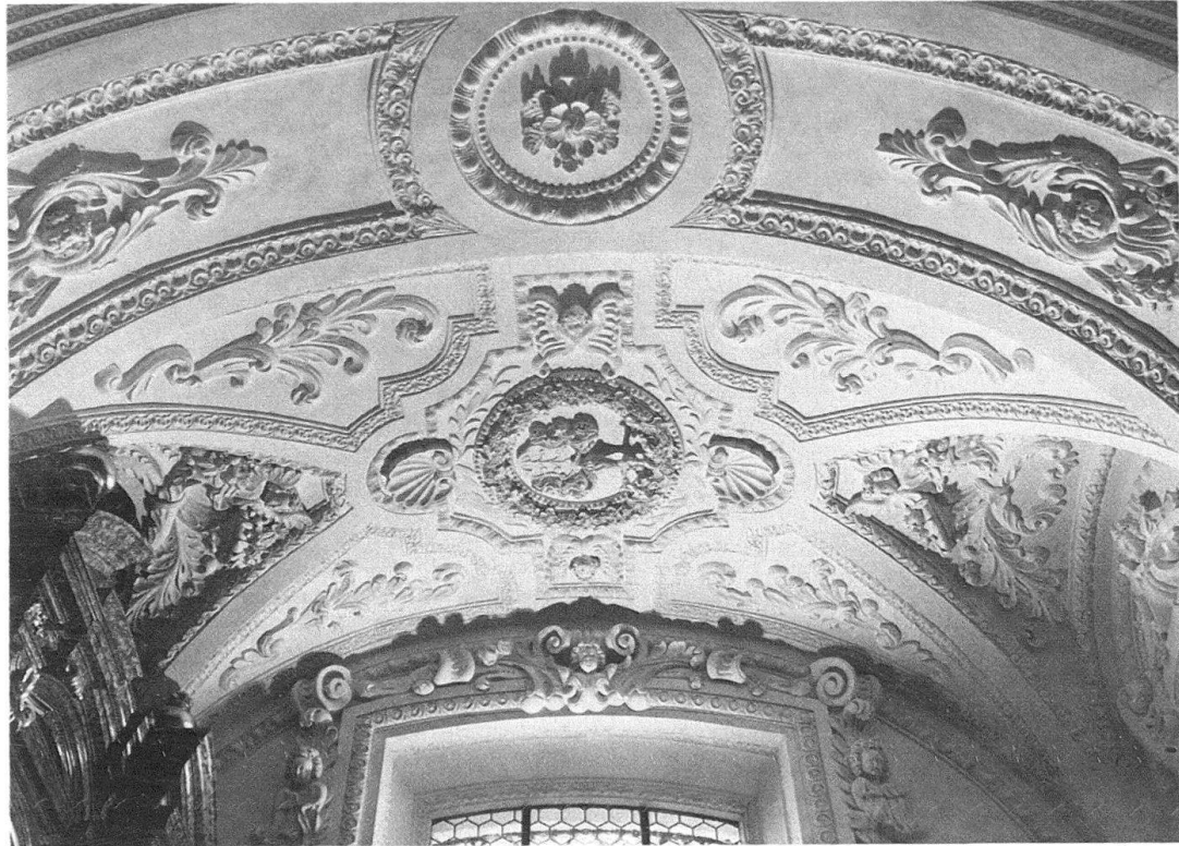
Abb. 14. Luzern, Jesuitenkirche. Zweithinterste Kapelle rechts, Bruder-Klausen-Kapelle, Deckenstück von 1672/73