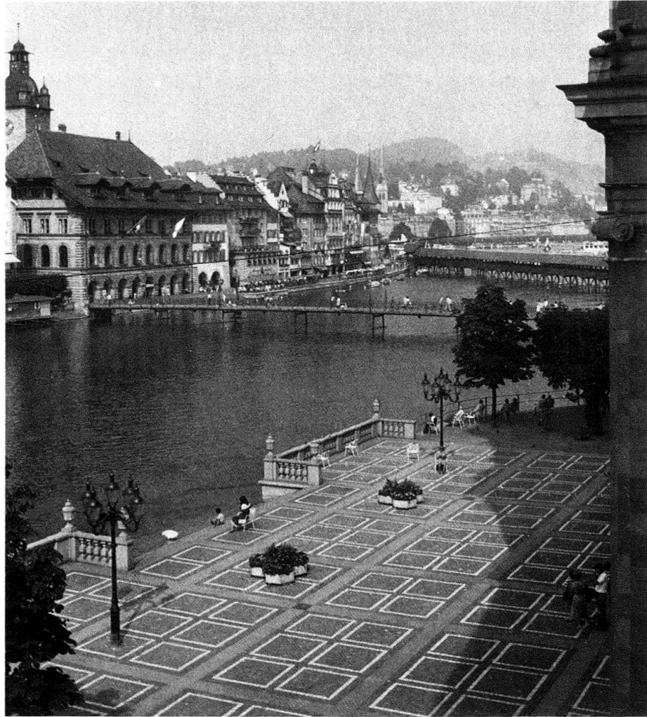
Abb. 18. Luzern, Vorplatz der Jesuiten- kirche, 1978 ange- legt

Vergangenheit für Früchte? Der so fade PTT-Neubau als Ersatz des einst vornehmen Hotel Du Lac von 1866–1887 oder der wiederholt misshandelte Seidenhof von 1886–1890, vormals eine massstäblich ausgewogene Raumwand in Zusammenhang mit Gulls Hauptpost von 1887 bildend und nun bedauerlicher Beweis städtebaulichen Versagens!