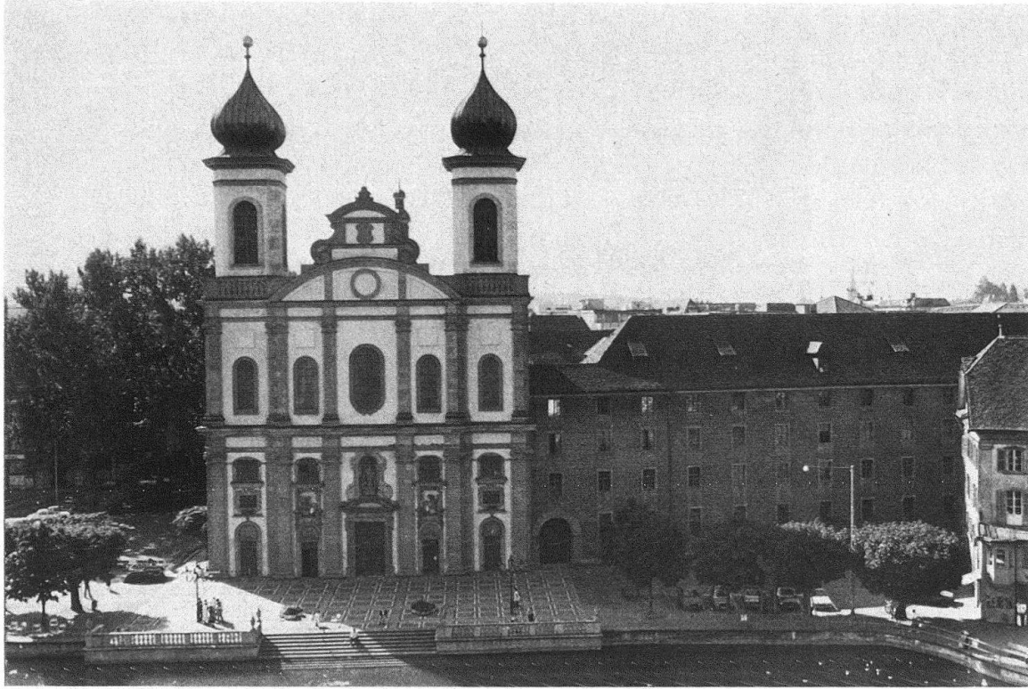
Abb. 19. Luzern, Jesuitenkirche mit Vorplatz von 1978

Siesta abzuhalten. Luzerns Fremdenstrom aber mündet von früh bis spät auf diesen geschätzten Vorraum, nicht ohne Rundgang durch den vierfach besternten Hauptraum. Und wenn vor Aufführung von Bruckners f-moll-Messe an den internationalen Musik-Festwochen die gehobene Welt sich auf der abendlichen Piazza einfindet, die Schwäne auf dem Fluss davor lautlos vorbeiziehen, und aus dem offenen Hauptportal der grossartige Hauptaltar mit seinem roten Stuckmarmor herausleuchtet, dann darf für die Gabe der Stadt an den Kanton und an alle Freunde Luzerns guten Gewissens gedankt sein – sogar von gegenwartsbefflissenen Architekten.