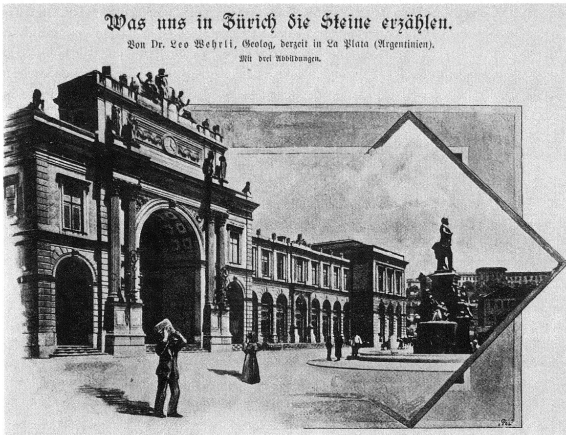
Abb. 3. Publikationen zu geologischen Spaziergängen auf Stadtgebiet: Aufsatz «Was uns in Zürich Steine erzählen» von Leo Wehrli in der Zeitschrift «Die Schweiz», 1897

ausgerlesenen Steinsorten schmücken die 1889–1891 erstellte Unionbank am Oberen Graben: Eingangssäulen aus rotem schwedischem Granit, 27 Pfeiler von grauweissem Granit aus dem Fichtelgebirge in Nordbayern (Vestibül, nicht erhalten), 18 Säulen im Schalterraum aus norwegischem Labradorgranit sowie deren Postamente aus Karst-marmor von Santa Croce bei Triest (nicht erhalten) 10 . Nicht in seinen geologischen Rundgang einbezogen hat Allenspach die 1885–1887 nach Plänen von Johannes Vollmer, Berlin, erstellte St.-Leonhards-Kirche, für die rund 20 verschiedene Gesteine und Kunststeine verwendet wurden 11 .