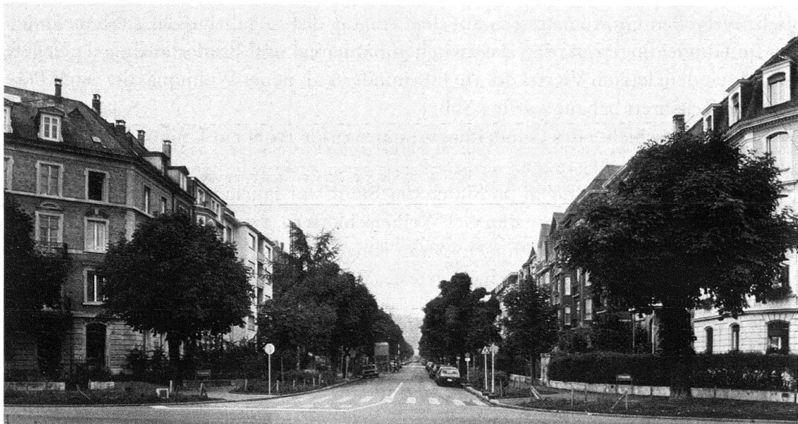
Abb. 2. Basel. Blick vom Bahnareal her in die Delsbergerallee und gegen das Bruderholz

Aus dem Ratschlag geht hervor, dass damals lediglich die quartierbegrenzenden Strassen, Münchensteiner- und Gundeldingerstrasse einerseits und Reinacher- und Margarethenstrasse andererseits, samt drei rechtwinklig dazu laufenden Querstrassen bestanden. Die nun neu geplanten Strassen und Plätze wurden auf Kosten der Immobilien-Gesellschaft erstellt. Zu ihnen gehört auch die Delsbergerallee, die wie die Thiersteinallee mit Bäumen versehen wurde, denn, wie der Ratschlag vermerkt: «auch für