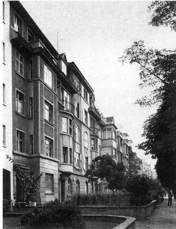
Abb. 3 und 4. Basel. Delsbergerallee 16–8 (von links nach rechts) und 11–27

diese besonders schöne Strasse erwartet man Liebhaber, die auf stattlichere Liegenschaften reflektieren». Nach Zustimmung des Grossen Rates begann die Gesellschaft 1874 mit dem Wiederverkauf des Bodens, der bis 1901 beendet war 2 .