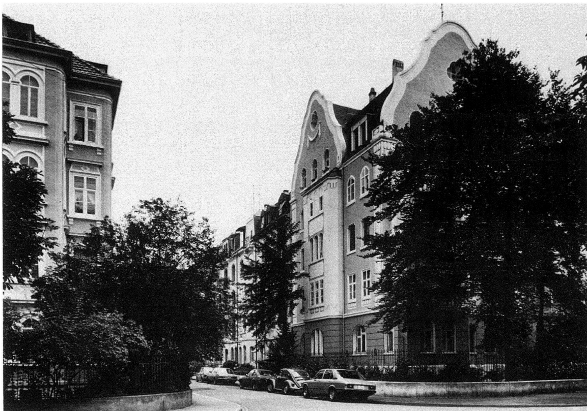
Abb. 5. Basel. Delsbergerallee 41, von Gustav Doppler, 1908

Leider blieb auch die Delsbergerallee nicht ganz von baulichen Eingriffen verschont. Der Basler Zonenplan von 1939, der der Stadt massive Aufzonungen brachte, sah für die Delsbergerallee die Bauzone 5a vor, die damals fünf Vollgeschosse erlaubte; in der Hochkonjunktur wurden jedoch zusätzlich ein Sockel- und ein Attikageschoss erlaubt, so dass nun eigentlich sieben Stockwerke möglich wurden. Dies bedeutete Anreiz zu Abbruch und Neubau. So überragen heute einige unschöne Neubauzähne das Gruppenbild.