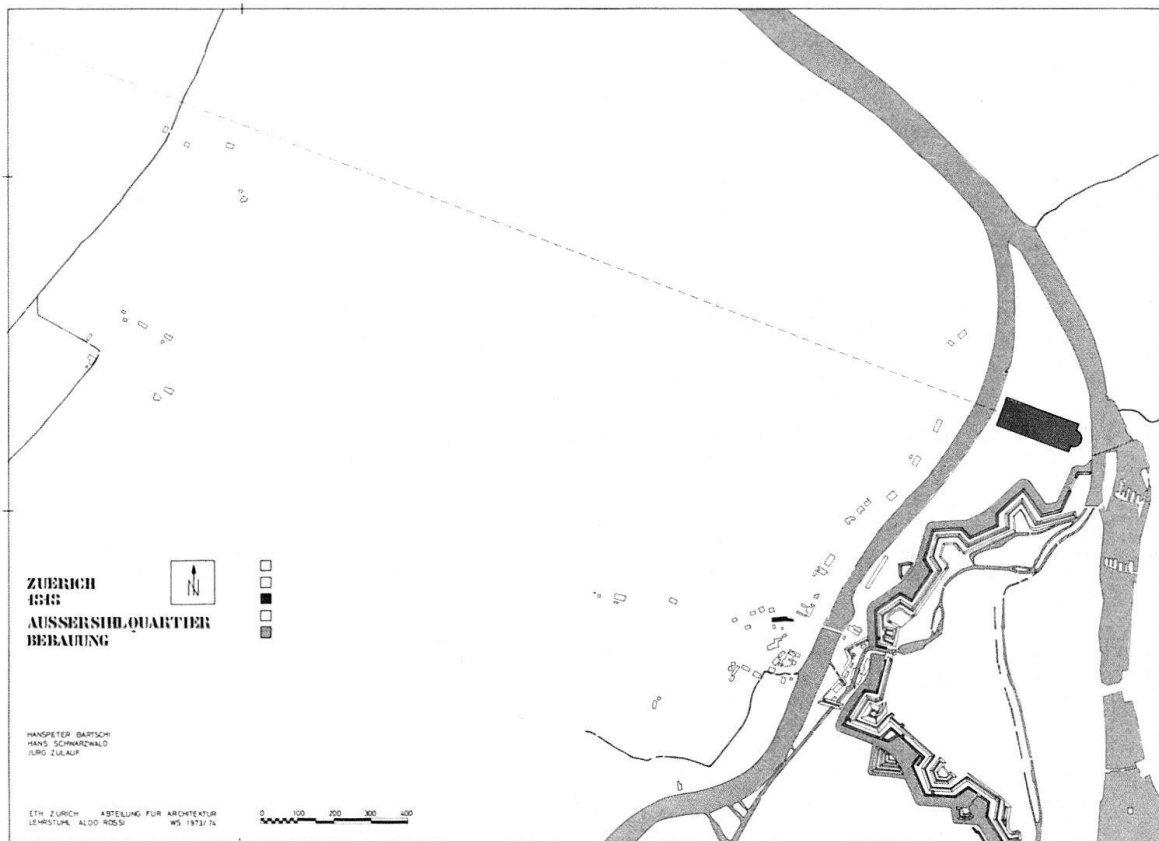
Abb. 1. Zürich. Wegnetz im südlichen Teil der Gemeinde Aussersihl im Jahre 1818. Die Eintragung des 1846/47 erbauten 1. Zürcher Bahnhofes verdeutlicht die Lage ausserhalb des Bollwerkes (nach Dietzingerplan)

Da umfassende, systematische Forschungen über diese Zusammenhänge mit Einchluss der baulichen Entwicklung in der Schweiz bislang fehlten 3 , schien es in den 1970er Jahren angebracht, diese Forschungslücke um einzelne möglichst systematische Fallstudien zu verkleinern. So begannen 1972 an der ETH Zürich unter dem Einfluss von italienischen Architektur- und Stadtuntersuchungstheorien 4 die ersten Arbeiten für die morphologische und typologische Untersuchung einzelner Stadtteile von Zürich 5 . Zürich und besonders die ehemalige Industrie- und Arbeitergemeinde Aussersihl eignen sich für eine Fallstudie deshalb besonders gut, weil hier die erste schweizerische Eisenbahnlinie die Verstädterung entscheidend beeinflusste, weil mit dem Ausbau der Neumühle zur Maschinenfabrik die bis ins letzte Viertel des 19. Jahrhunderts grösste an einem Ort konzentrierte schweizerische Unternehmung entstand und weil schliesslich Zürich gerade durch den verkehrstechnischen und industriellen Aufschwung die erste Grossstadt der Schweiz wurde.