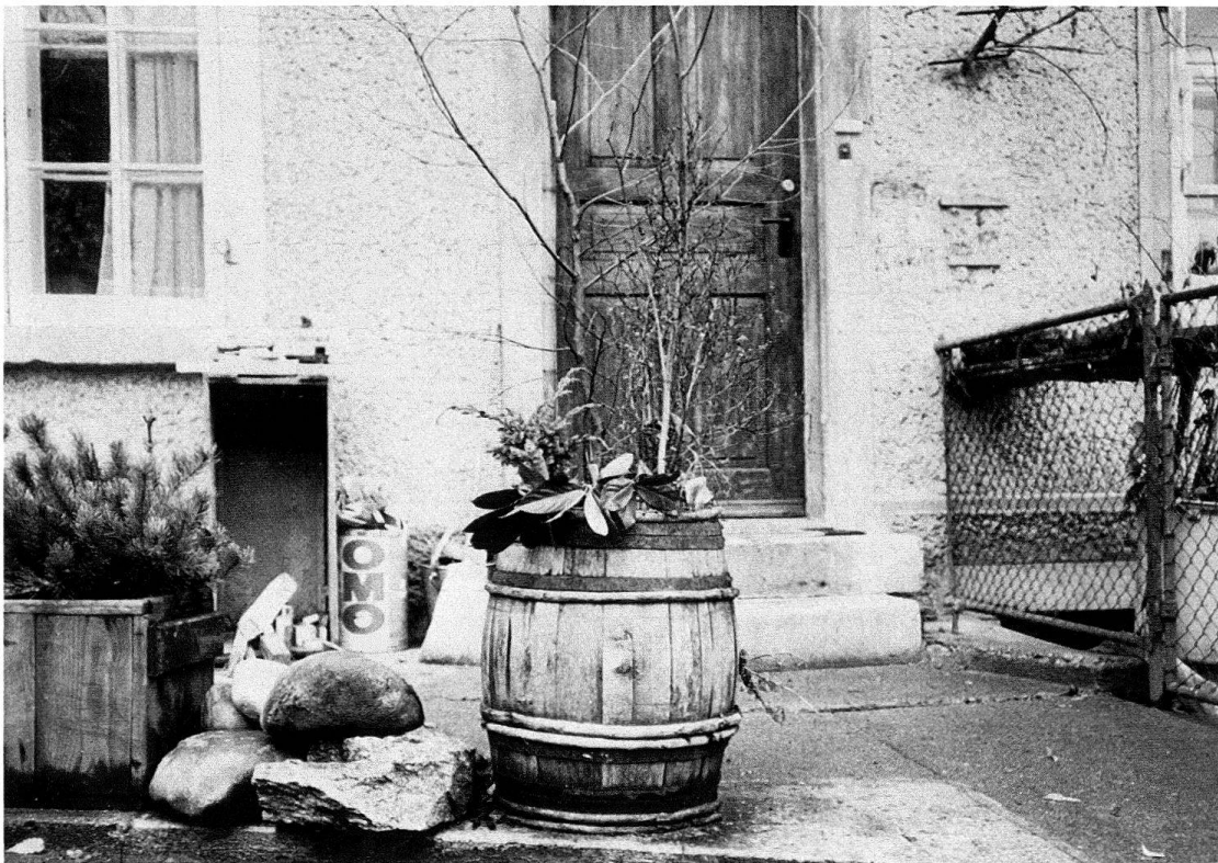
Abb. 1. Eingang eines Einfamilienhauses in einem Vorort von Zürich