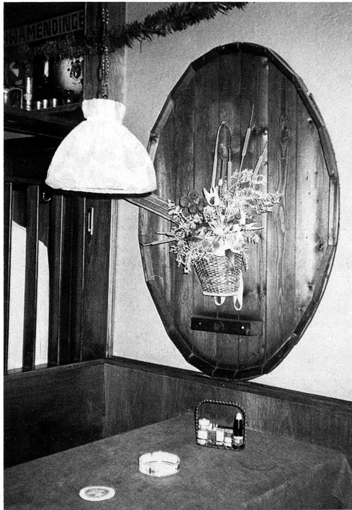
Abb. 3. Im Restaurant «Glattwies» in Zürich-Schwamendingen

Einsichten in das Wesen des Geschmacks nicht ins Lied der gegenseitigen Unterscheidung oder gar Abwertung der verschiedenen Kulturstile untereinander einstimmen. Er fragt sich, was der Grund für die weite Verbreitung und recht grosse Bedeutung der Zweitnutzung von Gegenständen sein kann (und er wird dabei auch den merkwürdigsten Zeitschriftenartikel mit «Bastelvorschlägen» ernst nehmen). Ob er wohl richtig liegt, wenn er die Lust der Menschen auf alte, zweitgenutzte Gegenstände in einem engen Zusammenhang mit der Suche nach einer kulturellen Position sowie mit dem Bedürfnis nach Sicherheit und Beharrung in einer schnellen Zyklen unterworfenen Objektwelt sieht?