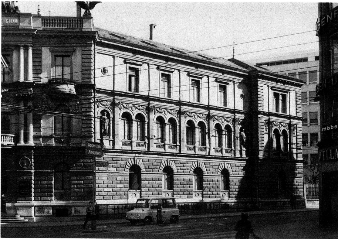
Abb. 1. St. Gallen, «Helvetia Feuer», Versicherungsgebäude erbaut von Christian Johann Kunkler, 1876–1878, abgebrochen

handene Bereitschaft, alte Bausubstanz weiterzuverwenden, um- oder neuzunutzen, massgeblich für die zahlreichen Abbrüche von erhaltenswerten Bau- und Kulturdenkmälern verantwortlich. Der seinerzeit vieldiskutierte Abbruch des Helvetia-Versicherungsgebäudes in St. Gallen ist nur eines der vielen Beispiele hierfür. Auch wenn immer wieder die Baufähigkeit, grundrissliche Unzweckmässigkeiten, mangelhafte sanitärische Installationen und andere Gründe vorgeschoben werden, so sind eben letztlich doch die in Aussicht genommene Mehrnutzung und Gewinnoptimierung die wahren Beweggründe, denen Altbauten zum Opfer fallen. Die bereits weit fortgeschrittene und noch anhaltende Zerstörung der einst einheitlichen 19.-Jahrhundert-Wohnquartiere ist wohl der sichtbarste Ausdruck dieser Verhaltensweise. Von einem Nutzungsnotstand kann hier nämlich kaum gesprochen werden. Dieser trifft vielmehr für Bauten der Technik und der Industrie zu, als für die im allgemeinen nutzungsneutraleren Wohnbauten. Immerhin gibt es auch hier Ausnahmen. Die noch zu schreibende «Geschichte der Abbrüche» kennt vor allem aus dem Gebiet des 19.-Jahrhundert-Villenbaus einige bedauernde Beispiele, denen sich als jüngstes Glied – wenn nicht alles täuscht – die wegen fehlenden Nutzungsmöglichkeiten leerstehende und vom Abbruch bedrohte romantische Schlossvilla Neuhabsburg (1868–1871) in Meggen anreicht.