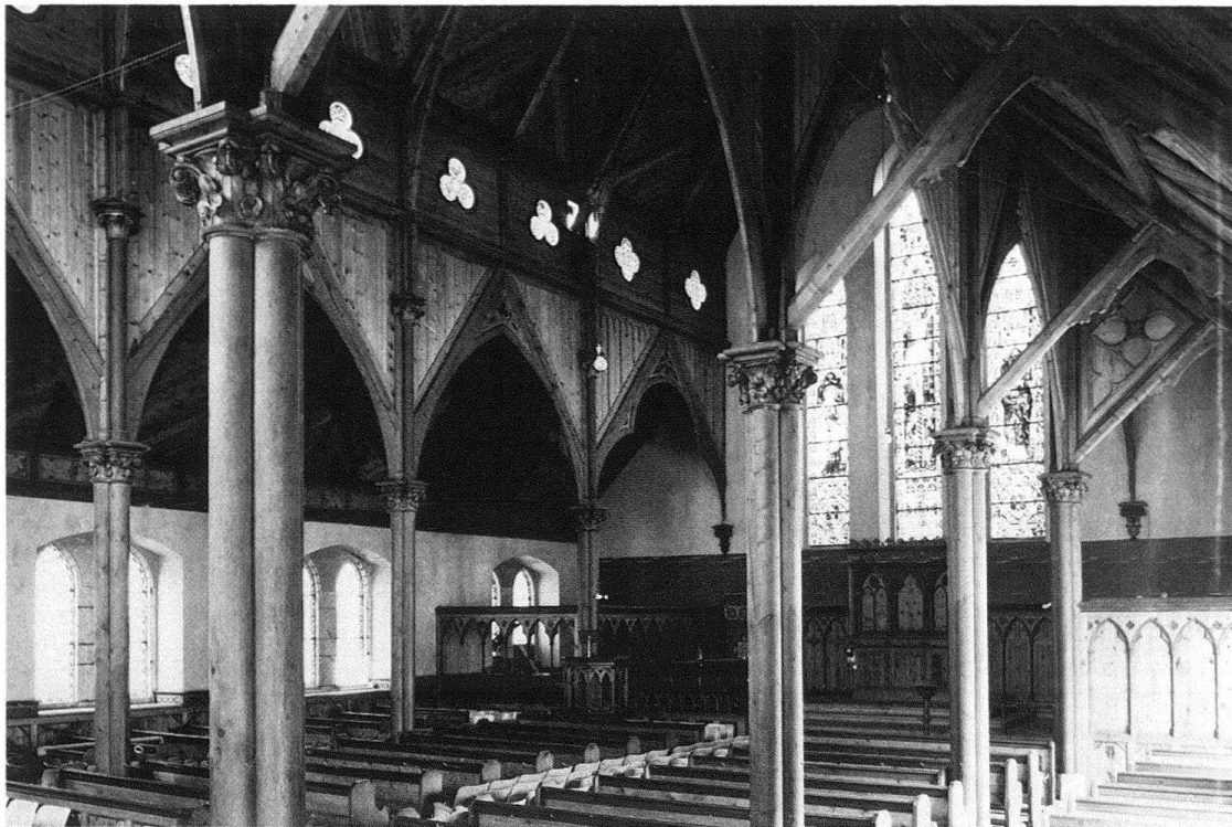
Abb. 5. Pontresina, ehem. Holy Trinity Church, erbaut von Richard Poppewell Pullan, 1882, 1973 abgebrochen

neuer Kirchen zu dokumentieren, den Rückgang der traditionellen Volksfrömmigkeit (Prozessionen, Wallfahrten, Kirchenfeste, Heiligenverehrungen) und das vermehrte Bedürfnis von Mehrzweckräumen (Jugendseelsorge, Jugendtreffs) anstelle reiner Andachtsräume.